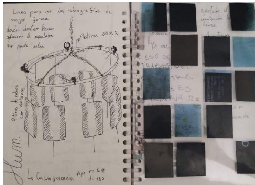
Figura 3 fotografías del scrapbook 2023

Para hacer esto posible, este ensayo cuenta con escritos que narran los trabajos que se realizan desde principio de año qué cosas se hicieron reflexiones qué emociones salen a flote, por qué utilizaron técnicas de arte contemporáneo o porqué no y si se debería seguir ocupando alguno de esos métodos, para así realizar una introspección que ayuda a crear un camino para saber cómo continuar la experimentación. Acompañado por una bitácora física que funciona como un scrapbook , con recortes de los diferentes dibujos que he realizado en diferentes libretas, los escritos en el transporte público, imágenes, pruebas visuales, radiografías y todo tipo de dato relevante. Es básicamente una recolección de cada pequeño pensamiento que surge en torno al trabajo que funciona para llevar registro del día a día y poder traspasarlo como base para el diálogo siendo consciente de lo que se realiza y porqué.