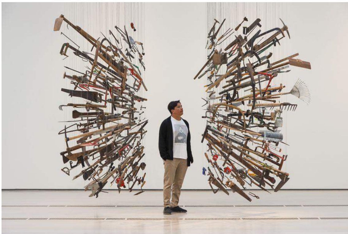
Imagen 5 Damían Ortega, Controller of the Universe (2007) herramientas encontradas y alambres

anterior se decidió generar un híbrido entre ambos conceptos y generar una cadena flotante que pareciera cortada, está unida al objeto pero tiene una continuación de alambre del color de la habitación.