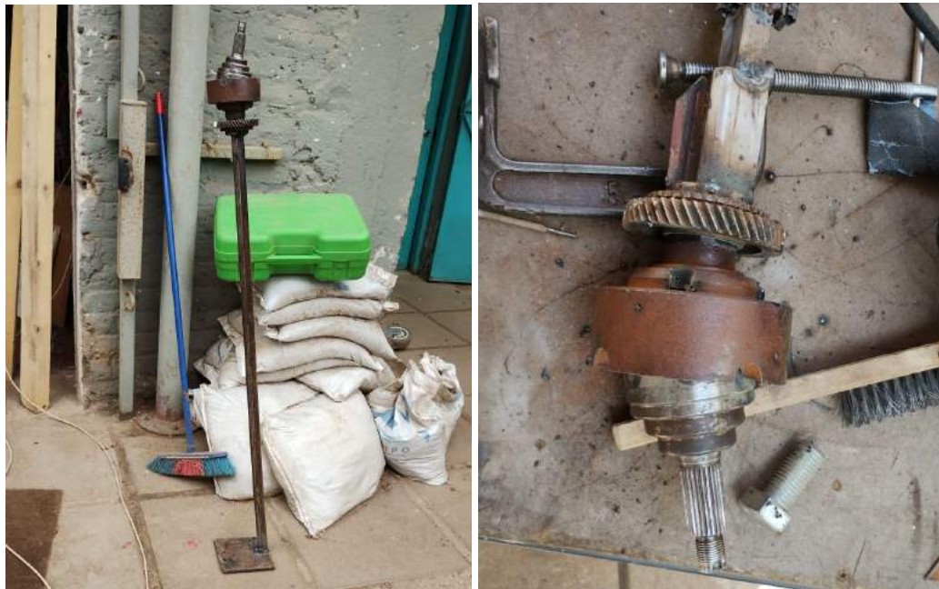
figura 6 fotografías del taller de escultura, 2023

Enfatizando así la mencionada anterior necesidad de búsqueda de autoconocimiento mediante la creación y generar una diégesis. Además del uso de radiografías en suspensión para que no exista duda al abordar el archivo, como parte de la creación , como parte de la creación. ya que la radiografía es aquello que deja ver una realidad oculta a simple vista un malestar que no se entiende o conoce hasta que se ve.