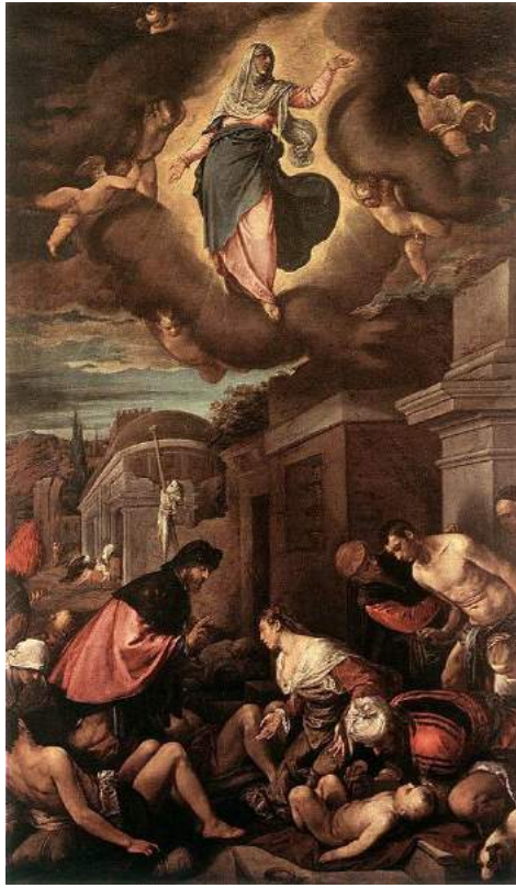
Figura 1 San Roque entre las víctimas de la peste y la Virgen en la Gloria . Jacopo Bassano 1575. Pinacoteca de Brera, Milán.

Visibilizar el dolor quita estigmas a las enfermedades, les saca el aspecto mítico para hacerlas más reales y alcanzables con las que el espectador se puede sentir identificado, ya que, es algo natural en los humanos el generar conversaciones que pueden ayudar a las personas que atraviesan dolencias a tener nuevas perspectivas de ello. Como lo hacen artistas como Frida Kahlo que trabaja su discapacidad, un gran ejemplo de esto es su obra La columna rota (1944) que se puede apreciar en la figura 2, donde se ve un autorretrato de ella con un torso abierto dejando expuesta una columna arquitectónica en pedazos jugando así con el doble significado de la palabra, toma de manera no literal la representación usando un objeto con la capacidad de comprenderse de manera diferente por medio de la lengua. Lo que hace la pieza más profunda ya que, se comprenden más aristas de la creadora y los problemas que enfrenta. Este fenómeno lo explica el autor Arechavala “El arte rompe, fragmenta, fisura la cotidianidad para permitirnos insertarse en ella con nuevas perspectivas, nuevas visiones, a través del ojo que nos presta el