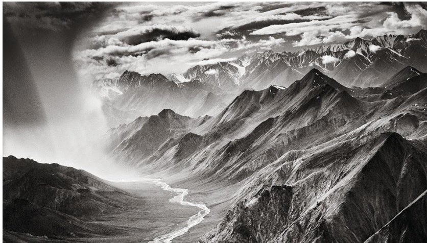
Imagen 12: GENESIS by Sebastian Salgado at International Center of Photography [NYC]