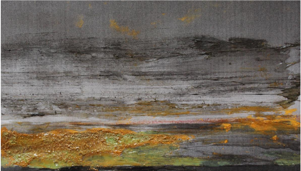
Imagen 4 Sin título, 2017 Daniela González Fotografía intervenida 2,50 x 3,00 m.

Pase varios años en los cuales me dediqué a realizar otro tipo de cosas, absteniéndome de trabajar en mis proyectos de arte. Cuando logré retomar ya había pasado el tiempo pero volví a trabajar el mismo tema que desde mis inicios había sido lo que me apasionaba y es el paisaje natural.