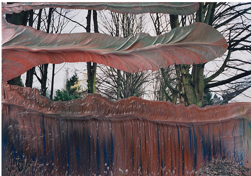
Imagen 9: Gerhard Richter. 8. Sept. 04. Colección privada, Alemania. Publicada en el libro "Gerhard Richter. Overpainted Photographs" Hatje Cantz Verlag, Ostfildern 2008

La fotografía es una representación inofensiva de la realidad, pero dado que la realidad pasa y solo puede retenerse en forma de imagen, las imágenes ya no son inofensivas y así las instantáneas se terminan convirtiendo en pequeñas imágenes de devoción. 7