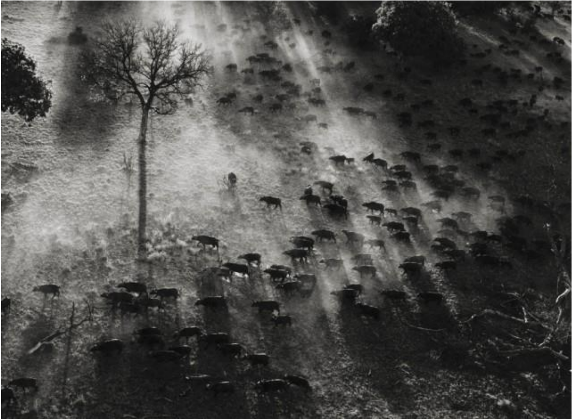
Imagen 15: GENESIS by Sebastian Salgado at International Center of Photography [NYC]

Sebastián Salgado intenta mostrarnos los orígenes del mundo y del planeta en que vivimos en su proyecto “Génesis“. Su personal visión nos ofrece una perspectiva dura, a veces cruel que invita a la reflexión y al debate. En esta exposición se presentan fotografías de paisajes, animales y personas alejadas del mundo moderno: regiones vastas y remotas, intactas y en silencio, donde la Naturaleza es quien gobierna el transcurso del tiempo y de la vida.