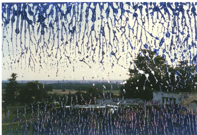
Imagen 10: 14.8.94 1994 9.9 cm x 14.9 cm Oil on colour photograph