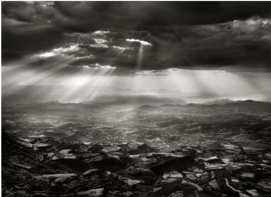
Imagen 16 y 17: GENESIS by Sebastian Salgado at International Center of Photography [NYC] 10