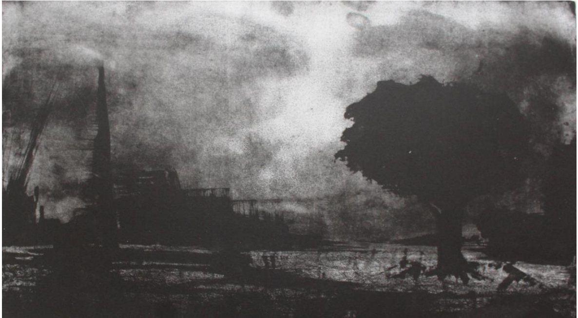
Imagen 1: Paisaje, 2009 Daniela González Litografía Tec. Grabado 20 x 35 cm

Siempre mi enfoque de interés relacionado con el paisaje natural, me interesaba investigarlo y representarlo de diferentes maneras y formas, es por eso que desde la especialidad de grabado fue siempre este el tipo de paisajes que realicé, en algunos de mis trabajos era más realista o en otros algo más abstracto. Mientras más me involucraba con el paisaje, más me atraía su infinidad de estudios, formas y diseños en el cual me podía ir involucrando. Tomé el paisaje y no lo solté más. El estudiar algunas técnicas de grabado con tinta negra, hacía que pudiese ver aún más la simpleza del paisaje ya que era sólo la representación de su esencia.