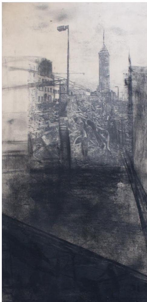
Imagen 2: Paisaje 1, 2010 Daniela González Técnica mixta sobre madera 40 x 25 cms

En una segunda etapa la imagen de mis grabados pasaron a otro soporte, a la madera, como forma de llevar este lenguaje a la experimentación desde otras materialidades.