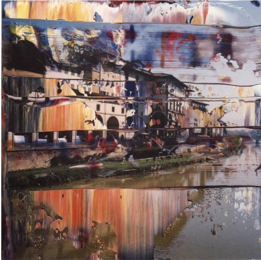
Imagen 11: 9. Febr. 2000 [Florence] 2000 12 cm x 12 cm Oil on colour photograph