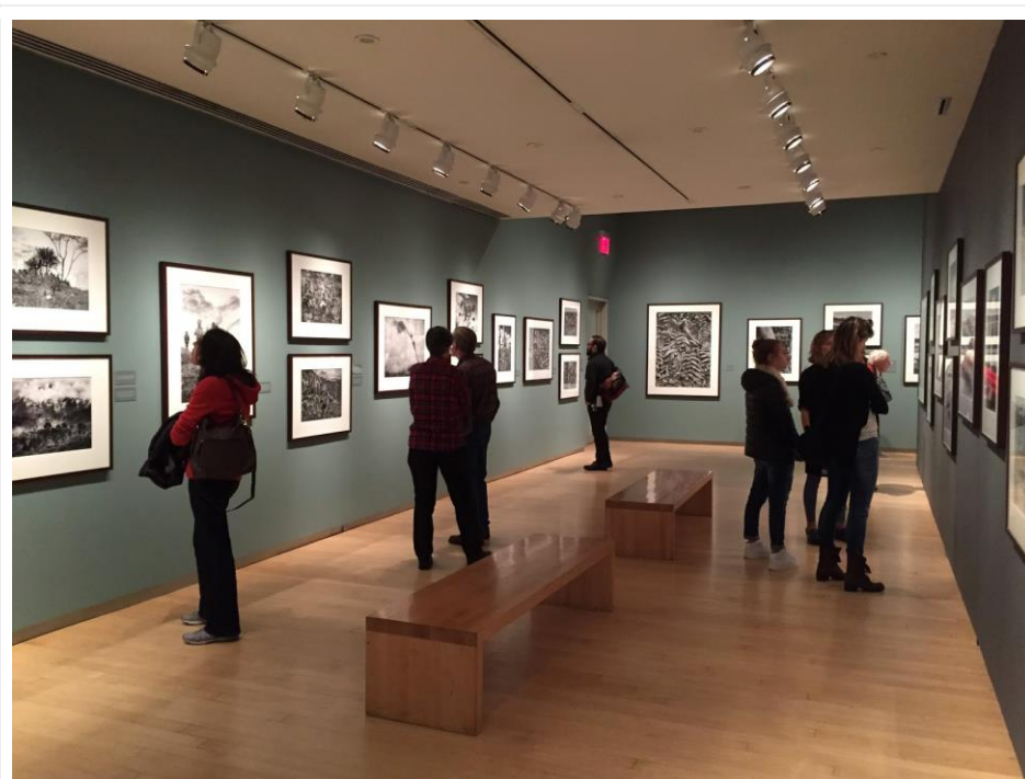
Imagen 13: Sebastian Salgado exhibition at the International Center of Photography ICP