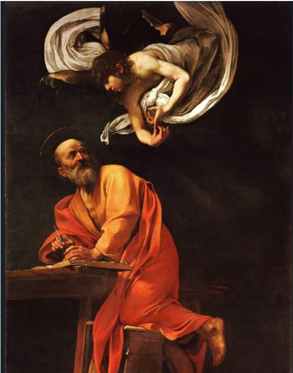
Imagen 29 "La Inspiración de San Mateo" Michelangelo Merisi de Caravaggio. 1602.