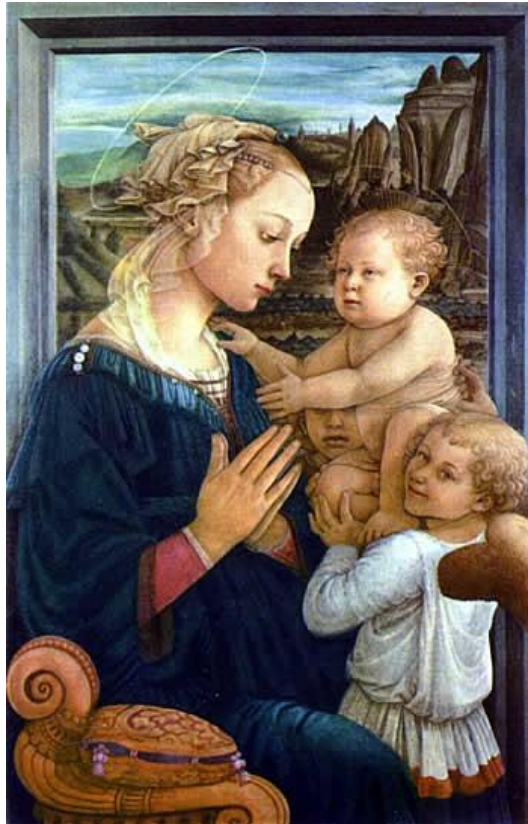
Imagen 28 "Virgen con niño y ángeles". Filippo Lippi. 1450.