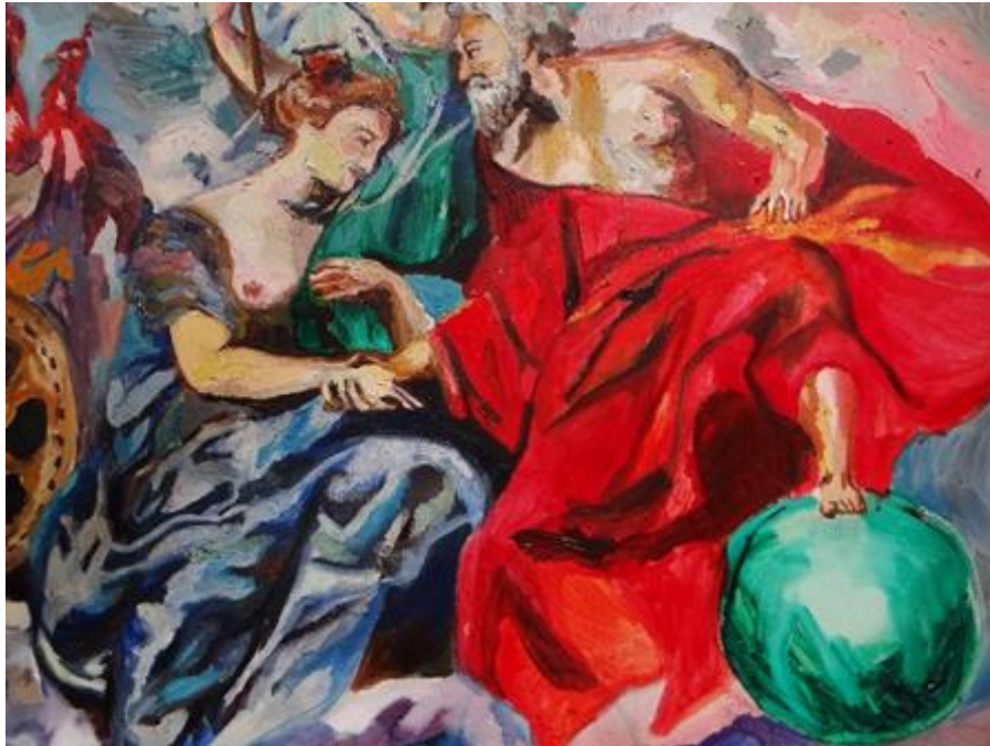
Imagen 6 Detalle: "Jueves: La Expansión". Isabella Gazzano Zóttele. 2020.

En particular, relacionando la imagen y el color como elementos expresivos vinculados al conocimiento y alegorías de la historia de la humanidad; en alusión a las polaridades, por ejemplo, elijo la representación de los arquetipos de la afirmación, la paternidad, el amor, a través del uso del color azul y, por otro lado, elijo el color rojo representando sentimientos, amor elevado, eros, espiritualidad.