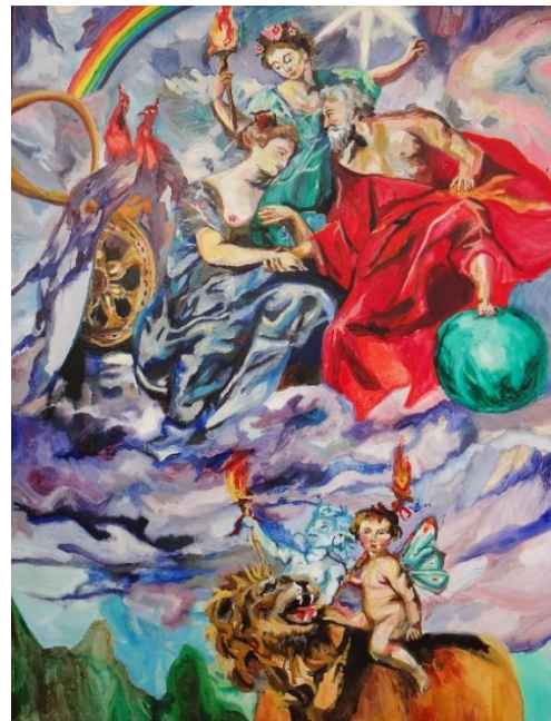
Imagen 25 "jueves: "Júpiter: Compromiso".