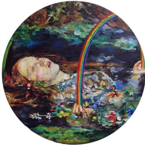
Imagen 4 "Ofelia". Isabella Gazzano Z. 2018.

Es a partir de aquellos ejercicios que he cuestionado también, el cómo poder representar mediante el uso de la pintura al óleo sobre lienzo el concepto de; la “vida y la muerte” para mi examen de grado.