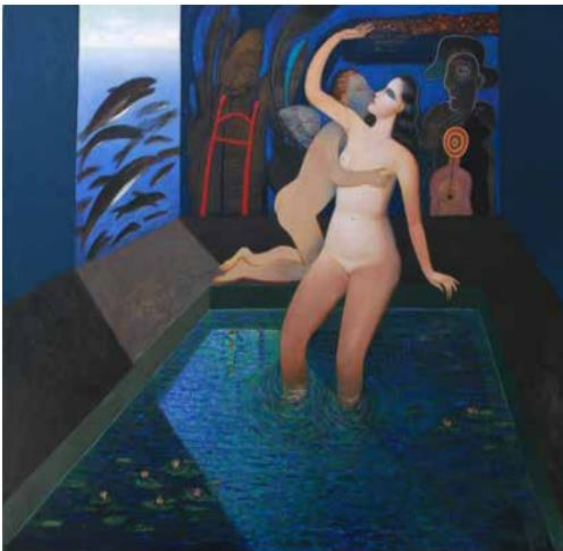
Imagen 16 "Cupido sorprende a Venus con Danza Acuática".