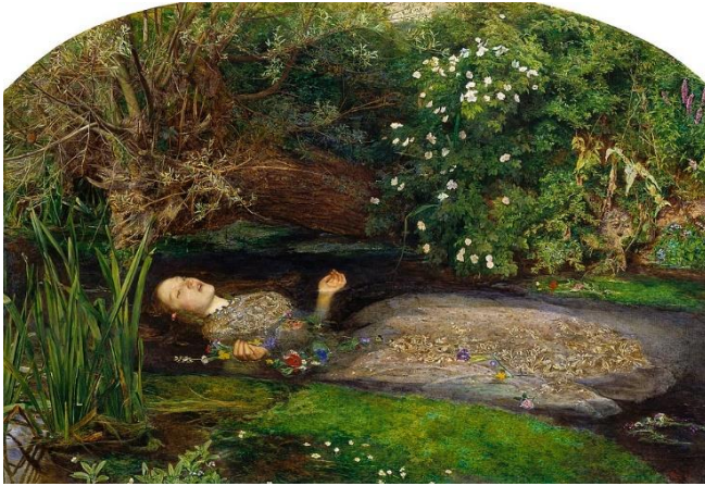
Imagen 3 "Ofelia". John Everett Millais. 1851.