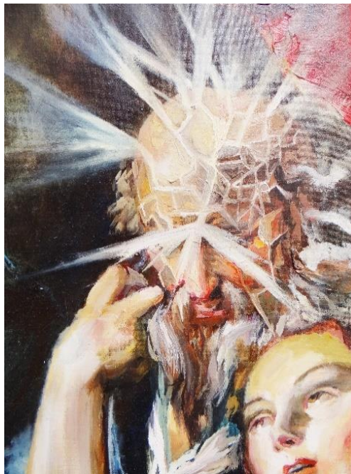
Imagen 8 Detalle: "Muerte". Isabella Gazzano Zóttele. 2020. Fuente propia.

Mi obra "lunes: La Vida y La Muerte" (imagen 19), parte de los momentos finales de la vida de Cleopatra, donde se marca un hito en la historia de la