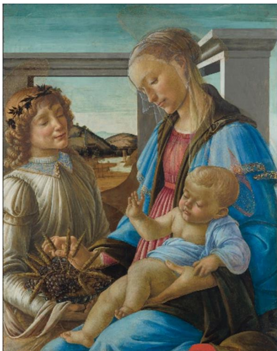
Imagen 26 "Virgen con el Niño y el Ángel". Sandro Botticelli. 1470.