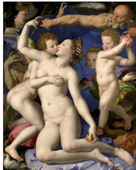
Imagen 17: "Alegoría con Venus y Cupido".