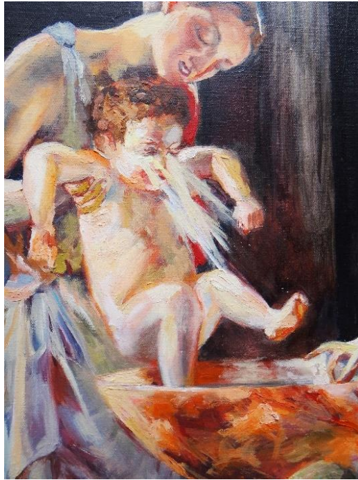
Imagen 7 Detalle "Nacimiento". Isabella Gazzano Zóttele. 2020.