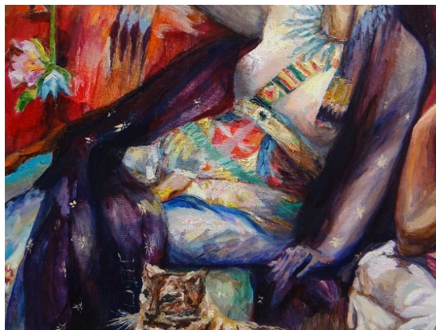
Imagen 10 Detalle: "lunes: La Vida y La Muerte". Isabella Gazzano Zóttele. 2020.