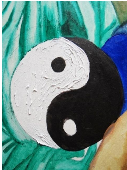
Imagen 11 Detalle: "viernes: Venus Diosa del Cosmos". Isabella Gazzano Zóttle. 2020.

Como figura simbólica elijo el Yin y el Yang, considerado un principio filosófico y religioso, que explica la existencia de dos fuerzas opuestas pero complementarias, que son esenciales en el universo: el Yin asociado a lo femenino, la oscuridad, la pasividad y la tierra; y el Yang, vinculado a lo masculino, la luz, lo activo y el cielo. Algunos ejemplos que ilustran la filosofía Yin Yang son; día y noche; vida y muerte; enfermedad y salud; pobreza y riqueza.