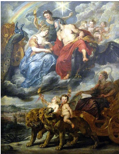
Imagen 24 "Encuentro de María de Medici y Enrique IV en Lyon".