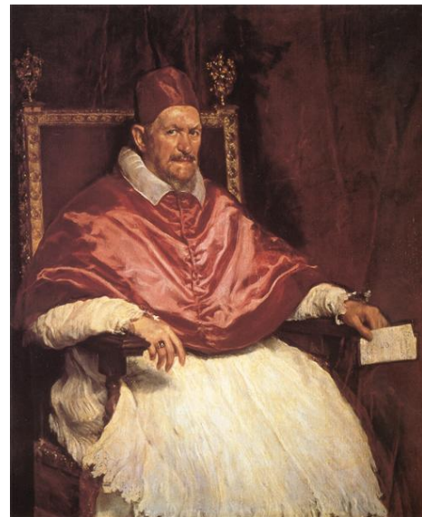
Imagen 15 Papa Inocencio Diego de Velásquez. 1650

A su vez, al hacer que algo suceda más de una vez, tenemos un objeto a evaluar y las variaciones en ese acto de magia permiten explorar la igualdad y la diferencia; la práctica se convierte en narración (...) los movimientos que se consiguen