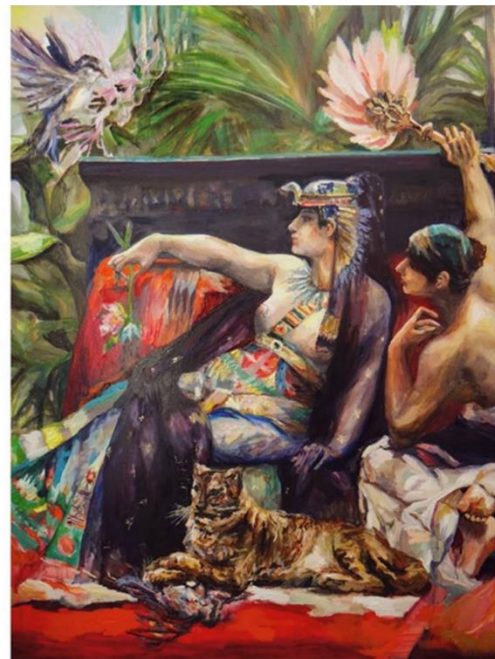
Imagen 19 "Lunes: Vida y Muerte". Isabella Gazzano Z. 2020.

Esta es una obra pintada por Cabanel (Montpellier; Francia, 1823 – París 1889), de estilo academicista, muestra una original versión de los momentos previos al