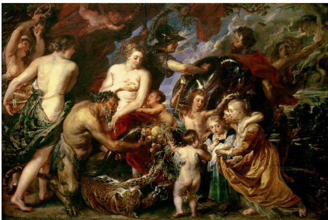
Imagen 20 "Minerva protege a Pax de Marte". 1629. Peter Paul Rubens.