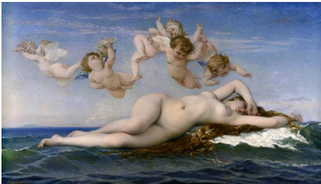
Imagen 1 "El Nacimiento de Venus". Alexandre Cabanel. 1863. Fuente: www.wikipedia.org

Cursando el segundo año de mi carrera surgió en mí la necesidad de recrear las obras de antiguos pintores, naciendo así las obras: “Venus con molotov” (2018) inspirada en Cabanel (Montpellier; Francia, 1823 – París 1889); “Ofelia” de Millais (Southampton; Reino Unido 1829 – Kensington 1896) y “El buen Pastor” de Murillo (Sevilla; España – 1617 – Sevilla 1682). Y, posteriormente; “El Baño” de Charles Gleyre (Chevilly; Suiza 1806 – París; Francia 1874) y “Lot y sus hijas”; de Joachim Wtewael (Utrecht; Países Bajos 1566 – Utrecht 1638).