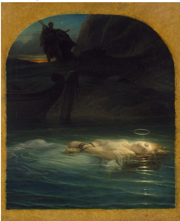
Imagen 31 "La Joven Mártir". Peter Paul Delaroche. 1855.