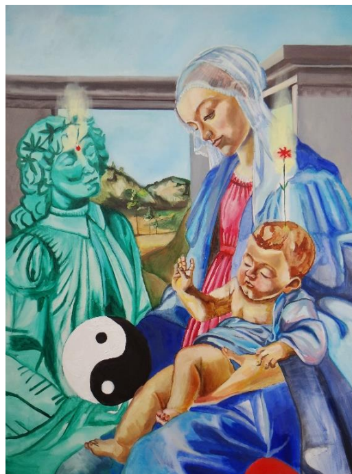
Imagen 27 "viernes: Venus Diosa y Eternidad". Isabella Gazzano Zóttel. 2020. Fuente propia.

En esta obra Botticelli sigue un modelo clásico dentro de la iconografía cristiana de María: El Hortus Conclusus o -Jardín rodeado de un muro alto, con paisaje-. El cesto que el ángel presenta a la Virgen, conteniendo espigas y uvas, profetiza el acto sacramental; es una referencia simbólica al pan y al vino de la eucaristía y, por lo tanto, a la encarnación humana de Dios. Puede verse un modelo de Virgen seria, meditabunda, abstraída en su propia belleza. Aquí la ternura y amabilidad, proviene del ángel sonriente.