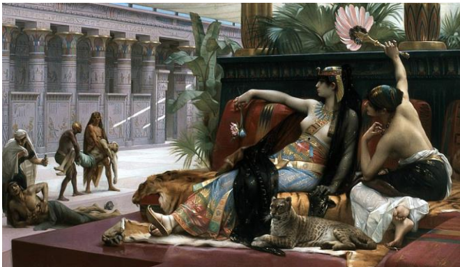
Imagen 18 “Cleopatra probando venenos en prisioneros condenados a muerte”. Alexander Cabanel. 1887.