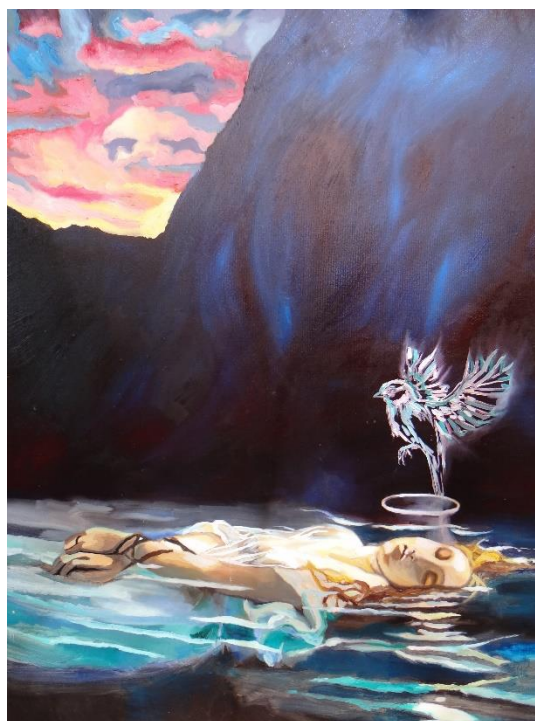
Imagen 32 "Domingo: Atardecer"