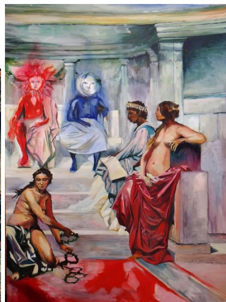
imagen 23 "miércoles: Anima Mundi". Isabella Gazzano Zóttele. 2020 Fuente propia.

De estilo "academicista", esta obra es un mural de 27 metros de largo que representa a 75 grandes artistas de variadas edades, algunos se encuentran reunidos en conversación sobre escalones de mármol blanco. En el escalón más alto de ellos, hay tres tronos ocupados por los creadores del Partenón: el arquitecto Fibiás, el escultor Ictino y el pintor Apeles; simbolizando la unidad de estas artes. Dicho mural preside el hemiciclo del Teatro de "La Escuela de Bellas Artes de París". Como elemento femenino en esta colosal composición son las musas, quienes, apoyadas en la barandilla de la escala, representan idealizadas figuras femeninas.