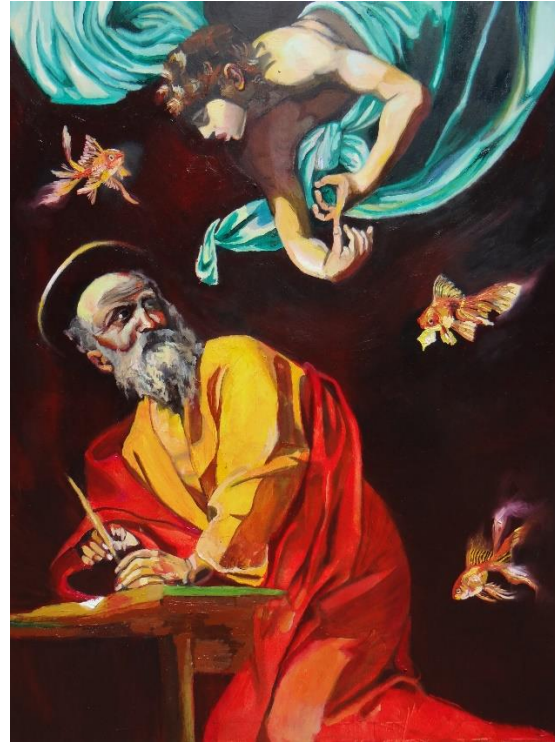
Imagen 30 "sábado: Inspiración de Saturno" Isabella Gazzano Zóttele. 2020.

La obra pertenece al “Barroco” y lo efectúa Caravaggio en el año 1602. La composición está orientada en sentido ascendente. San Mateo escribe sin ayuda del ángel, que se limita a dictarle enumerando los versículos con ayuda de las manos. En concreto, se trata del segundo versículo (Mateo, 1979), en el que Abraham inicia la estirpe de Cristo. Además, el ángel se encuentra en las alturas, marcando su autoridad y la diferencia de jerarquías entre ambos. En contraste; la actitud del santo refleja seguridad y firmeza y su postura sobre la banqueta, muestra