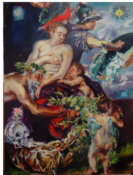
Imagen 21 "Martes: El Ciclo de la Vida" Isabella Gazzano Zóttel.2020