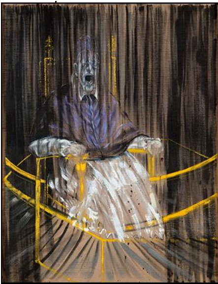
Imagen 14 "Estudio de Retrato de Papa Inocencio X de Velásquez"

Me interesa Francis Bacon (nace en Dublín Irlanda 1909 – Madrid, España 1992) por sus citas y reinterpretaciones de cuadros y obras de maestros. Clave es la obra “Estudio del retrato del Papa Inocencio X” de Velásquez” (Sevilla, España 1599 – Madrid, España 1660); en donde muestra a un Papa a ratos con una carga tormentosa y oscura: