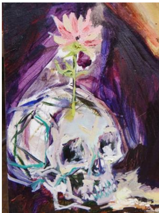
Imagen 13 Detalle. "martes: Ciclo de la Vida". Isabella Gazzano Zóttele. 2020.