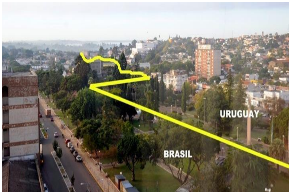
Plano y registro fotográfico del recorrido del artista por la frontera

Realizó su proyecto en la región fronteriza de las Pampas, especialmente en la comunidad binacional de Santana de Livramento (Brasil) y Rivera (Uruguay), divididas solo por una frontera imaginaria. Ambas fueron el escenario que acogió al artista, donde éste se involucró con la comunidad.