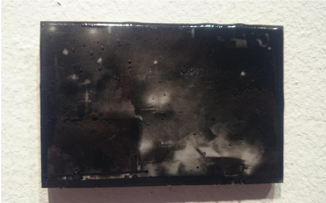
Tinta china, carboncillo sobre papel y resina 10 x 12 cm (2015)