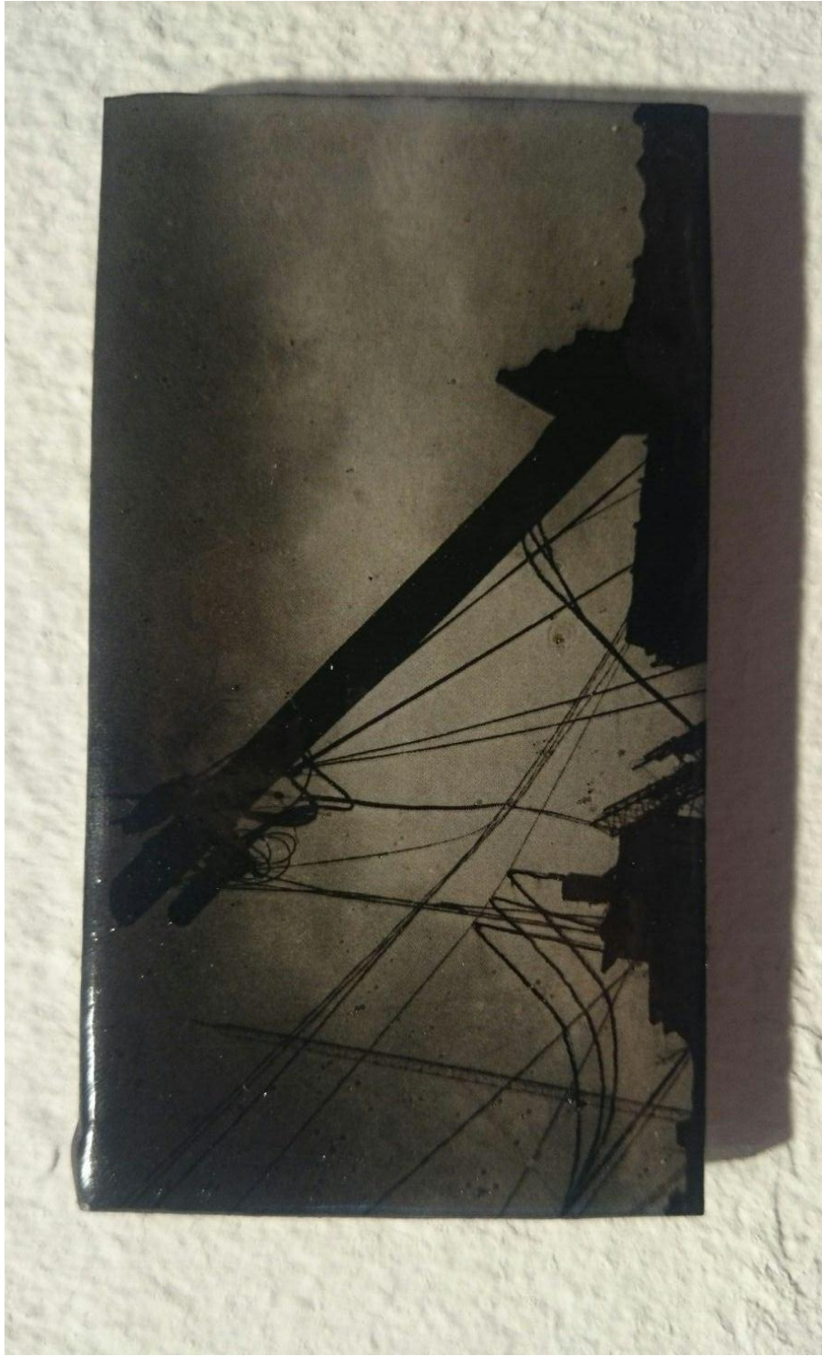
Carboncillo sobre cartón y resina 10 x 12 cm (2015)