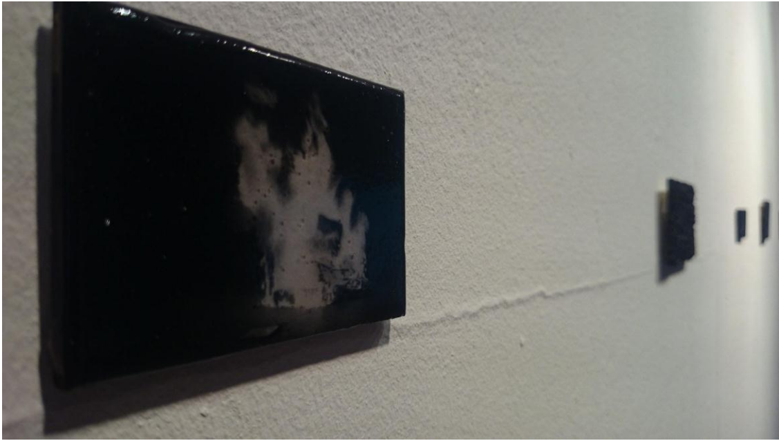
Dibujo carboncillo sobre papel tamaños variables cm (2015)