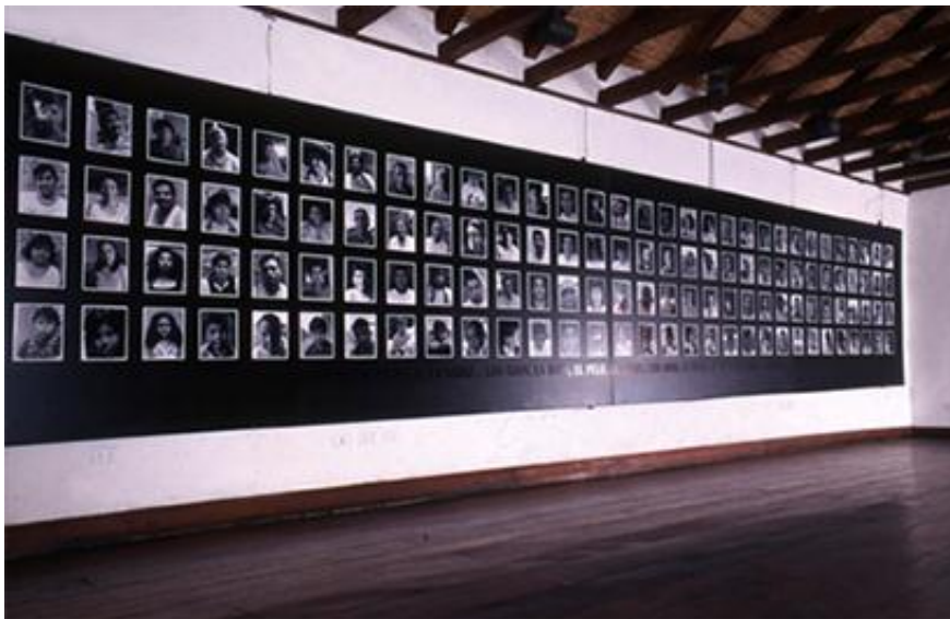
Registro de Vinka Quintana. La obra completa está compuesta por 164 retrato de parientes. Gentileza del artista

La obra es el resultado de la convivencia en la aldea de Koenju de la etnia Mbyá-Guaraní, donde el artista acampó durante dieciocho días y trabajó en colaboración con sus habitantes en base a sus rasgos identitarios, su organización social y sus creencias mitológicas comunitaria, como así también el mestizaje étnico. La etnia de cada país, región y origen de cultura es algo que cada vez más está disolviéndose, aquí el concepto memoria juega un rol importante, dentro de las población investigadas, el concepto memoria y jamás olvidar está muy enraizado. Esto se ve en diversas partes, no tan solo en paredes, sino que existen animitas, símbolos religiosos, insignias de fútbol, murales, etc. Todo recordando a un ser, que de hecho es el motivo por el cual la gente no abandona esos lugares, por el hecho de las memorias que éstos les traen.