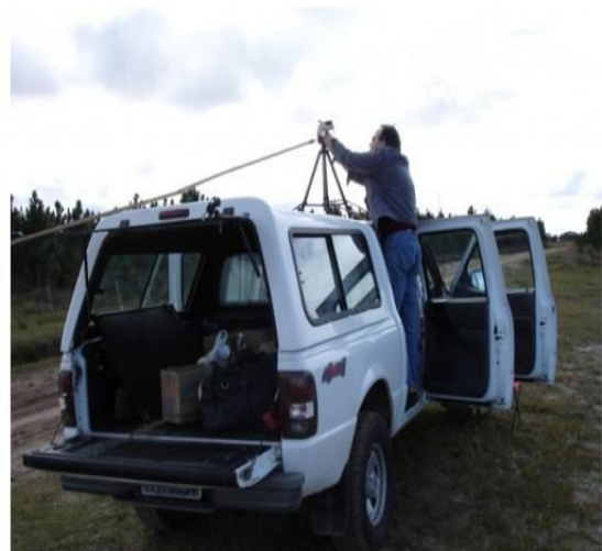
Registro fotográfico para la obra 4 esferas en plaza de Rio grande do soul