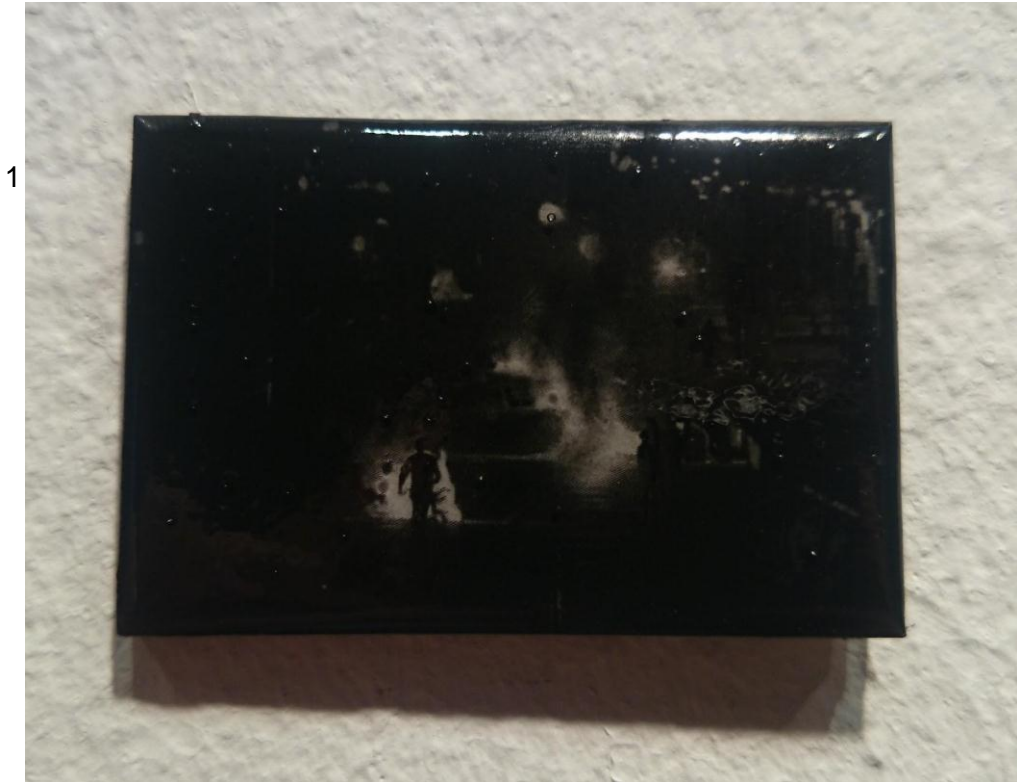
Dibujo carboncillo sobre papel 9 x 7 cm (2015)