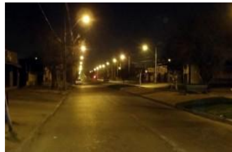
Noche del joven combatiente, primera fotografía 10 pm, segunda fotografía 11:34 pm, San Luis de Macul, Peñalolén.