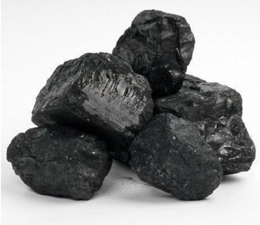
Fotografías tomada por Alexandra Cortés, estudios de carbón y resina.