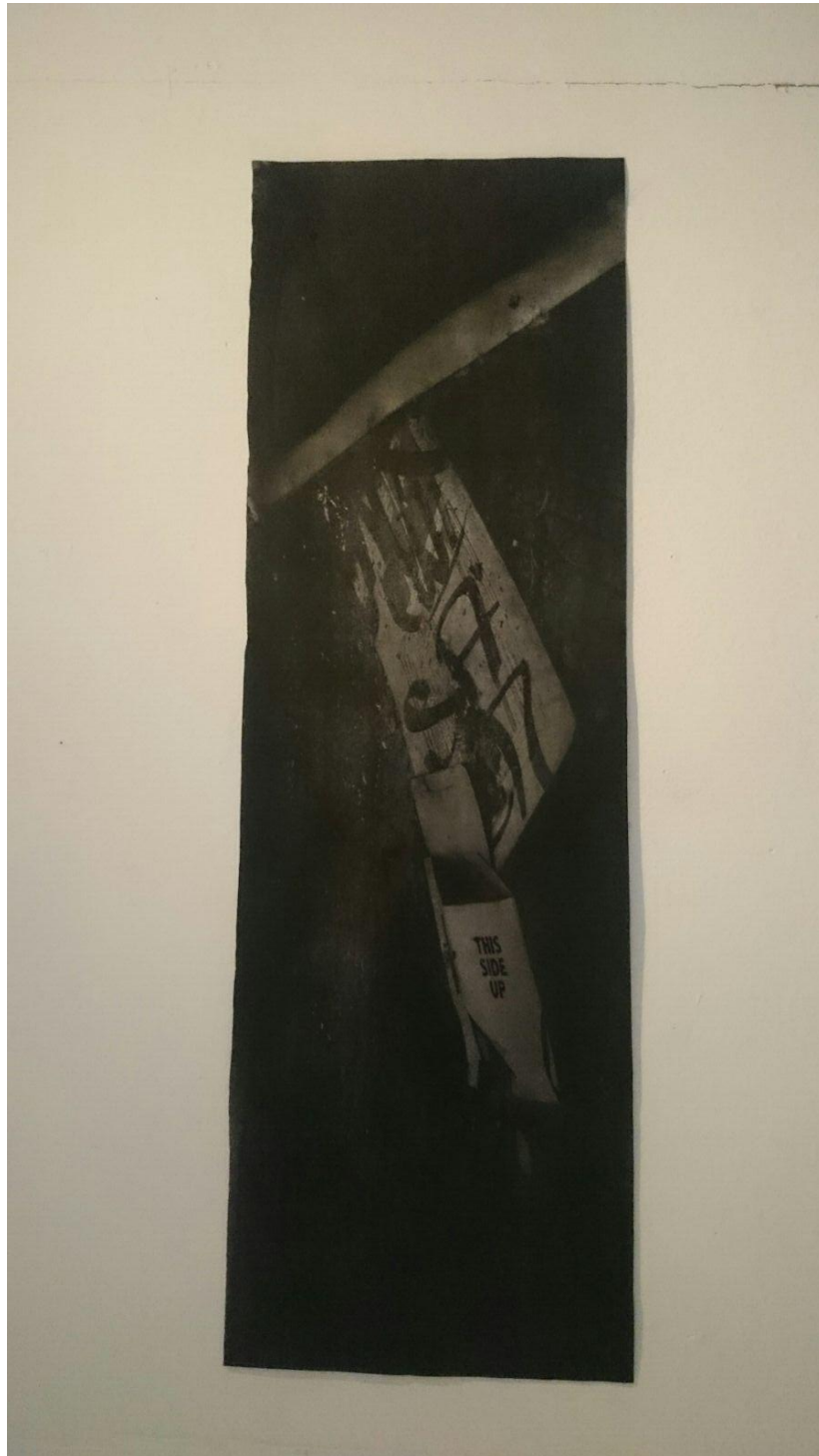
Tinta china, acrílico sobre tela 70 x 50 cm (2015)