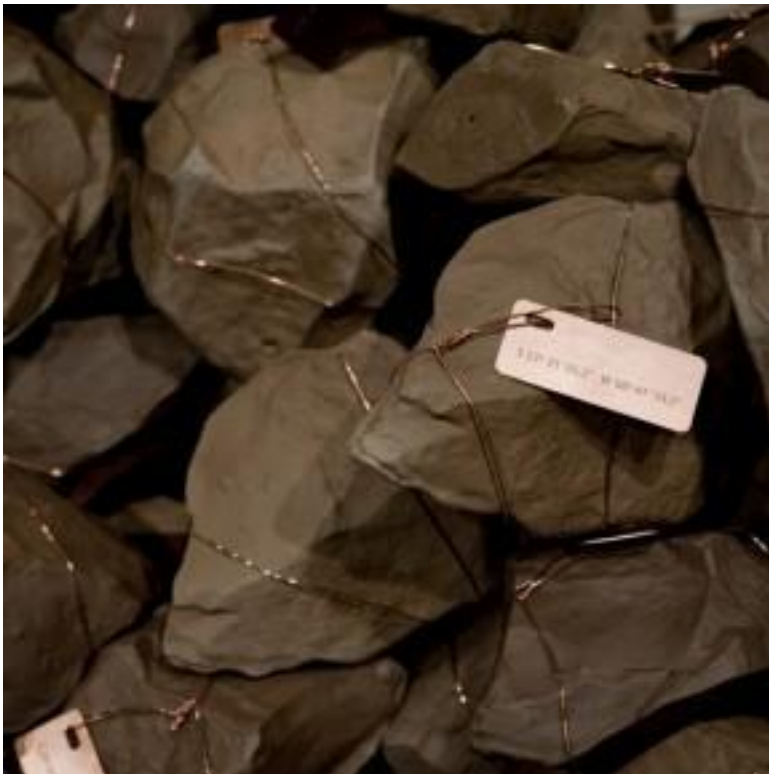
Marcelo Moscheta, Linha:Tempo:Espaço (detalle), 2013, cerámica, grabado láser de cobre, alambre de cobre y hierro. Cortesía: Galeria Leme, São Paulo

permite, como artista, capturar y repensar el lugar donde ha estado.