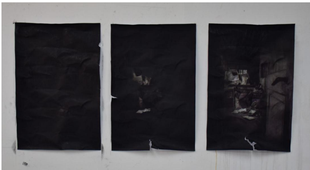
Tríptico, dibujos de carboncillo sobre papel, medidas 60 x 40 cm c/u (2015)