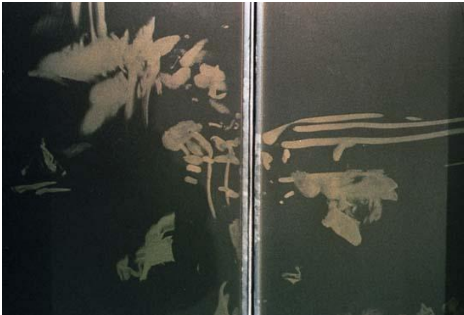
Fotografía sin título de la serie Desde adentro.

Este trabajo llamado “Desde adentro”, surge de esa experiencia. Quiere captar la atmósfera de lo que se vivió allí durante esas horas. Se concentra en el registro de huellas y señales que encontré en diversas superficies. La mayoría de las fotografías fueron tomadas unos días después del 7 de febrero del año 2003. Otras, unas semanas más tarde cuando se inició la remoción de escombros, momento en que también se realizó el video. Este trabajo está dedicado a todas las personas que estuvieron en el edificio la noche del 7 de febrero: a quienes sobrevivieron y a quienes no sobrevivieron. De un modo más amplio, a aquellos que han experimentado el extremo temor y vulnerabilidad que trae consigo un hecho como estos.