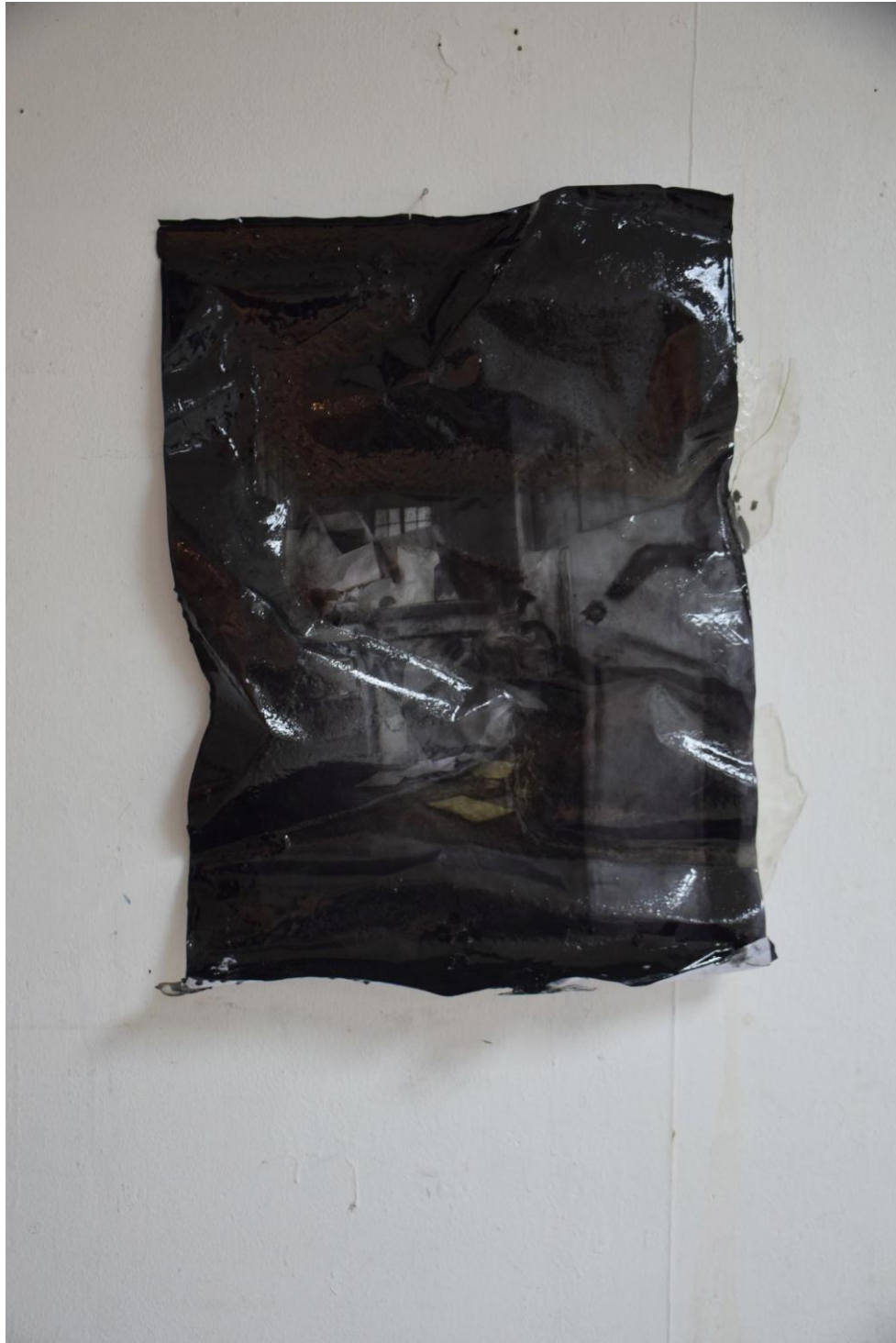
Dibujo sobre papel, acrílico, resina y carbón, medidas 70 x 50 cm (2015)