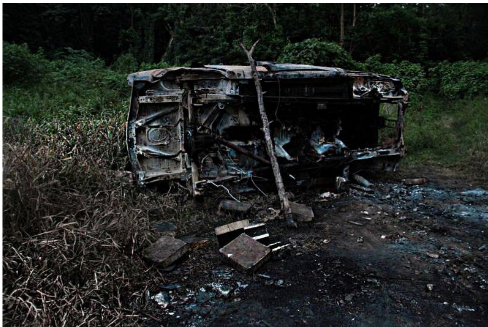
Beatriz Santiago Muñoz, La Cueva Negra , 2013.

Por medio de sus ojos, ella llegó a entender el funcionamiento social de esta ciudad industrial, Según su propuesta, la nueva mitología nace a partir de un re-descubrimiento conceptual que podemos hacer de aquellos espacios negados pero que albergan la evidencia de quienes somos debido a la alta contaminación que les hemos legado.