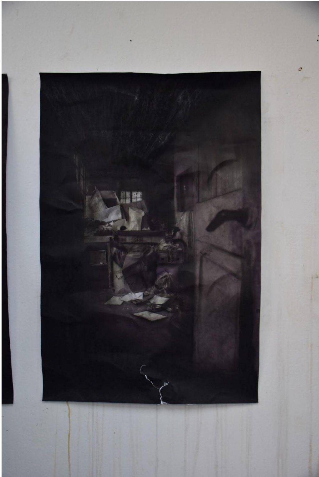
Dibujo carboncillo sobre papel 70 x 50 cm (2015)