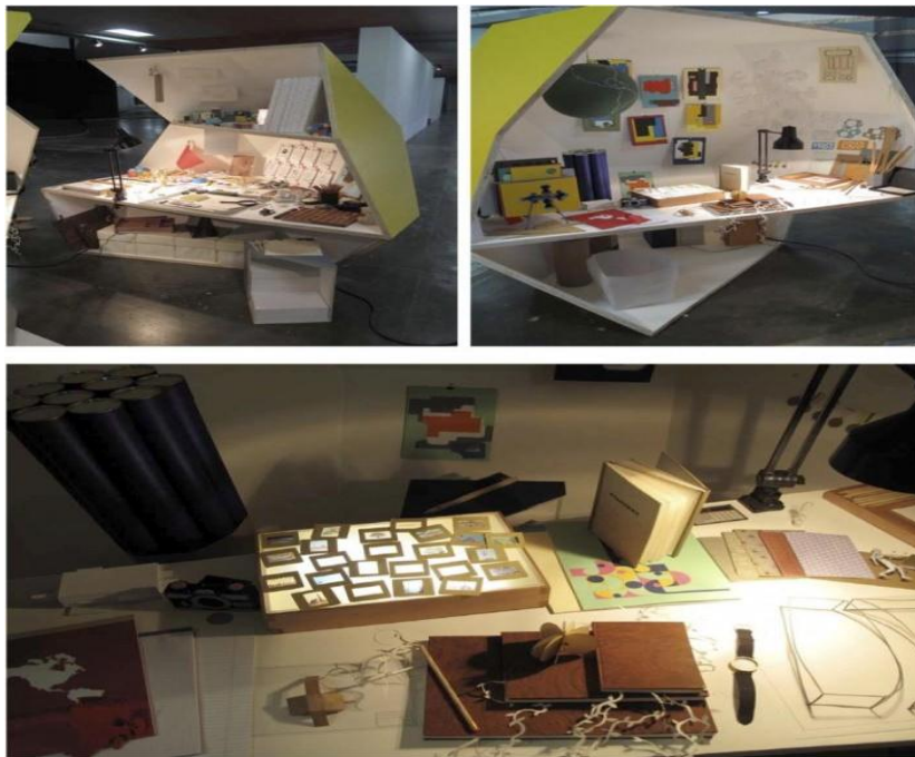
Registros del taller del artista, con obra en proceso