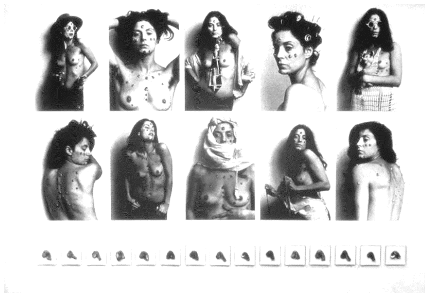
S.O.S (1974), Hannah Wilke

consideramos estéticos se enuncian en los gestos y en las palabras cotidianas. De ésta forma no se puede considerar una sola belleza, sino miles que surgen por la diferentes miradas que existen, que se producen, ya sea por la cultura, las costumbres, la normalización, incluso la concepción personal.