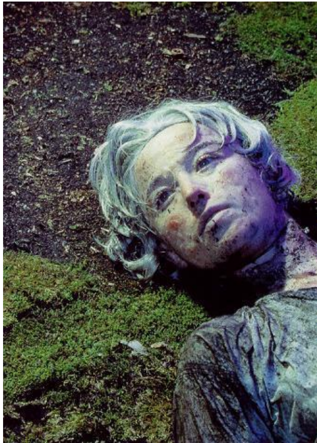
Untitled n.153, (1986), Cindy Sherman

Para mi trabajo utilizo lo que considero, una máscara. Específicamente una clasificación específica de ellas, que se llama máscara viva, en donde son realizadas con yeso como material principal para lograr sacar una réplica exacta del rostro en donde se está realizando el molde de la máscara. De ésta forma lo que se presenta tiene una condición de realidad frente a la disociación que se tiene por pre concepción de lo que significa la máscara.