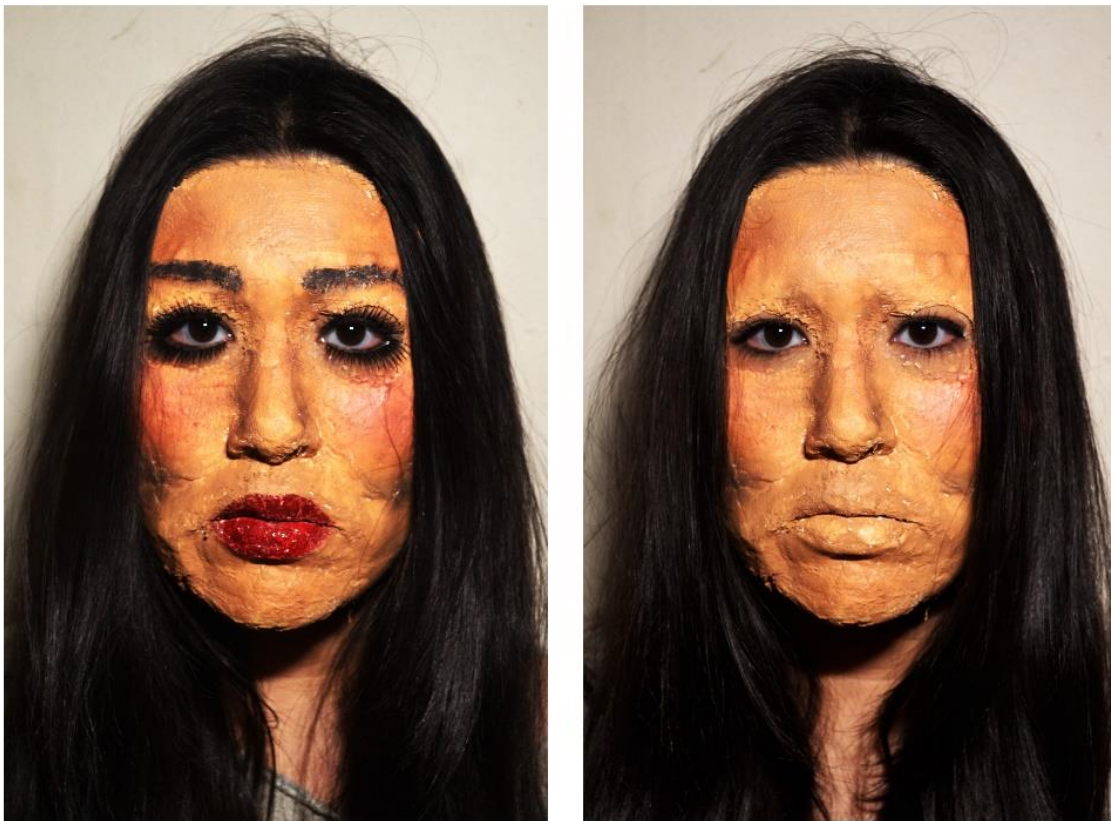
“Camuflada” (2017), Paz Briones

Si no te gusta salir a bailar porque bailas mal, anda y baila. Si no te gusta hablar en público porque te da vergüenza, habla en público. Si no te gusta tomarte fotos porque te crees fea, tómate fotos, tómate mil fotos y luego llena una galería, coloca todas las fotos en las paredes y que toda la gente vea tu rostro.