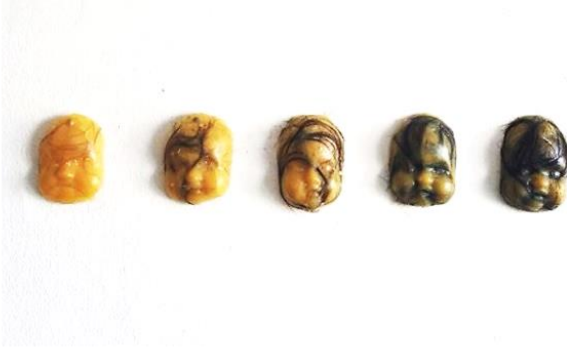
“Depilación” (2017), Paz Briones

En mis obras se busca la relación de la belleza y el camuflaje, el comportamiento que producen desde materiales camuflados en lugares que no les corresponden hasta la interpretación textual de la máscara que maquilla el rostro. Con ello lo grotesco que proviene de ésta relación y la belleza en los detalles que juegan con la misma, al conformarse el objeto, la fotografía, la instalación o la performance.