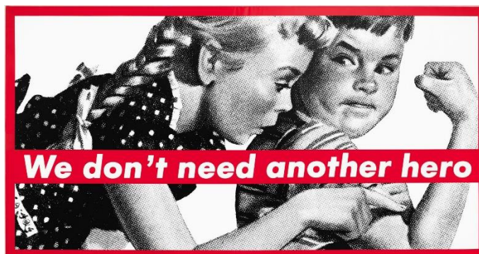
Untitled , Barbara Kruger

De ésta forma, mis trabajos reiteraban a la figura femenina proponiendo trabajos en grabado de formas corpóreas y viscerales o fotografías de un estilo publicitario que traían a la memoria los trabajos de la Bárbara Kruger en donde evidenciaba de manera frontal problemáticas que se nos presentan en la sociedad y en el día a día a las mujeres.