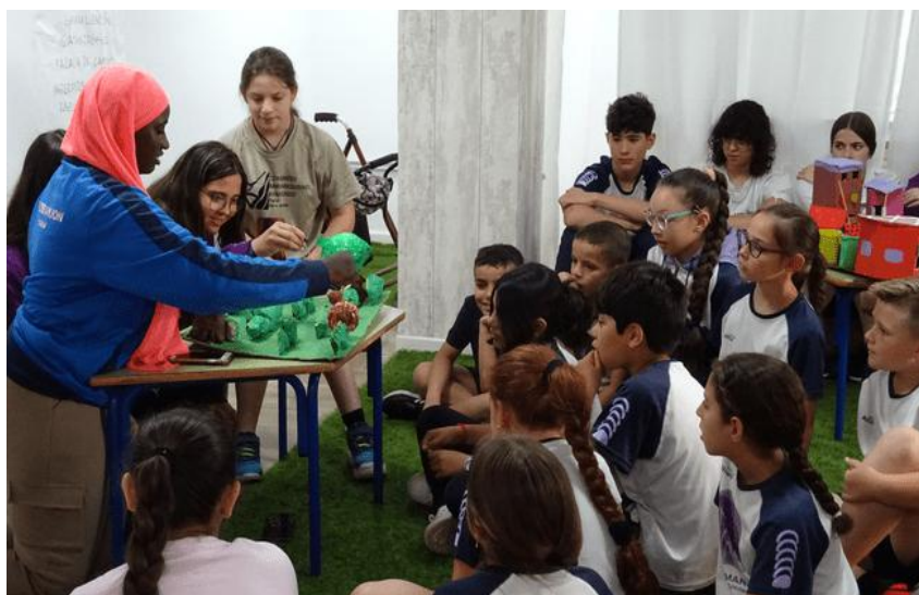
FIGURA 1. Mi historia, Nuestras historias