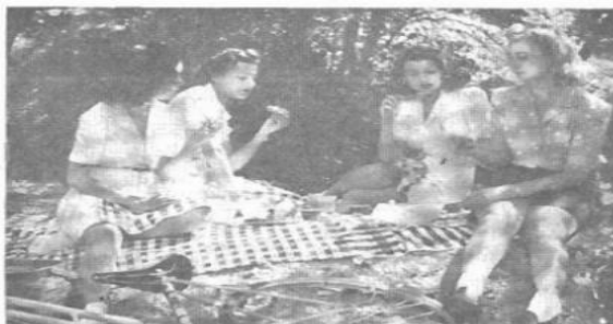
Imagen N° 14: proyecto de veraneo

nivel país aún no permitían poner “todos los medios adecuados” para que esto tuviese el desarrollo que esta empresa pretendía.