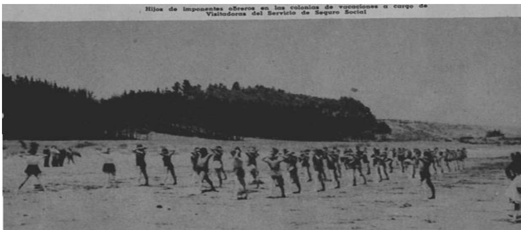
Imagen N°15: Hijos de imponentes obreros en colonias de vacaciones

(Si bien las referencias durante nuestro periodo de estudio han sido escasas y discontinuas, podemos constatar a través de la imagen la concreción de las colonias de vacaciones que realizaba el Seguro Obrero. Aunque debemos aclarar, que estas corresponden al Servicio de Seguro Social, institución que prosiguió al Seguro Obrero luego de su reestructuración en 1952, manteniendo los mismos objetivos de previsión y salud en beneficio del pueblo. Véase “Realidad y esperanza en la previsión del obrero chileno realiza el Servicio de Seguro Social”, En Viaje , febrero de 1956, 60).