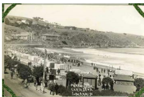
Imagen N°7: playa chica