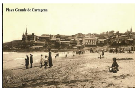
Imagen N°6: playa grande