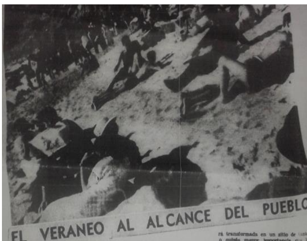
Imagen N°8: Las aspiraciones del presidente Pedro Aguirre Cerda