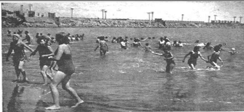
La playa de Monte Mar, en San Antonio, congrega año a año a miles de veraneantes que disfrutan en esta playa de las delicias de unas agradables vacaciones, en un ambiente verdaderamente popular.