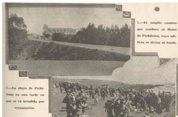
Imagen N°1: la elite en Pichilemu

aristocráticas de Santiago 104 . Panorama que reafirmaban las publicaciones semanales de la revista Zig-Zag en la década de 1920 ya que, sus relatos se centran en los placeres y lujos que contenían los veraneos de la aristocracia de Santiago. En variados anuncios se aprecian descripciones sobre los balnearios de Cartagena, Zapallar, Pichilemu o Viña del Mar, con las distinguidas familias que allí se asentaban, junto a la elegancia que les otorgaban a esos lugares con paseos o grandes casas de veraneo 105 .