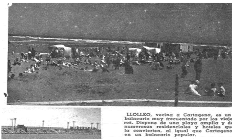
Imagen N°9: Lolloe, balneario popular

el que obligadamente tienen que pasar los veraneantes envueltos en polvos y malos olores” 174 .