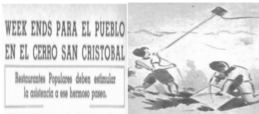
Imagen N°13: un veraneo sintético