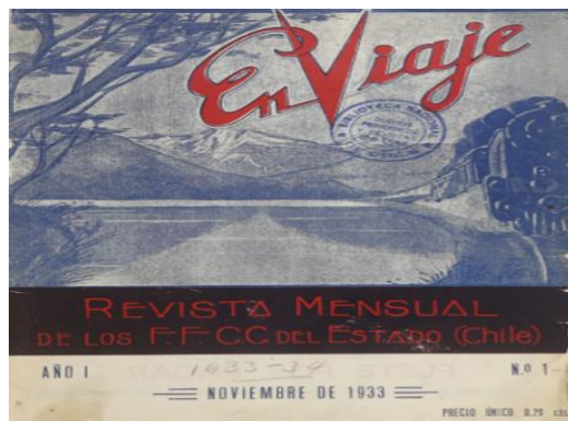
Imagen N°2: primera portada de la revista En Viaje