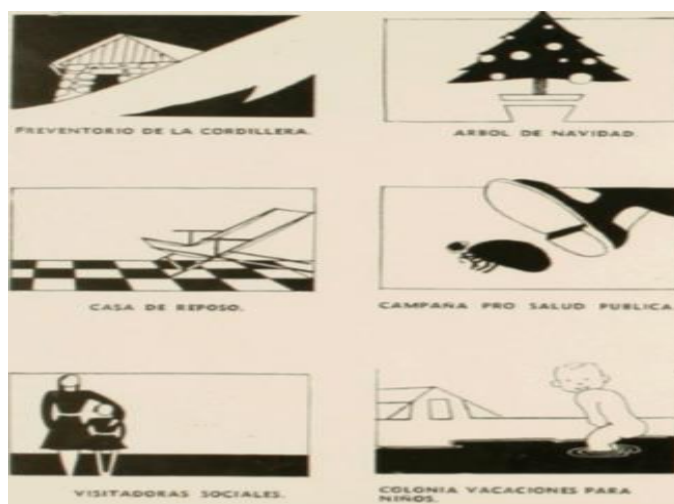
Imagen N°5: Programas de acción social

(El plan de acción social, contemplaba la organización de “colonias de vacaciones” en zonas marítimas, como se observa en el costado inferior derecho.).