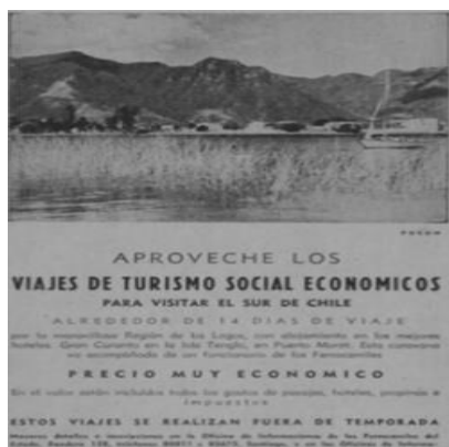
Imagen N°3: ofertas de turismo social

Entonces, interpretamos que al igual que en la década del 1930, el turismo en este caso “social” se encontraba todavía en estado inicial en 1946. No obstante, esta acción es más directa al integrar a los obreros a la dinámica turística, aunque evidenciamos que aún existían falencias y obligaciones por cumplir, ya que las pretensiones de Durán “a futuro” eran el viaje de los obreros.