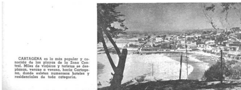
Imagen N°11: Cartagena popular