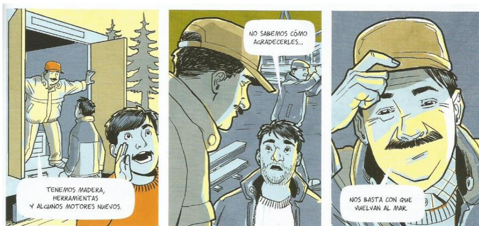
Balez, Olivier et. al. "La pesca". Vivir un terremoto . Amanuta, 2011. Pp. 32. Viñetas: 13, 14 y 15.

A la mañana siguiente, el niño nota que se acercan furgones de ayuda, por lo cual inmediatamente da aviso a su padre. Sin embargo, estos vehículos de ayuda transportan materiales, motores y herramientas para la reconstrucción de los botes. Esta situación resulta notable, debido a que la ayuda está plenamente dirigida a la reconstrucción de los vehículos laborales de la gente del sector (botes) y se omite la entrega de artículos de primera necesidad, tales como: alimentos, productos de higiene personal, ropa, entre otros.