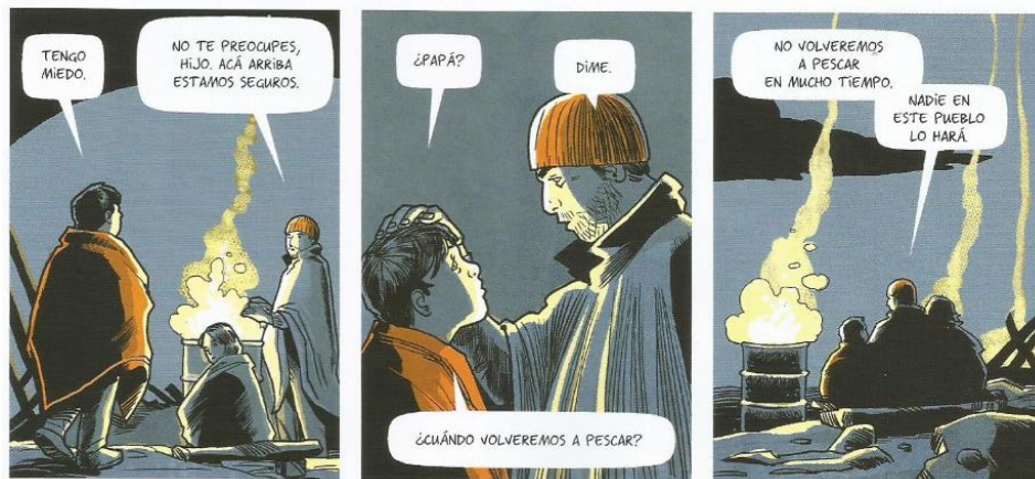
Balez, Olivier et. al. "La pesca". Vivir un terremoto . Amanuta, 2011. Pp. 32. Viñetas: 7, 8 y 9.

Sin embargo, su hijo además de mostrar su miedo ante la situación que viven en ese momento, presenta la preocupación que siente por la imposibilidad de volver a la pesca eventualmente.