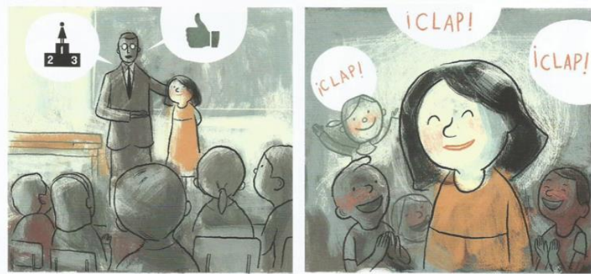
Balez, Olivier et. al. "Plan D.E.Y.S.E". Vivir un terremoto . Amanuta, 2011. Pp. 30. Viñetas 15 y 16

los estudiantes felicita, agradece y pone como ejemplo los actos de valentía, compañerismo y empatía realizados por la pequeña. En las escenas 15 y 16, podemos observar cómo vuelve el color a la cara de los niños luego del susto, y que sus gestos pasan del terror a ser gestos de gratitud y alegría, luego de haber superado de manera colectiva el temblor, a la vez, que se hace evidente la felicidad de la pequeña, al haber contribuido de manera significativa en el proceso de evacuación, para ayudar a todos sus compañeros.