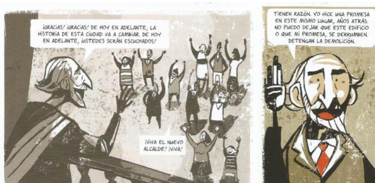
Balez, Olivier et. al. "Nuestro patrimonio". Vivir un terremoto . Amanuta, 2011. Pp. 26. Viñetas: 22 y 23.

En "Nuestro patrimonio" se hace énfasis al poder de la memoria y su eficacia para llevar a cabo cambios en la sociedad neoliberal. Si bien las edificaciones emblemáticas están encargadas de ser una representación material y visual de periodos históricos anteriores, es por medio de los recuerdos, la identidad y la tradición que estos patrimonios cobran sentido. En el cómic se demuestra cómo a partir de la defensa de edificaciones patrimoniales se genera una participación colectiva que está dispuesta a originar una ruptura con el sistema neoliberal, de manera tal que se resalta el poder de la colectividad ciudadana cuando se trabaja en equipo por un mismo objetivo. Esta historia por medio de caricaturas busca educar a los niños en torno a la importancia de la identidad y de la conservación y defensa de los patrimonios históricos. Lo que permite producir, a su vez, una enseñanza dirigida a la importancia de la memoria tanto individual como colectiva. Esta es presentada en el cómic como un agente antineoliberal, capaz de generar cambios significativos, finalmente se extrae que los patrimonios son ideológicos, sociales y culturales.