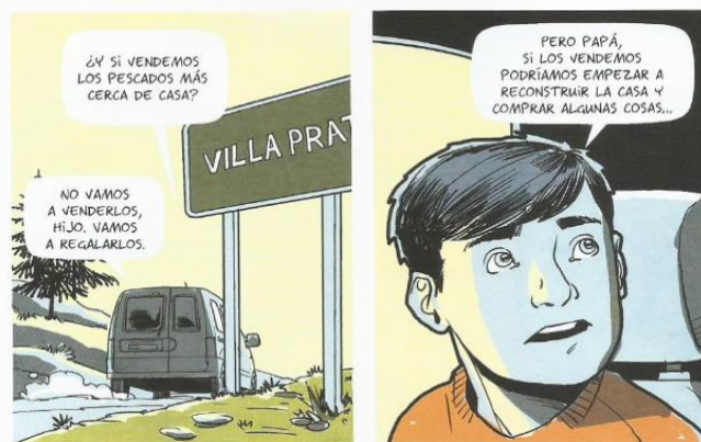
Balez, Olivier et. al. “La pesca”. Vivir un terremoto . Amanuta, 2011. Pp. 32. Viñetas: 19 y 20.

En tercer lugar, cabe señalar que la visión del menor es llamativa ante su preocupación por volver a la pesca eventualmente. A partir de las viñetas uno, dos y tres, se hace presente la inquietud del niño ante la destrucción del bote, posteriormente en las viñetas ocho y nueve el menor expresa esa inquietud a su padre, de modo que lo cuestiona para saber en qué momento volverán a pescar, a lo cual su padre contesta de la siguiente manera: “No volveremos a pescar en mucho tiempo, nadie en este pueblo lo hará” (32). Sin embargo, lo más importante se lleva a cabo luego de la reconstrucción del bote y de la pesca realizada.