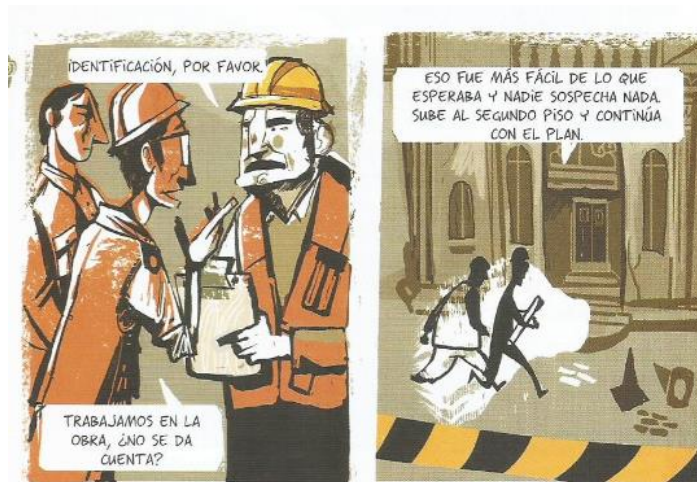
Balez, Olivier et. al. “Nuestro patrimonio”. Vivir un terremoto . Amanuta, 2011. Pp. 24. Viñetas: 4 y 5

En consecuencia, ambos sujetos se apresuran para llegar al lugar donde se llevará a cabo el trabajo de demolición, por lo que se puede ver como utilizan elementos característicos del área de la construcción, es decir: cascos, chalecos de seguridad y planos de construcción, con la intención de ingresar de manera desapercibida al lugar y poder llevar a cabo sus planes de impedir la demolición de manera exitosa. Ambos sujetos consiguen engañar al sujeto a cargo, y logran ingresar al sitio.