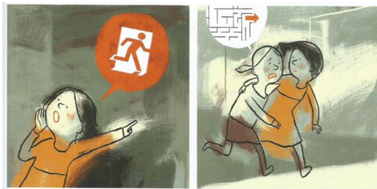
Balez, Olivier et. al. “Plan D.E.Y.S.E”. Vivir un terremoto . Amanuta, 2011. Pp. 29. Viñetas: 11 y 12

En consecuencia a tal planteamiento, el autor menciona que la situación de ingobernabilidad que afectaba al país junto con la vulnerabilidad extrema dio como resultado que los variados sectores sociales vieran en el otro a sus “potenciales asaltantes”. En este sentido, acontecimientos como los saqueos, incrementaron en la población la sensación de inseguridad además de provocar acontecimientos de enfrentamiento entre ciudadanos y actitudes ligadas al rechazo y el egoísmo. Sin embargo, M. Baeza, a su vez, hace énfasis en que en ciertos sectores del país (aunque en menor medida) se generaron actos de altruismo entre los ciudadanos como resultado del daño generalizado: “Se logró reposicionar valores sociales tradicionales en pleno escenario de precariedades creadas con motivo de la catástrofe” (66).