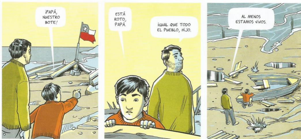
Balez, Olivier et. al. “La pesca”. Vivir un terremoto . Amanuta, 2011. Pp. 32. Viñetas: 1, 2 y 3

“La pesca” es la octava y última historia que forma parte de Vivir un Terremoto . Esta historia cuenta con una extensión de tres páginas, las cuales están constituidas por un total de veintiséis viñetas. En ellas, inicialmente se presenta a un padre y su hijo, quienes debido al terremoto y posterior tsunami que azotó las costas del país, pierden parte de sus inmuebles incluyendo su fuente laboral, un bote de pesca. Sin embargo, a pesar de la pérdida, el padre se mantiene con una actitud positiva al haber librado los peligros fatales a los que se está expuesto ante estos eventos.