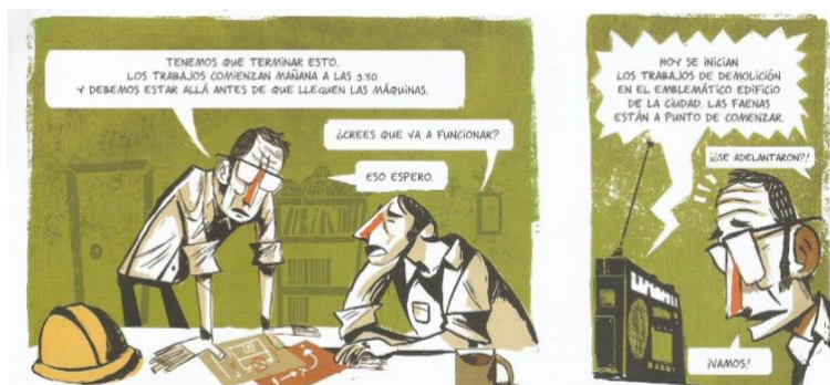
Balez, Olivier et. al. “Nuestro patrimonio”. Vivir un terremoto . Amanuta, 2011. Pp. 24. Viñetas: 1 y 2

La historia seleccionada, cuenta con una extensión de cuatro páginas, entre las cuales tres se encuentran segmentadas en un total de 23 viñetas, y una incorpora consejos acordes a la temática presentada en la narración, llevados a cabo por un bombero y una arquitecta. Los sucesos se desarrollan principalmente en escenarios de la ciudad. Esta da inicio en la primera viñeta con el enfoque puesto en dos individuos (sujeto 1 y 2), los cuales se encuentran en lo que podemos inferir como el interior de una casa. En la escena, se ven dispuestos en una mesa una serie de objetos, entre los cuales se observa un casco de construcción, y unos planos sobre la mesa. Estos, junto a la conversación llevada a cabo entre ambos sujetos, dan una primera impresión de ser un diálogo entre trabajadores de la construcción, sin embargo, en la viñeta dos esta idea es descartada.