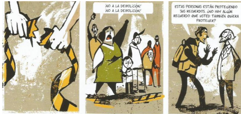
Balez, Olivier et. al. "Nuestro patrimonio". Vivir un terremoto . Amanuta, 2011. Pp. 26. Viñetas: 19, 20 y 21.

En "Nuestro patrimonio" se hace énfasis al poder de la memoria y su eficacia para llevar a cabo cambios en la sociedad neoliberal. Si bien las edificaciones emblemáticas están encargadas de ser una representación material y visual de periodos históricos anteriores, es por medio de los recuerdos, la identidad y la tradición que estos patrimonios cobran sentido. En el cómic se demuestra cómo a partir de la defensa de edificaciones patrimoniales se genera una participación colectiva que está dispuesta a originar una ruptura con el sistema neoliberal, de manera tal que se resalta el poder de la colectividad ciudadana cuando se trabaja en equipo por un mismo objetivo. Esta historia por medio de caricaturas busca educar a los niños en torno a la importancia de la identidad y de la conservación y defensa de los patrimonios históricos. Lo que permite producir, a su vez, una enseñanza dirigida a la importancia de la memoria tanto individual como colectiva. Esta es presentada en el cómic como un agente antineoliberal, capaz de generar cambios significativos, finalmente se extrae que los patrimonios son ideológicos, sociales y culturales.