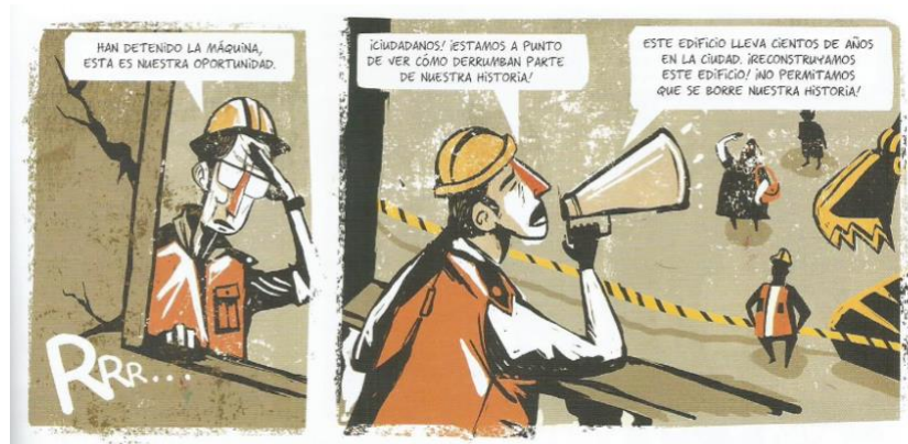
Balez, Olivier et. al. “Nuestro patrimonio”. Vivir un terremoto . Amanuta, 2011. Pp. 25. Viñetas: 9 y 10.

En consideración a lo expuesto por el autor, en las siguientes escenas de la historieta gráfica, se manifiesta como ambos individuos (sujeto 1 y 2), logran detener la demolición del edificio, a la vez que cuelgan un lienzo con la siguiente frase: “Este edificio es nuestra historia” (24) lo que apela a la identidad, lo patrimonial y lo tradicional. Ambos hombres logran llamar la atención de espectadores y transeúntes, de modo que aprovechan la instancia para promover su acto de defensa haciendo énfasis en la relevancia histórica del edificio y generar mayor resistencia al involucrar a más actores vecinales por medio del diálogo a través de un megáfono con la intención de hacer notar su discurso y su lucha. En las viñetas 9 y 10 se logra percibir cómo se realiza un cese de actividades en la obra, tanto las maquinarias como los operarios son detenidos de sus labores y se posicionan como espectadores del acto que se lleva a cabo, al mismo tiempo que transeúntes comienzan a sumarse a ellos.