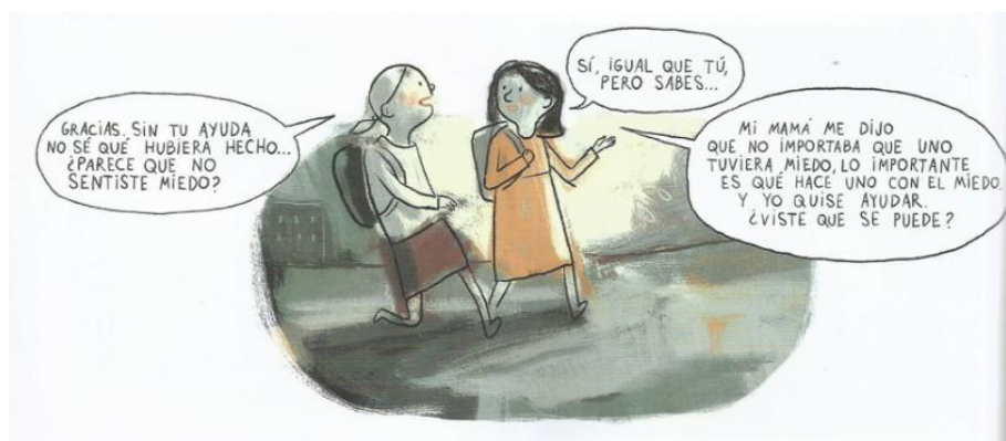
Balez, Olivier et. al. "Plan D.E.Y.S.E". Vivir un terremoto . Amanuta, 2011. Pp. Viñeta 17.

Se concluye así, que la historia plasmada está influenciada por sucesos ocurridos luego del terremoto y tsunami del 27F. Lo que establece como tema principal las consecuencias psicológicas desarrolladas por niños que fueron testigos de este. La historia tiene como eje sustancial promover la ejecución de conductas de cooperación entre pares, tal y como es propuesto por psicólogos ante estas circunstancias. Finalmente, se hace hincapié en la necesidad e importancia de llevar a cabo instancias de educación antineoliberal para recuperar los valores perdidos por el sistema.