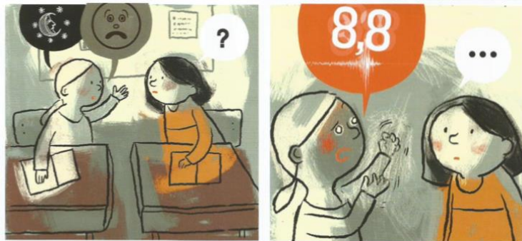
Balez, Olivier et. al. “Plan D.E.Y.S. E”. Vivir un terremoto . Amanuta, 2011. Pp. 28. Viñetas: 2 y 3

La historia seleccionada cuenta con una extensión de cuatro páginas, de las cuales tres se encuentran segmentadas en 17 viñetas, y con una página aparte en la cual se incorporan consejos de profesionales acordes a lo presentado en la narración. En medio de la clase de matemáticas, comienza la historia con el enfoque puesto en dos niñas (niña 1 y niña 2) las cuales se distinguen por colores (niña 1 grisáceo y niña 2 naranja). Se puede inferir una conversación entre ambas alumnas representada por medio de símbolos, la cual tiene como tema principal el temor desarrollado por la niña (1) a los temblores luego de la ocurrencia del terremoto 8.8 que azotó al país durante la madrugada del 27 de febrero del año 2010, el cual desencadenó en ella angustia e insomnio por las noches.