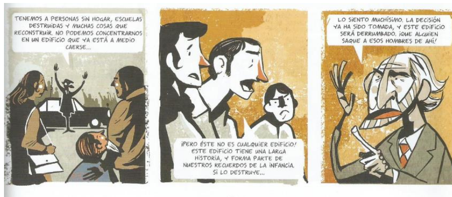
Balez, Olivier et. al. "Nuestro patrimonio". Vivir un terremoto . Amanuta, 2011. Pp. 25. Viñetas: 14, 15 y 16.

que buscan proteger su patrimonio y la figura del alcalde, un fiel representante de la ideología neoliberal que busca generar una urbanización en el sitio.