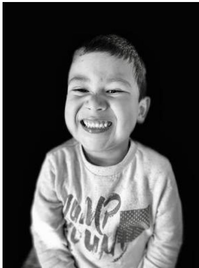
Nota: Ahijado. (2020).