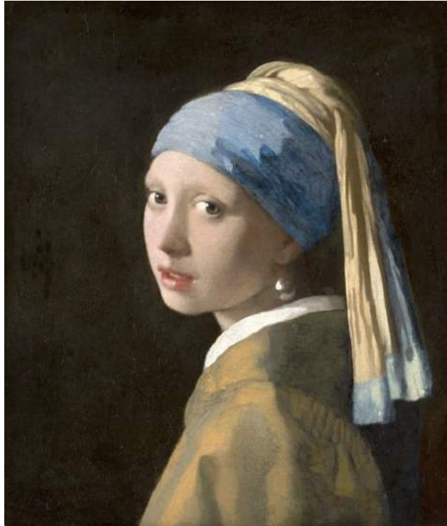
La joven de la perla. Johannes Vermeer, 1665.

Nota: fuente: https://www.culturagenial.com/