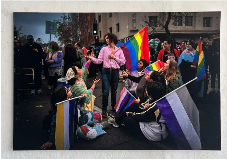
Nota: Recreación de El Aquelarre , 2023.

El Beso de Edvard Munch (Imagen 23) es un óleo sobre lienzo hecho en 1897 y cuenta con medidas de 99 x 81 cm. En esta obra se puede ver en el centro un hombre y una mujer besándose, pero sus caras están “mezcladas” y borrosas, el fondo es una ventana cubierta por una cortina casi por completo, dejando entrar sólo un poco de luz.