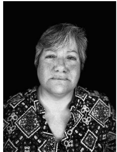
Nota: Mamá. (2020).

A partir del año 2021, empecé a trabajar con el apropiacionismo, el cual “se ha definido en el campo del arte como el procedimiento dentro de las artes visuales por el cual la obra cita, copia, reconstruye, híbrida, manipula imágenes y les asigna nuevos significados.” (Guerrero, 2021, p.