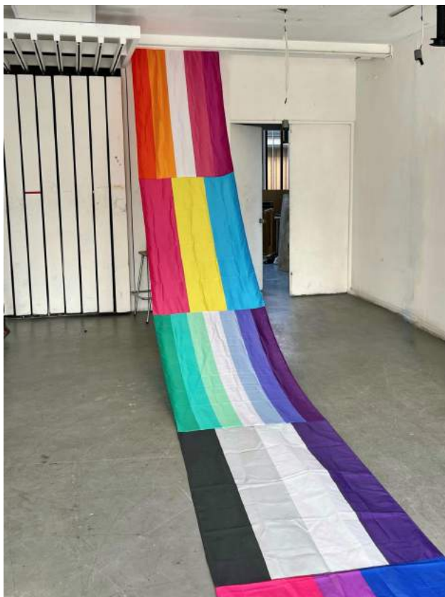
Nota: Banderas de arriba a abajo: Lesbiana, pansexual, hombre homosexual, asexual.