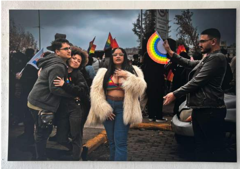
Nota: recreación El nacimiento de Venus , 2023.

La creación de Adán (Imagen 17) es una obra de 1511 hecha por Miguel Ángel, un pintor, escultor y arquitecto italiano renacentista. Esta pintura es uno de los frescos que forman parte del techo de la Capilla Sixtina y fue un encargo del Papa Julio II. Este fresco en particular mide 280 x 570 cm. En esta escena se puede ver a Dios en el lado derecho, estirando su brazo para tocar el dedo de Adán, mientras que éste no muestra el mismo esfuerzo que Dios.