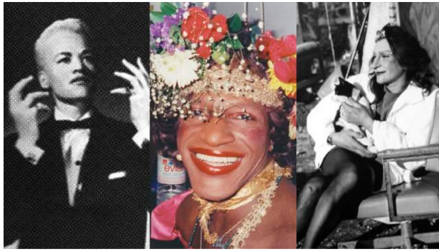
Nota: de izquierda a derecha: Stormé DeLarverie, Marsha P. Johnson y Sylvia Rivera.

Marsha y Sylvia se negaron a obedecer las órdenes y decidieron defenderse, agravando la tensión entre la policía y la clientela del bar. Sólo unos momentos después podía oírse a la gente coreando “Poder Gay” y “Lo superaremos” en la calle, y eso hizo que empezara a congregarse una multitud a las puertas del local. (...) Stormé DeLarverie estaba siendo introducida a la fuerza en un coche patrulla después de recibir un golpe en la cabeza con un casco policial. Cuando gritó a quienes miraban: “¿Por qué no hacéis nada?”, la multitud reaccionó y salió en tromba a defender a quienes todavía estaban dentro del local. (Cincuenta años Después de Los Disturbios De Stonewall, 2019)