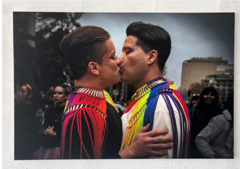
Nota: Recreación de El Beso , 2023.

Como es mencionado anteriormente, cada fotografía lleva una ficha museográfica con los datos de la obra original, es decir: el nombre de la obra y del autor, el año, la técnica y las medidas. Esto es con el propósito de apropiarme por completo de cada obra e igualarla lo más posible al contexto artístico de exhibición de la obra original. También es una crítica a la hegemonía heteronormativa que imponía la academia y los museos, quienes omitían la representación LGBTQ+. Aparte de eso, busco que el espectador logre identificar la obra original y que se genere una confusión respecto a la asociación de ambas obras.