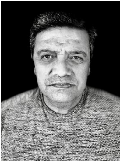
Nota: Papá. (2020).