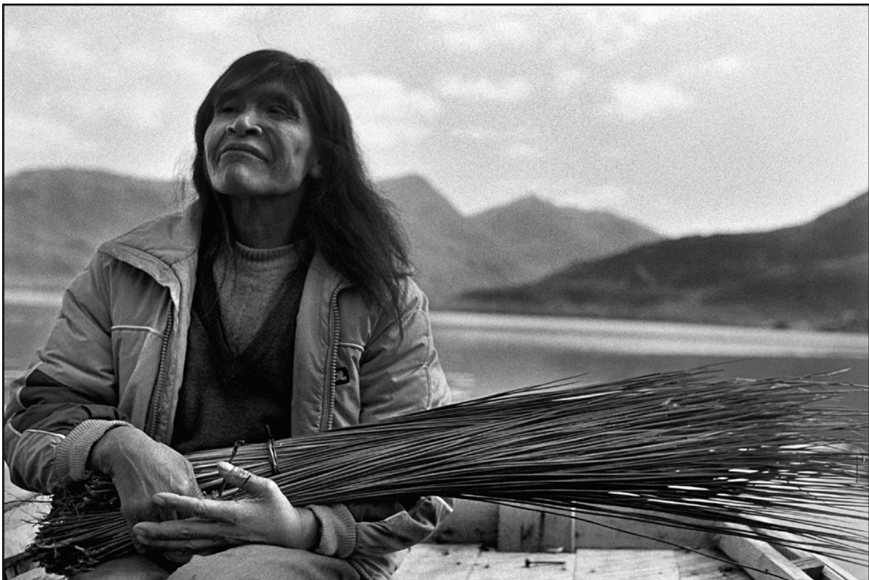
Fotografía perteneciente a la serie de Los nómades del mar realizada por Paz Errázuriz.