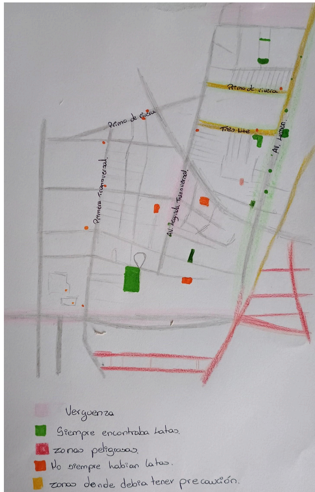
Figura 4 Autoría Propia, (2024). Mapa personal de percepciones y sensaciones. Ilustración tradicional.

Así mismo, es preciso mencionar que se reviven ciertos acontecimientos del pasado, donde la autora recibió comentarios como “estás igual que tu abuelo”, refiriéndose a la búsqueda de latas o “esto lo hacía con mi papá”. Igualmente se perciben sensaciones que se creían haber dejado atrás, el olor de la lata de cerveza cuando terminas de vaciar, el sonido de la lata al ser aplastada, los gestos de simplicidad cuando encuentras una lata, el sentir vergüenza cuando te miran personas ajenas recoger lo que está en el suelo, estar atenta y con un ojo crítico a lo que te rodea, entre otros. Lo que se traduce en una psicogeografía, que Barreiro propone como la interrelación entre geografía y psicología, la percepción de una ciudad está influenciada por nuestro estado emocional y experiencias personales (2015). Con relación a la intencionalidad, la