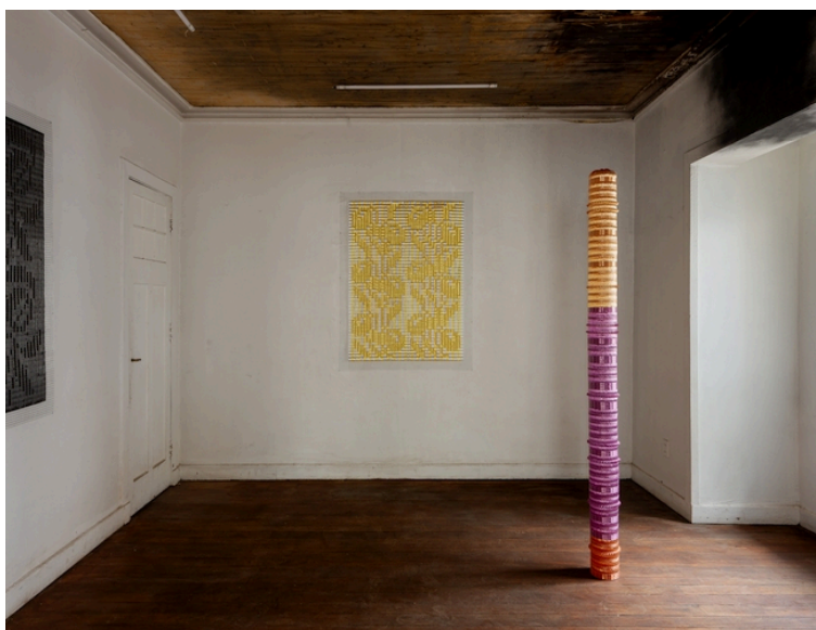
Figura 3 Burgos, F. (2021). Tarde de domingo. Tejido con cinta de regalo. Cortesía de la artista.

El trabajo con latas consiste en la obra de arte como un objeto que evidencia los contrastes económico-sociales existentes en la ciudad de Santiago, del mismo modo la artista Fabiola Burgos utiliza materiales de uso común dentro de su contexto, objetos desechables como la cinta de regalo y el tejido, que tensiona y con ello logra reapropiarse y hablar de su propia identidad con ellos (Arévalo, 2021).