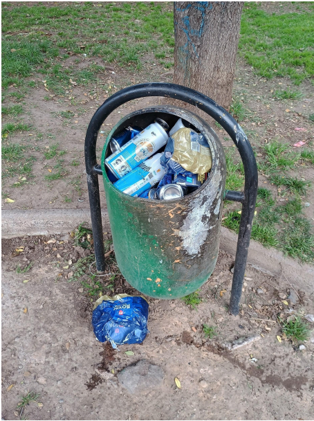
Figura 1 Registro fotográfico plaza Tres Norte, Maipú, Santiago de Chile.

otras. Esto sugiere una relación inversamente proporcional entre la cantidad de latas encontradas y el nivel socioeconómico de la población. Un claro ejemplo se evidencia en la ruta de Maipú a Ñuñoa, donde en la comuna de menos recursos, la basura y las latas abundan. Por el contrario, al final del trayecto se observa que, en zonas de mayor riqueza, las calles y veredas se encuentran limpias. Así, se enfrentan diferentes culturas en pocos kilómetros recorridos