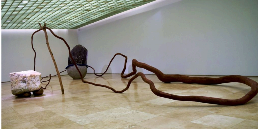
Figura 9 Correa, M. (2016). Corral. Madera de espino, el ónix, el granito y el fieltro.

Para esta pieza de la obra, se lleva a cabo un proceso de ponerse en los zapatos de los recolectores, recorriendo diferentes zonas y en distintas semanas, en bicicleta o a pie, principalmente en la comuna de Maipú, en búsqueda de las latas de aluminio. Adicionalmente, la ejecución de esta obra escultórica prioriza la recuperación de una acción particular que quienes las recogen realizan para facilitar y favorecer el manejo, y transporte del recurso para su venta: el aplastamiento de la lata con el pie. Para la obra, por lo tanto, se reúnen las latas y se efectúa la operación mencionada. Una vez el material se encuentra comprimido, se perfora e introduce en una barra de acero para unir las y con ello, fabricar una estructura lineal con forma abstracta (Ver figura 10). Se supone con ello la apropiación de la lata de aluminio, conservando su naturaleza y reivindicando la labor realizada por los colectores, con el levantamiento y elevación del suelo de la materialidad como gesto, apreciando el material y haciéndolo parte primordial de la obra. De hecho, desde 1967 a través del arte povera, movimiento artístico que surge como oposición a la modernidad y a la desculturización que conllevaba, los artistas profundizan en la humildad a través de la creación de obras de arte a partir de objetos abandonados e inútiles. Con una postura de marginalidad, reivindica lo efímero transforman lo insignificante en una fuerte expresión artística (Esteruelas, A. & Laudo, X., 2017)