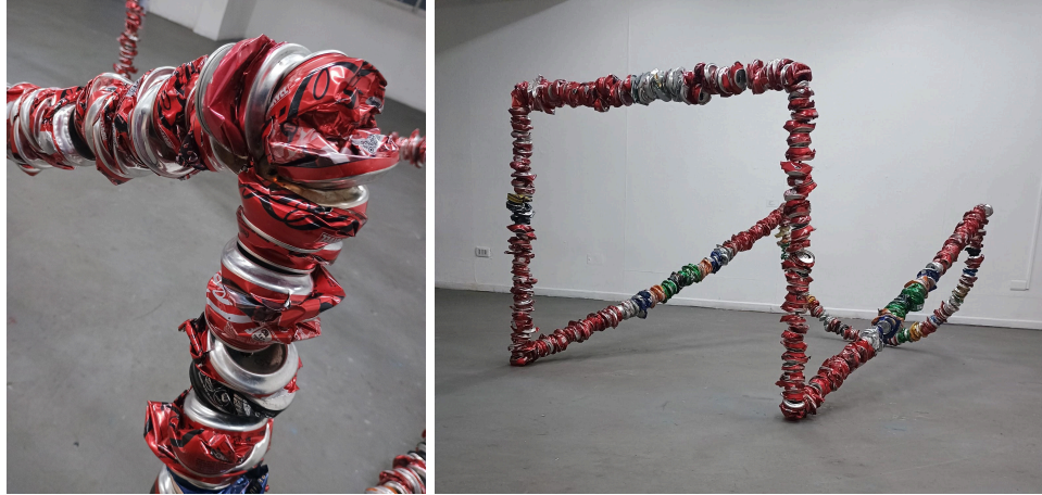
Figura 10 y 11 Autoría propia, (2024). Escultura “Memoria”. 180 x 100 x 80 cm. Estructura de fierro y latas. Registro fotográfico y detalle de la obra.

Se concibe la idea de presentar una segunda pieza en la instalación con el mismo proceso utilizado en la escultura “memoria” (visualizar figura 11). Para esta nueva estructura, se tomará como referencia el recorrido realizado en bicicleta por los alrededores de Maipú, trayecto que será inspiración de la forma a la barra de acero en la que las latas están contenidas. Con el fin de lograr la comunicación visual entre ambas en el espacio, se colocará cada una en un extremo opuesto de la sala, creando un diálogo entre inicio y final, existente en cada salida de búsqueda de material. En este sentido, será un manifiesto de la travesía realizada y de las decisiones tomadas para su elaboración.