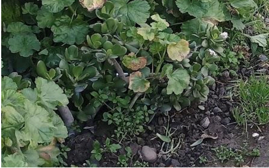
Figura 6 Autoría propia, (2024). Buscando latas en la calle. Registro fotográfico acercamiento calle Los flamencos, Maipú, Santiago de Chile.

¿Y si realizamos un acercamiento? ¿La ves ahora?