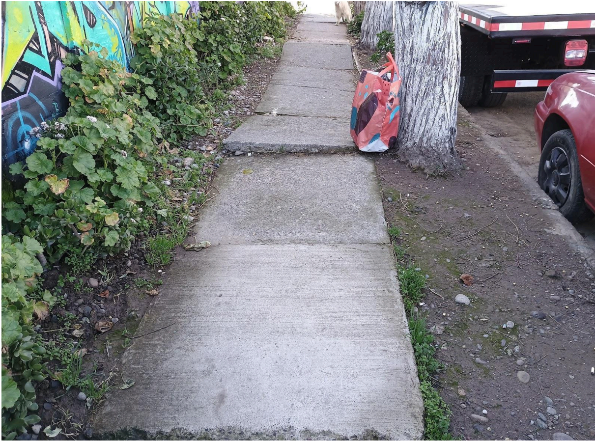
Figura 5 Buscando latas en la calle. Registro fotográfico calle Los flamencos, Maipú, Santiago de Chile.

¿Ves alguna lata en este lugar? ¿Dónde está?