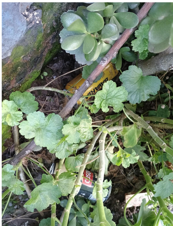
Figura 7 Autoría propia, (2024). Buscando latas en la calle. Registro fotográfico acercamiento calle Los flamencos, Maipú, Santiago de Chile.