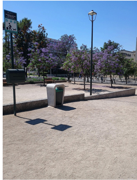
Figura 2 Registro fotográfico plaza Pedro de Valdivia, Providencia, Santiago de Chile.

En el proceso de búsqueda y acumulación del material para la elaboración de la obra, una de las reflexiones se basa en la posibilidad de que la cantidad de residuos encontrados era proporcional al nivel consumo de ellos en las diferentes zonas. En otras palabras, se pensó que la gran cantidad de latas desperdigadas en las calles de zonas de bajos recursos se debía a una mayor compra y uso de estos envases. Sin embargo, es importante referirse al nexo existente entre el nivel de ingresos y los residuos gestionados para su reciclaje. En los sectores de altos ingresos se observa un 96% de material reciclado, mientras que, en las zonas más vulnerables,