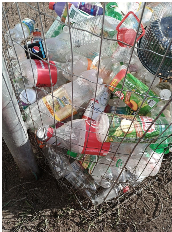
Figura 8 Autoría propia, (2024). Latas en la calle. Registro fotográfico calle Ferrocarril, Maipú, Santiago de Chile.

Es más, muchas aquí podrían pasar desapercibidas entremedio del plástico