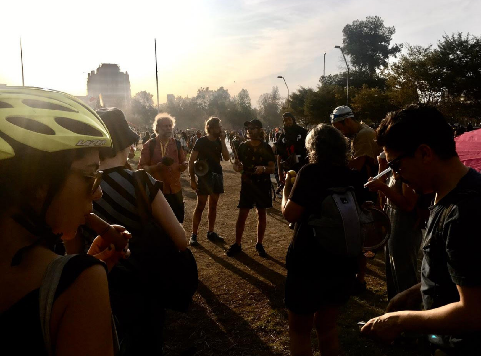
Barricada Sonora en Plaza Dignidad, fotografía de Catalina Menares.

y, principalmente a su principio de procedencia 4 ; es decir, su existencia material es previa a la decisión de determinar la acumulación y resguardo. Por tanto, cualquier sujeto o entidad colectiva podría haber constituido el mismo archivo. Por ejemplo,