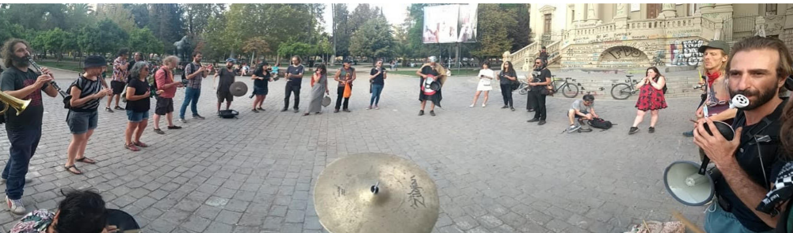
Panorámica Barricada Sonora, frontis Museo de Arte Contemporáneo, Parque Forestal.