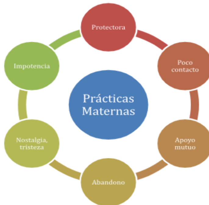
Diagrama 2. Sujetos de Estudio

Así, se puede observar que las mujeres madres privadas de libertad percibían que a pesar de querer brindar protección a sus hijos(as) tenían muy poco contacto con ellos debido a que las únicas prácticas que podían realizar eran las llamadas, videollamadas y solo en algunos casos las visitas, lo cual las hace sentir impotencia, nostalgia, tristeza y sensaciones de abandono por parte de ellas hacía sus hijos. En donde si bien reconocen que sus hijos(as) son un apoyo para ellas, consideran que ellas no lo son para estos aunque así lo quisieran.