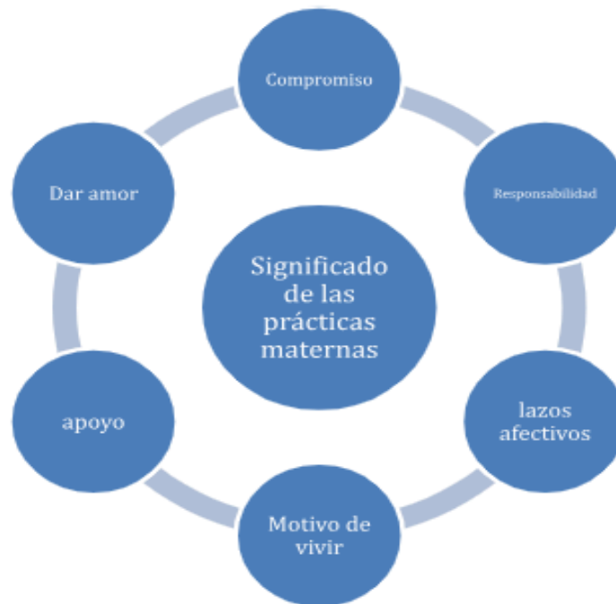
Diagrama 3. Sujetos de Estudio

Como se puede observar en el diagrama, el significado que estas mujeres privadas de libertad le otorgan a sus prácticas maternas están en estrecha relación con entregar amor a su hijo(a), comprometerse a ser una buena madre, la cual sea capaz de ser responsable, desarrollar lazos afectivos, y apoyar a sus hijos e hijas. Pues, el 100% de la muestra menciona que su hijo(a) es su razón de vivir. Aunque, debido a las limitaciones que significa ser madre privada de libertad, estas significaciones no siempre se pueden cumplir, debido a que como ha sido mencionado anteriormente, en muchos de los casos se presencia una pérdida de lazos y la falta de apoyo que brinda y recibe la madre hacia sus hijos(as).