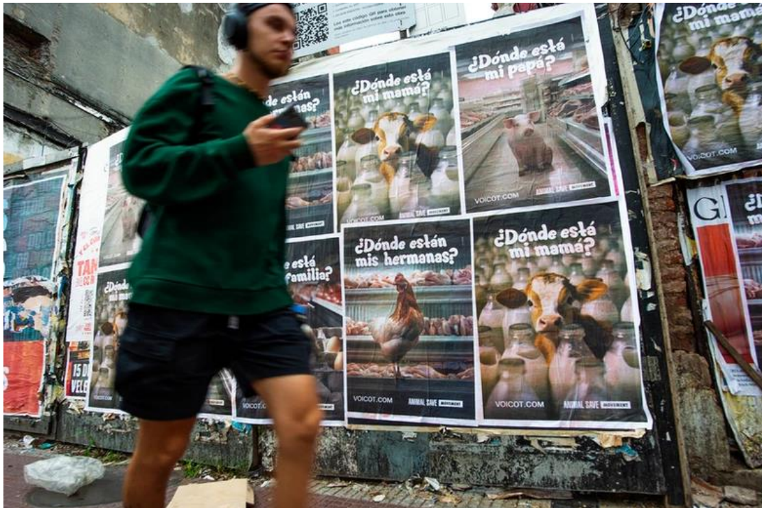
Figura 10. Voicot (s.f.). Dónde.

Por otro lado, su campaña "Mercado Libre" consistió en afiches colocados en espacios públicos con la frase "Mercado libre deja de vender animales en tu plataforma". Esto, según explican, es porque rechazan cualquier venta de animales como servicios o productos.