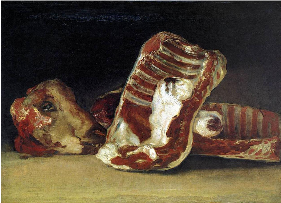
Figura 5. Goya, F. (1812), Trazos de carnero .

En el arte contemporáneo, hay giros significativos sobre la presencia de los animales. Por ejemplo, en la performance “Me gusta América y a América le gusto yo” (1974), de Joseph Beuys, el artista convivió durante tres días con un coyote en una habitación de una galería de Nueva York. La relación tiene distintos momentos, en unos el coyote se comporta hostil hacia el artista, y en otros conviven como si fueran pares. El coyote es un animal importante para la comunidad de los pueblos nativos de Estados Unidos, y Joseph Beuys mediante la interacción con el coyote lo utilizó como una manera de comunicación y sanación, y símbolo de las problemáticas sociales de Estados Unidos (Lampkin, 2017).