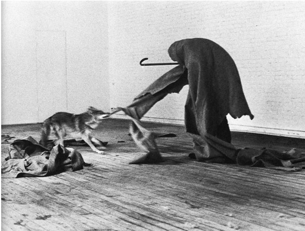
Figura 6. Beuys, J. (1974), Me gusta América y a América le gusto yo .

En contraste, Damien Hirst, según Goldstein (2017), el artista ha usado cerca de 913.450 cadáveres tanto de animales como de insectos en sus obras, como “Mother and Child (Divided)” (1993), donde una vaca y su ternero son divididos y suspendidos en formaldehído, creando un recorrido visual interno y externo. Hirst sobre esta obra, se pregunta: ¿cómo crear emociones científicamente? continúa: