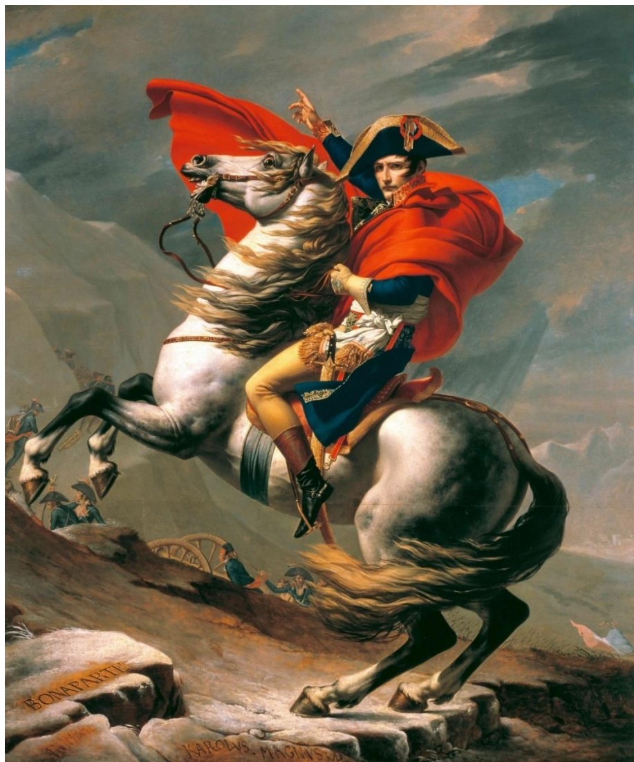
Figura 4. David, Jaques-Louis (1801). Napoleón cruzando los Alpes .

Por otro lado, en “Napoleón cruzando los Alpes” (Figura 4) de Jaques-Louis David, el caballo se muestra como medio de transporte y un símbolo de poder y liderazgo. La postura firme del personaje y su control sobre el animal refuerzan su autoridad, mientras que la composición dinámica, marcada por diagonales, transmite movimiento y energía. El caballo, vigoroso y lleno de fuerza, amplifica la imagen de Napoleón como un líder imponente, inmortalizándolo como un héroe en plena conquista. Sin el caballo, la obra perdería su dinamismo y el poder simbólico que magnifica al protagonista.