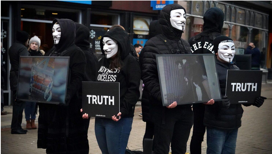
Figura 9. Anonymous for the voiceless (s.f.), The Cube of Truth .

Voicot es una organización activista vegana que, en su página web, muestra diferentes formas de activismo. Su estrategia es realizar campañas públicas, entre ellas destaca la campaña “Dónde” realizada junto con Animal Save Movement. En esta iniciativa, pegaron afiches en espacios públicos con diseños como el de un cerdo bebé en el pasillo de carne de un supermercado, acompañado de la pregunta: “¿Dónde está mi papá?”