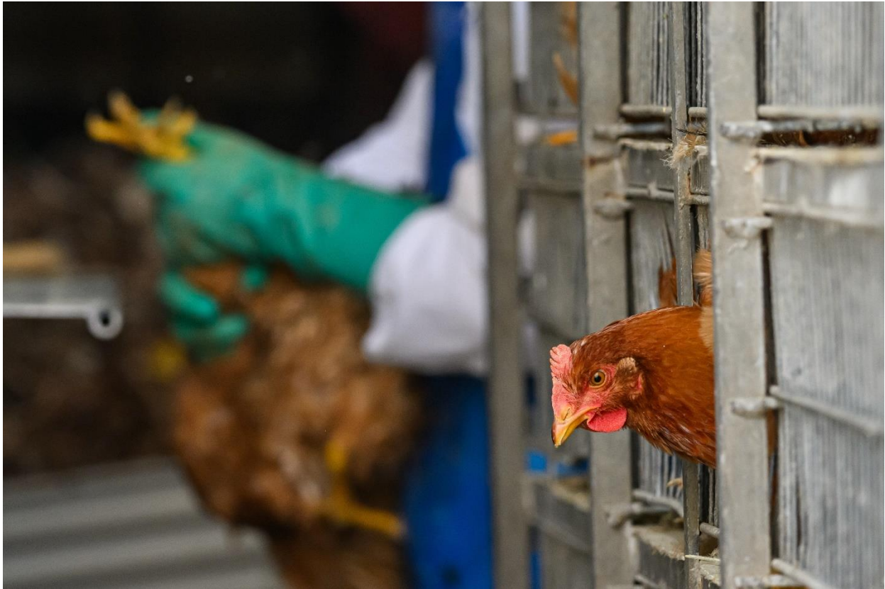
Figura 20. Jo-Anne McArthur. (2024). Sin título. We Animals.