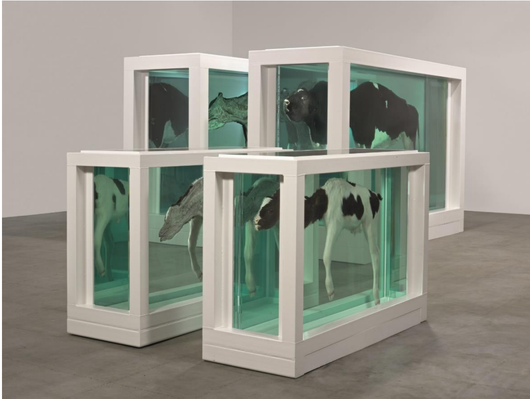
Figura 7. Hirst, D. (1993), Mother and Child (Divided) .

más personalidad que cualquier vaca que ande por los campos. (Morgan, 1996, como se citó en Manchester, 2009)