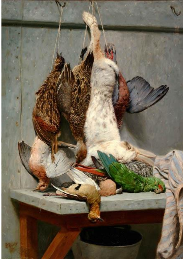
Figura 2. Reveco, D. (1900), Aves de caza .

En este contexto, la caza era presentada como un acto de entretenimiento y estatus.