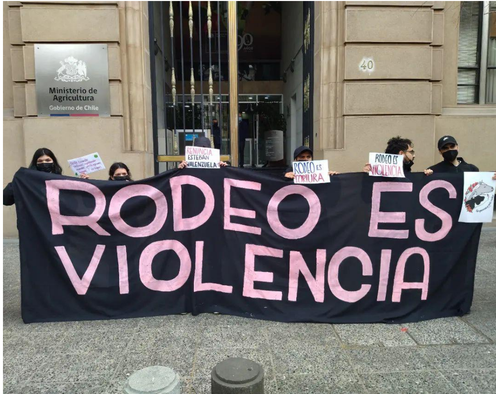
Figura 12. Santuario Justicia, (2022). Rodeo es violencia.

Finalmente, otro ejemplo de activismo vegano es el Santuario Igualdad, que opera en Chile. Esta organización, desde hace varios años, rescata animales considerados de granja. A través de redes sociales, muestran cómo estos animales viven en tranquilidad y libertad, contando la historia de cada ser que llega al santuario, lo que ha permitido que el público empatice con ellos y se involucre mediante donaciones y voluntariados.