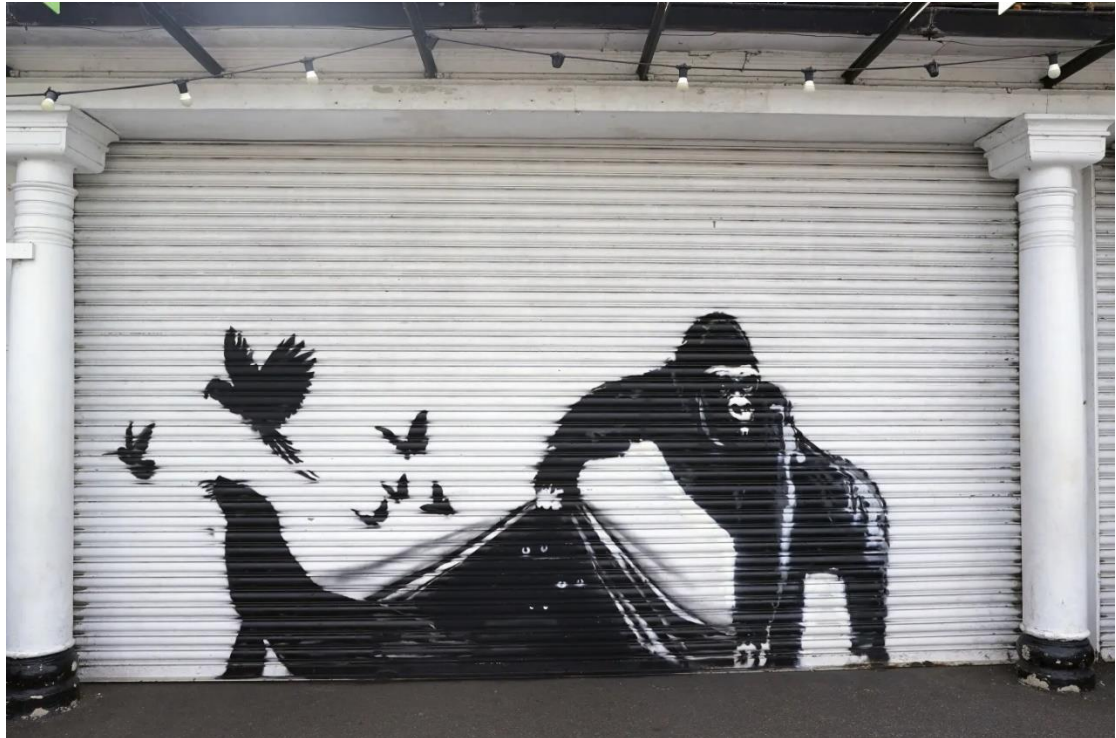
Figura 15. Banksy. (2024).

En línea con mis trabajos, en redes sociales he encontrado artistas que hacen activismo por la lucha de la liberación animal, como lo serían Artemis Beasts, un dúo de artistas activistas de la ciudad de Nueva York. A través de sus obras, se transforman en seres antropomórficos mitad humano y animal, posicionándose en el lugar de las víctimas y utilizando sus cuerpos para visibilizar aquello que sufren los animales. Entre los temas que abordan están la explotación, la dominación, las malas condiciones de vida, la eliminación continua de su hábitat natural y su brutal asesinato, entre otras formas de violencia.