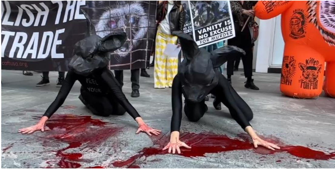
Figura 17. Artemis Beasts. (2024). Human-Rabbit .

Otro ejemplo, es la artista Tamara Kostianovsky que a través de sus obras temáticas aborda la violencia y el medio ambiente. Su obra “Mesmerizing Flesh” (Figura 18) evoca imágenes de la industria cárnica, combinando lo visceral con la suavidad, lo que genera un contraste interesante en estas figuras de cuerpos tejidos que remiten a animales desmembrados colgando de estructuras metálicas. Esta representación me lleva a reflexionar sobre la práctica común del trato a los animales dentro de carnicerías e industrias similares. Al igual que Tamara, rescato esta visualidad, aunque en mi caso utilizo materiales provenientes de las prácticas de control y producción animal.