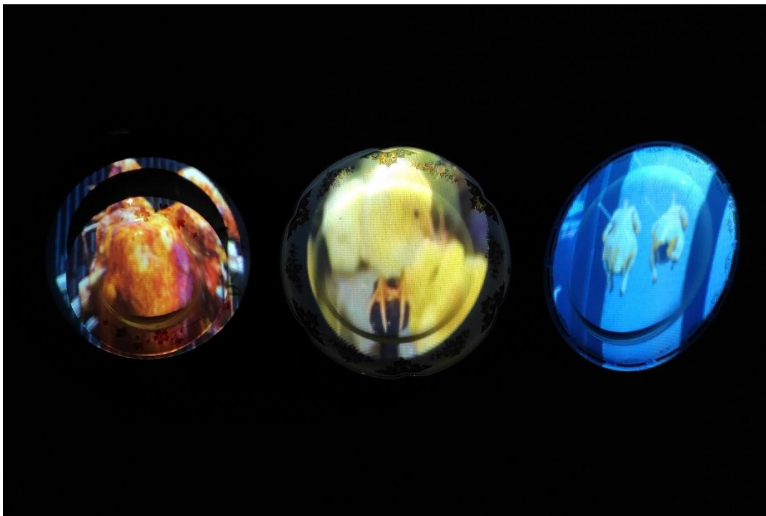
Figura 22. Vestigio Animal (2024), autoría propia.

Al proyectar los videos sobre platos de loza (Figura 22), busco contrastar tanto la temática como el color. La utilización de contrarios en mi obra está motivada por mi visión de la realidad desde una posición antiespecista, donde la cotidianidad cómoda y agradable de la sociedad se ve permeada por la realidad oculta que viven los animales. Mi trabajo aborda la presencia y la ausencia del cuerpo, la luz y la sombra, lo tierno con lo tenebroso, la frialdad y la calidez, o un plato de diseño floreado proyectado con muertes brutales de animales.