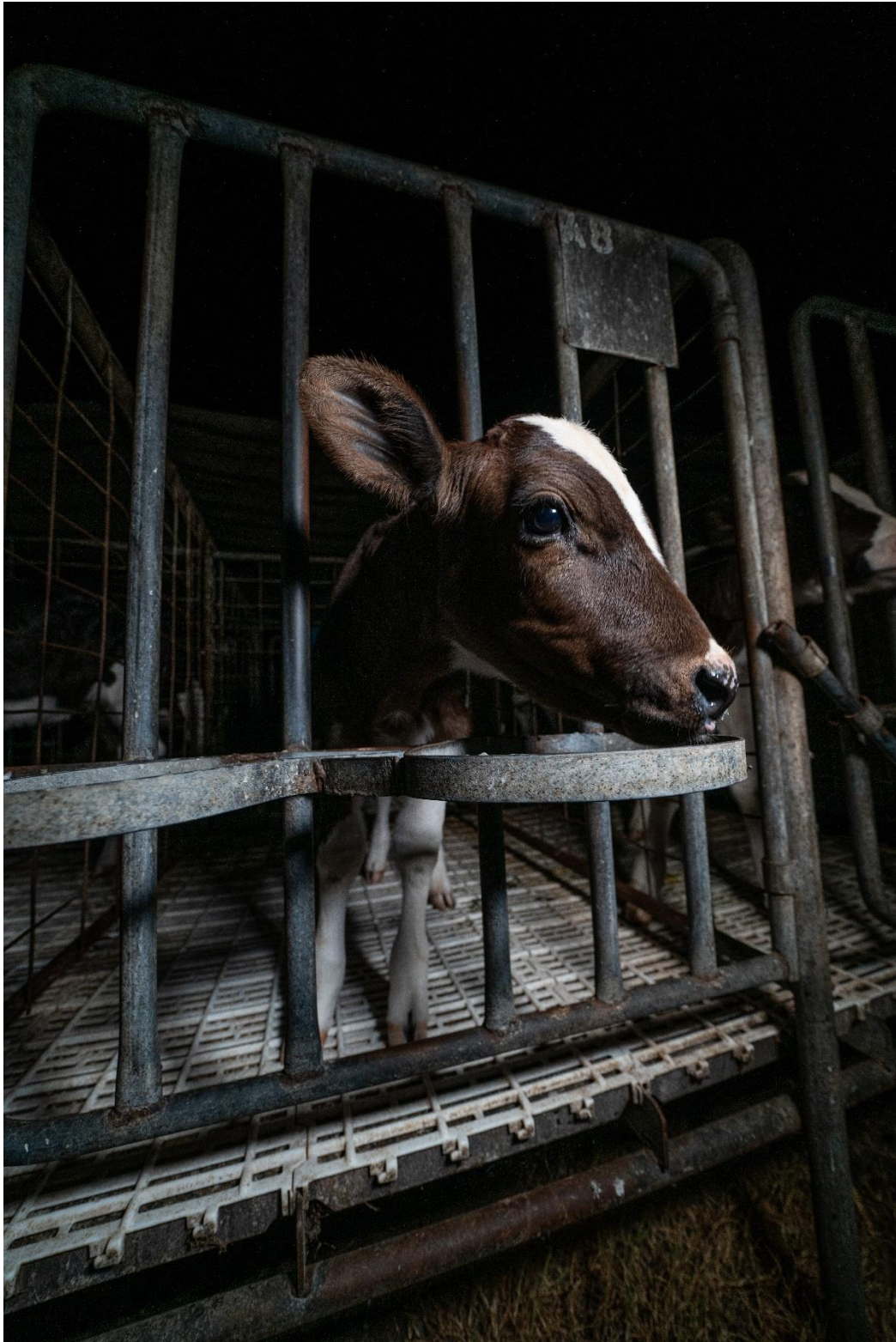
Figura 21. Bear Witness Australia. (2019). Sin título. We Animals.