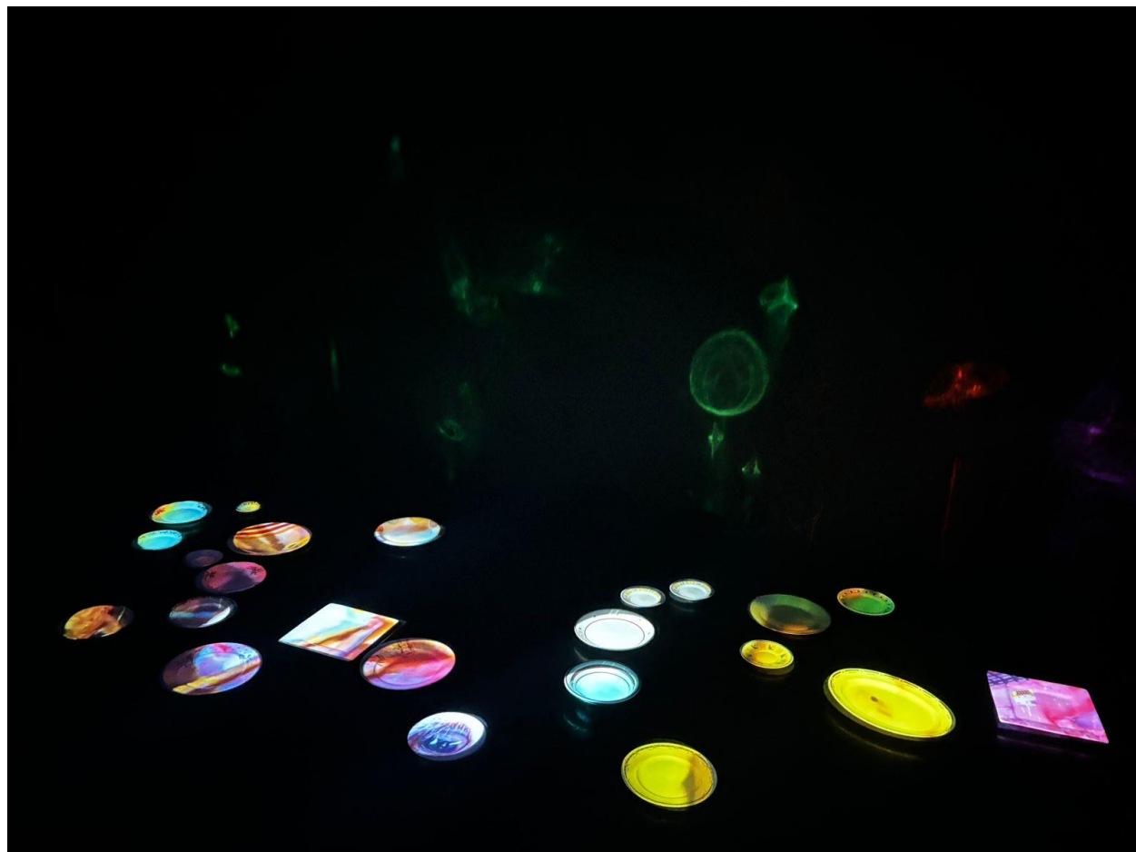
Figura 24. Vestigio Animal (2024), autoría propia.