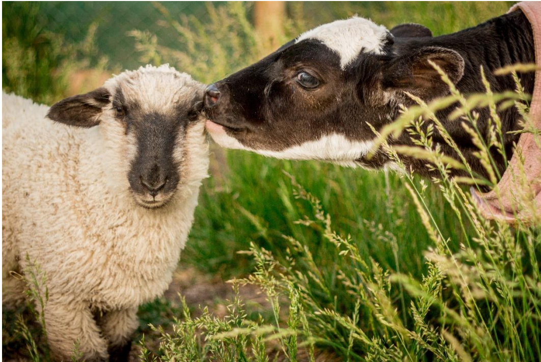
Figura 13. Panela G. (2012). Santuario Igualdad . We Animals.