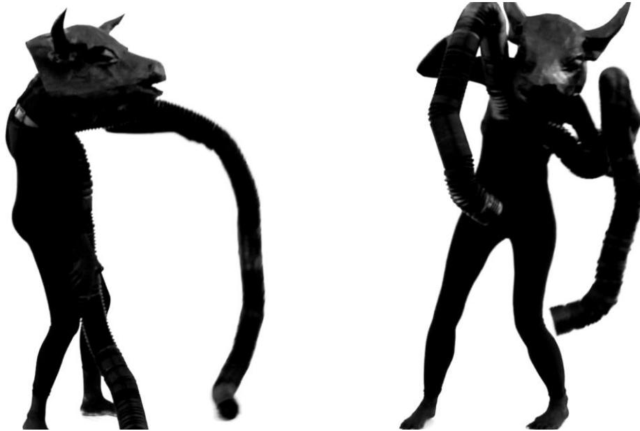
Figura 16. Artemis Beasts. (s.f.). Milk Hurts .

sociedad y lograr dar un respiro a las vacas que son privadas de libertad, violadas y ordeñadas en cámaras estrechas e insalubres.