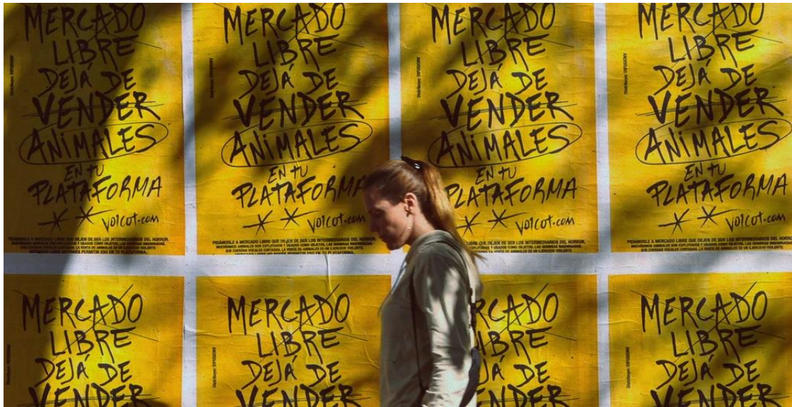
Figura 11.

Otro ejemplo de activismo vegano es Santuario Justicia, una organización vegana y abolicionista chilena de la que actualmente formo parte. Uno de sus objetivos principales es convertirse en un santuario de animales rescatados, construido por activistas. Una acción llevada a cabo fue “Rodeo es violencia”. El rodeo, considerado deporte nacional en Chile, consiste en arrear y atrapar a un novillo en una medialuna, siendo una práctica basada en la crueldad animal por entretenimiento. Para protestar contra esto, nos manifestamos frente al Ministerio de Agricultura con un gran lienzo que decía "Rodeo es violencia" y otros carteles alusivos al tema.