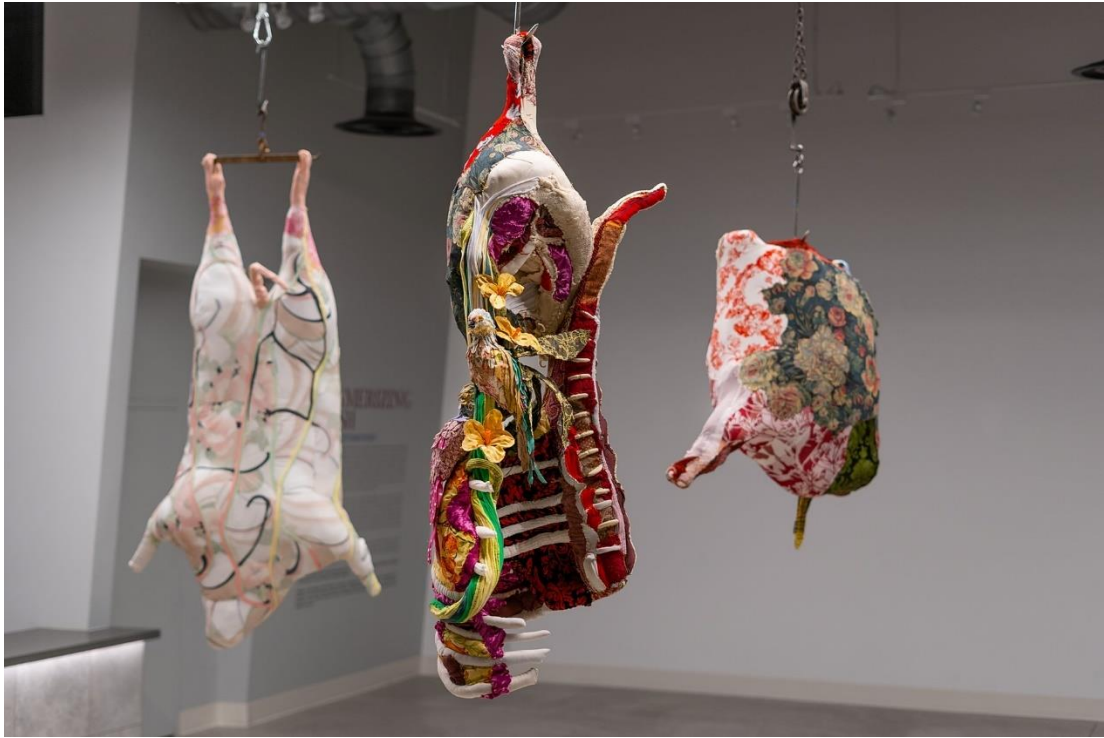
Figura 18. Kostianovsky, T. (2023). Mesmerizing Flesh .

Desde otra perspectiva, la artista Boonie Leeman, con su postura vegana, utiliza la pintura para retratar cuerpos de animales de granja explotados para el consumo humano. Sus obras destacan por lo sombrío, mortuorio y desagradable de las escenas, logradas mediante una paleta de colores oscuros y sangrientos. En la obra que se observa en la Figura 19, el cuerpo del animal está intervenido con trozos de espejos rotos, lo que permite que el espectador se refleje en la pintura. Esta decisión artística funciona perfectamente con el mensaje de la autora, ya que interpela al espectador, confrontándolo con las consecuencias de sus propias acciones cotidianas.