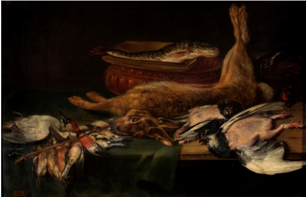
Figura 1. Adriaenssen, A. (1616), Bodegón: liebre, pájaros muertos y pescados .

Continuando con el género del bodegón, el artista chileno Demetrio Reveco, conocido por sus pinturas de naturaleza muerta, realiza la obra “Aves de caza” (Figura 2) en la que retrata la muerte de una liebre y diferentes aves. Estas están amarradas con una cuerda a los ganchos de la pared, descansando sobre la mesa con una composición triangular. A pesar de la luminosidad que resalta el pelaje suave de los animales, ciertos elementos dan frialdad a la escena, como el color frío casi metálico del muro, y los ganchos de las cuerdas. Tal como la obra de Adriaenssen (Figura 1), los animales no muestran signos de violencia. Según Pérez A. en el Centenario del Museo Nacional de Bellas Artes (2009):