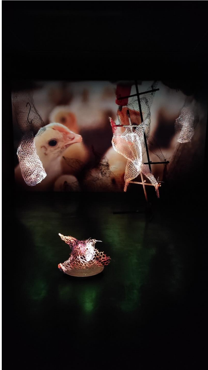
Figura 23. Vestigio Animal (2024), autoría propia.

La obra “Vestigio Animal” no busca solo generar una experiencia visual, sino que denuncia las condiciones que enfrentan los animales diariamente por las decisiones humanas. Para comprender la base crítica de esta pieza, es importante a examinar las condiciones a las que son sometidos los animales en las industrias ganaderas, lácteas, avícolas y pesqueras, destacando las formas de violencia hacia los animales ejercidas por las industrias.