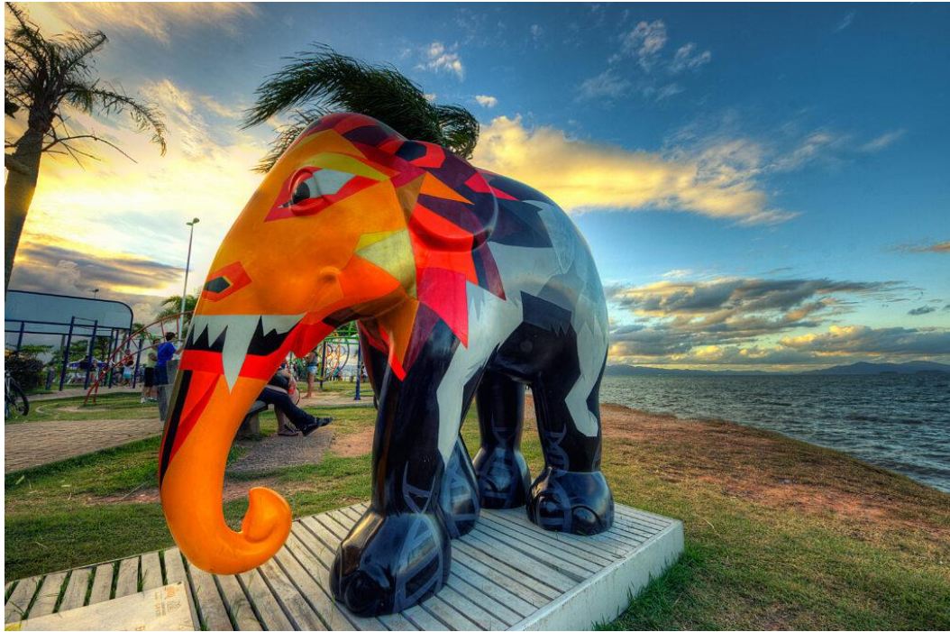
Figura 14. Artery. (2016). Elephant Parade .

Por otro lado, Banksy en la obra de la Figura 15, muestra a las afueras del zoológico de London la representación del escape de animales encerrados. Con esta obra, manifiesta su rechazo hacia las prácticas de estas instituciones, que, con motivaciones económicas, les arrebatan su libertad a animales no humanos, en su mayoría de vida salvaje.