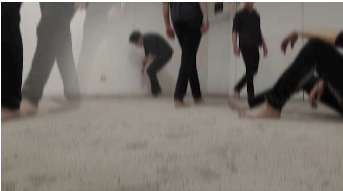
Figura 16. Roldán M, (2024). Sin Título [Video performance en solitario] Universidad Finis Terrae.