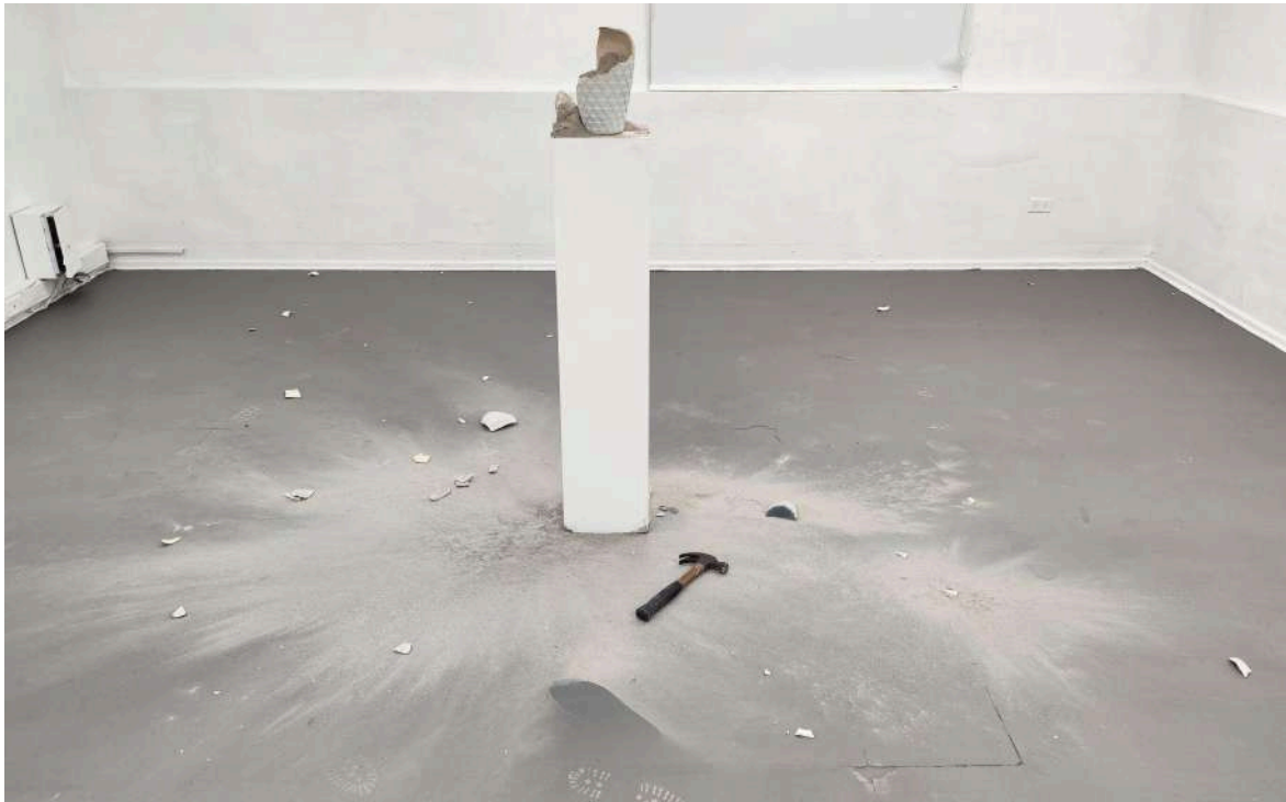
Figura 11: Roldán M, (2024). “24/06/24” [Performance con objeto] Universidad Finis Terrae.

Para mí, el arte del performance es un “territorio” conceptual con clima caprichoso y fronteras cambiantes; un lugar donde la contradicción, la ambigüedad, y la paradoja no son sólo toleradas, sino estimuladas. Cada territorio que un artista de performance boceta, incluyendo este texto, resulta ligeramente distinto del de su vecino. (p. 5)