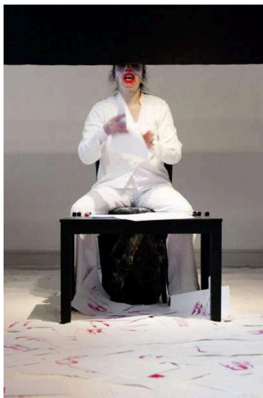
Figura 3: Toro, J. (2013). Carmin , Serie: Dibujar el límite (Dibujar el límite) [Performance]. Galería 0, Colonia, Alemania.

Después de la primera media hora experimenta el dolor del roce continuo con las hojas. Así sigue hasta que su boca no resiste más. Va creando formas inconscientes sobre los papeles como consecuencia de este trance impuesto por ella misma, marcando un ritmo constante mientras que el cansancio y el agotamiento va subiendo.