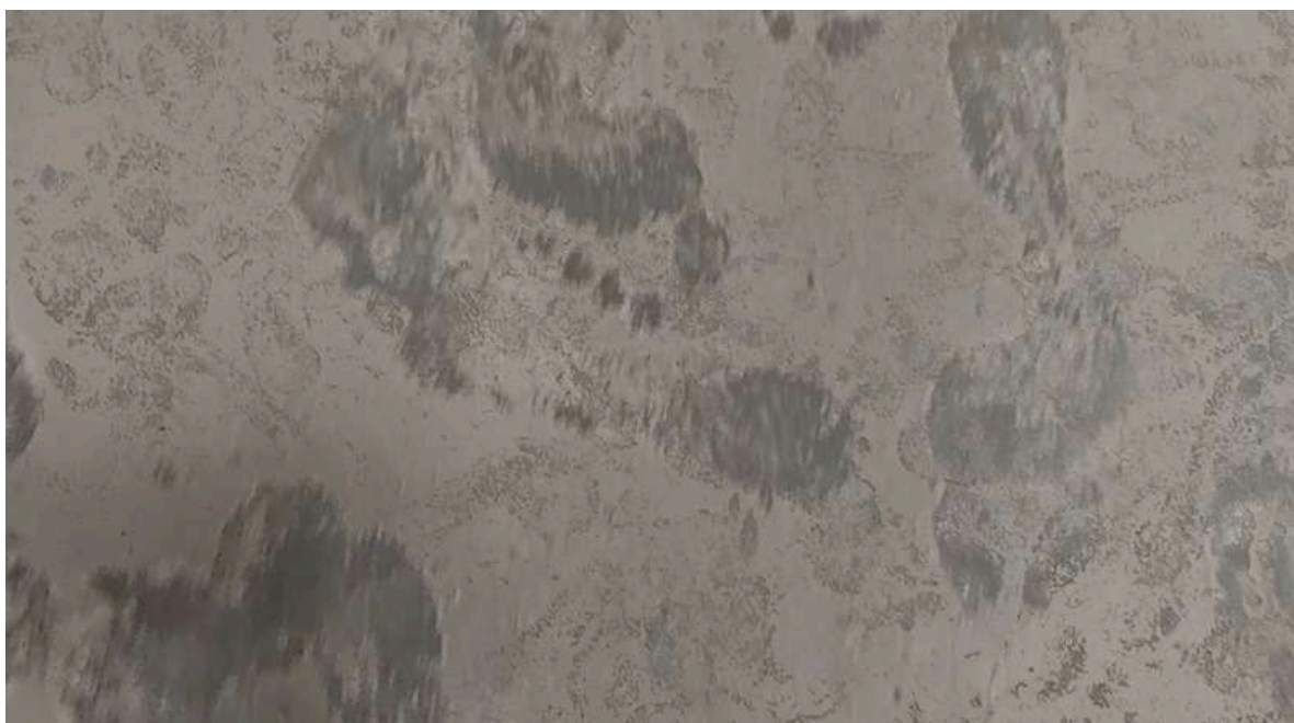
Figura 15. Roldán M, (2024). Sin Título [Video registro de performance en solitario] Universidad Finis Terrae.

Mi proyecto de grado consiste en ocho videos proyectados en la sala 20 de la Facultad. Son cuatro por cada pared lateral de la sala, expuestos a través de proyectores que van sujetos a unos soportes, a una altura de 2,70 metros. Estos proyectan sus imágenes a la altura de una persona promedio (1.72 mts), dialogando con el suelo de la misma sala el cual está cubierto por una fina capa de la propia ceniza utilizada dentro de mis trabajos y videos.