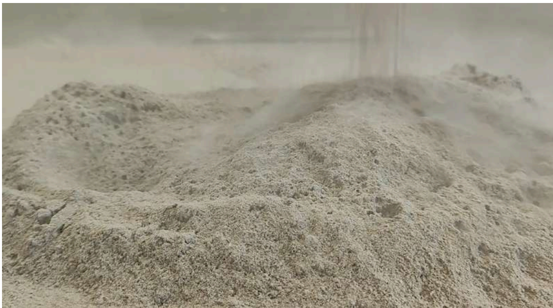
Figura 19. Roldán M, (2024). Sin Título [Video registro de ceniza] Universidad Finis Terrae.