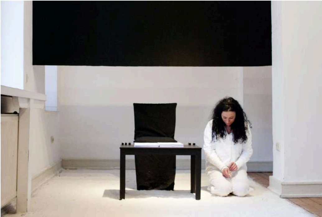
Figura 2: Toro, J. (2013). Carmin . Serie Dibujar el límite (Dibujar el límite) [Performance]. Galería 0, Colonia, Alemania. Fuente: https://janet-toro.com/es/carmin/

Janet Toro (1963, Osorno), artista chilena contemporánea reconocida por su trabajo en performance y arte acción, aborda temas de memoria histórica, derechos humanos y la resistencia frente a la opresión política. Su obra ha tenido un impacto significativo tanto a nivel nacional como internacional.