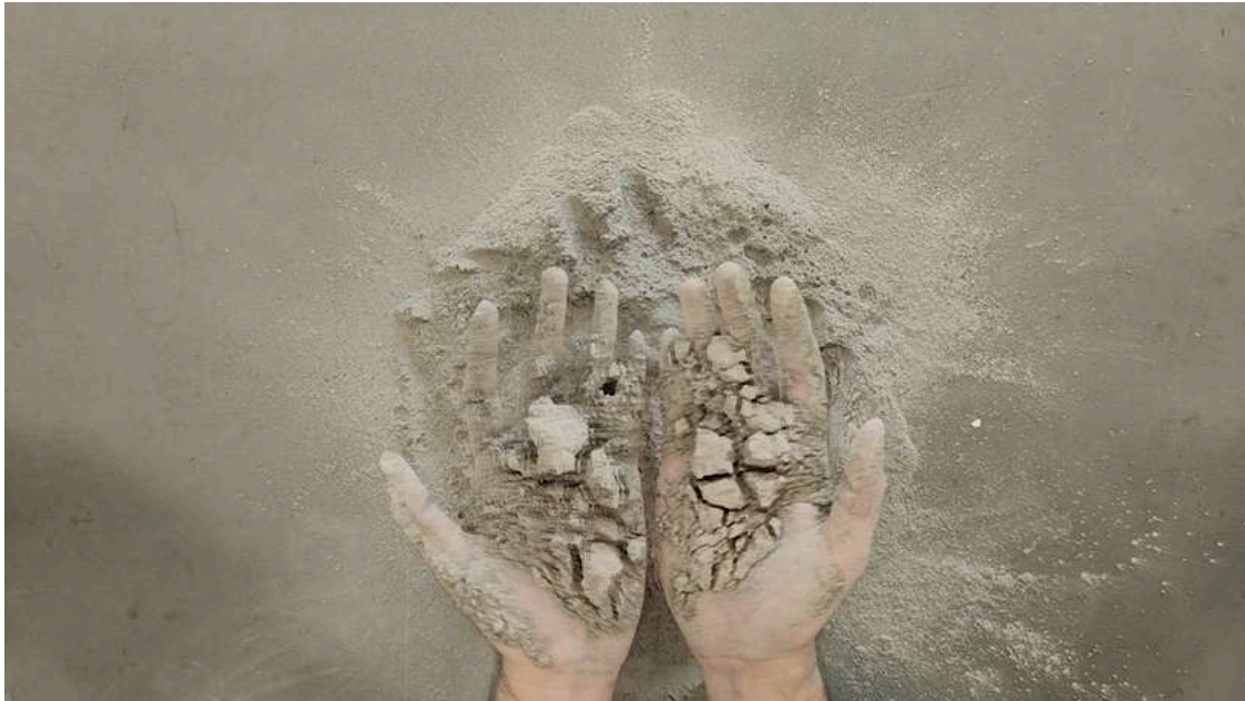
Figura 18. Roldán M, (2024). Sin Título [Video registro de interacción con ceniza] Universidad Finis Terrae.