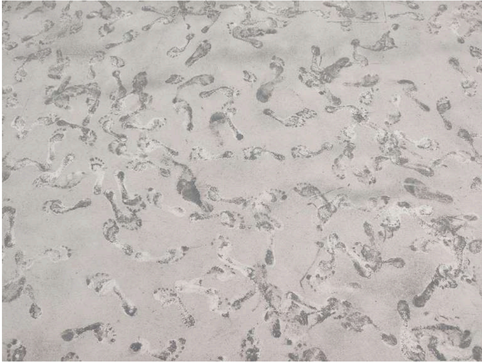
Figura 10: Roldán M, (2024). “15/04/24” [Performance con ceniza] Universidad Finis Terrae.