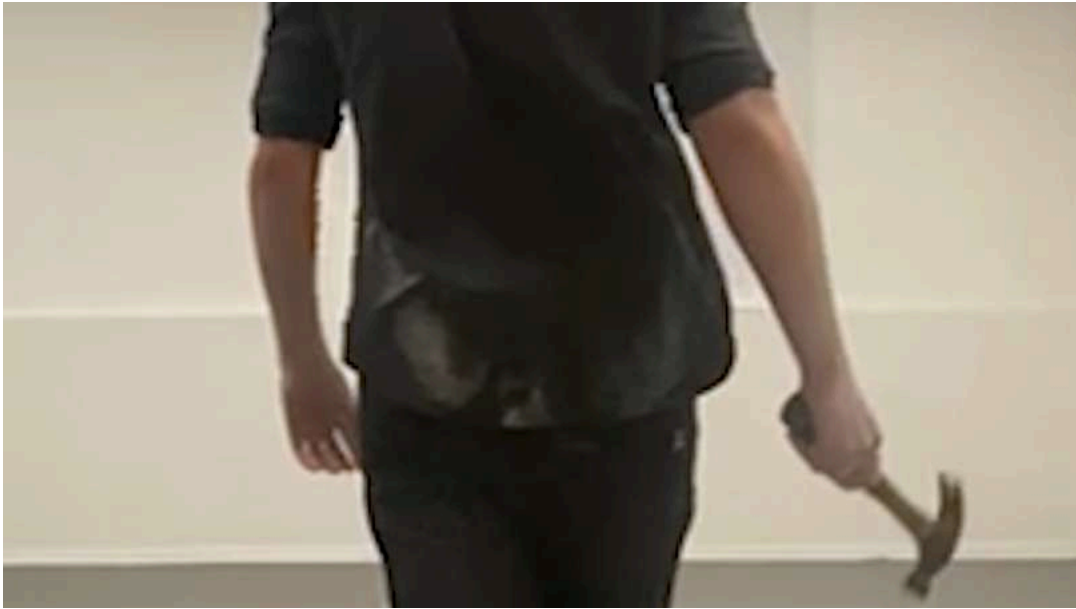
Figura 20. Roldán M, (2024). Sin Título [Video performance en solitario] Universidad Finis Terrae.