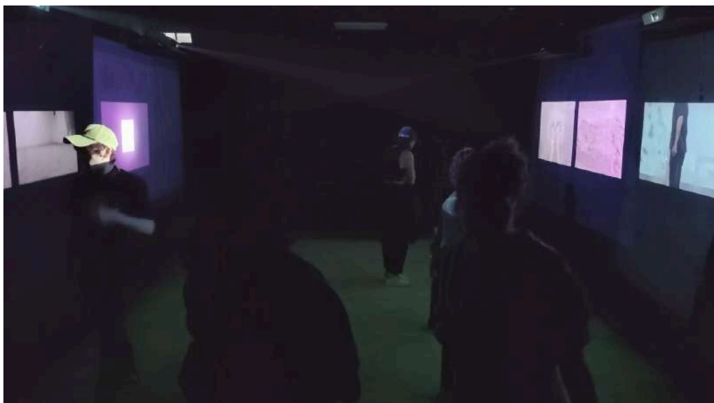
Figura 14. Roldán M, (2024). Sin Título [Exposición] Universidad Finis Terrae.

La ceniza como un otro. Este ha sido el principal planteamiento y cuestionamiento que llevó a cabo todo este desarrollo de la composición final y a su vez la posibilidad de repensar mi práctica de la performance como el establecer una comunicación con otro cuerpo sin necesidad de otra persona, un reencuentro conmigo mismo. Esta exploración me ha permitido exponer las distintas conclusiones y resultados que me ha ofrecido el cuestionamiento de la ceniza como material principal dentro de la performance. También me llevó a plantear una propuesta expositiva, en la que todos los videos expuestos se comunican entre sí, formando parte del uno y el otro al unísono. A su vez, me interesa dar cuenta tanto la volatilidad de la ceniza, por su temple ante actos donde existen ciertas diferencias de carácter agresivas entre los cuerpos exhibidos (Figura 18, 19, 20 y 21), como su lado gentil y de compañerismo si se actúa de la misma manera con ella (Figura 15, 16 y 17). Junto con ello, me interesa registrar el comportamiento de las personas al interactuar con la composición completa, es decir, con las proyecciones de estos registros junto al propio material de la ceniza expuesto en el suelo del lugar de exposición.