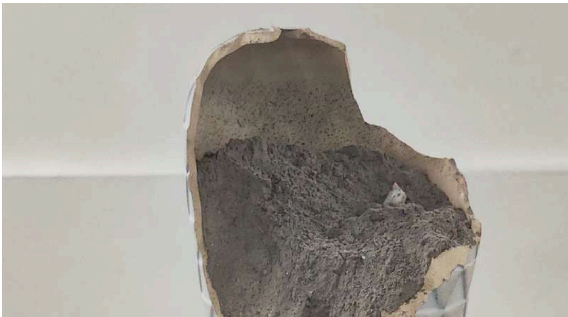
Figura 21. Roldán M, (2024). Sin Título [Video registro de performance en solitario] Universidad Finis Terrae.