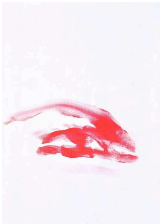
Figura 4: Toro, J. (2013). Carmín . Serie Dibujar el límite (Dibujar el límite) [Performance]. Galería 0, Colonia, Alemania.

En Carmín , Janet Toro presenta un trabajo enfocado al significado del gesto así como también a la repetición del mismo. El estado de su cuerpo va cambiando a medida que avanza en su performance debido a las secuelas de estos actos, permite que a través de estos gestos de autoflagelo su cuerpo hable y vaya mutando, comenzando desde un maquillaje al cual se le puede asociar al erotismo, belleza, exótico, pasando cada vez más al umbral de lo bufonesco, prostitución, locura y violencia. A diferencia de Zhang Huan, sus principales puntos de enfoque a la hora de crear sus performances es el origen de la identidad propia.