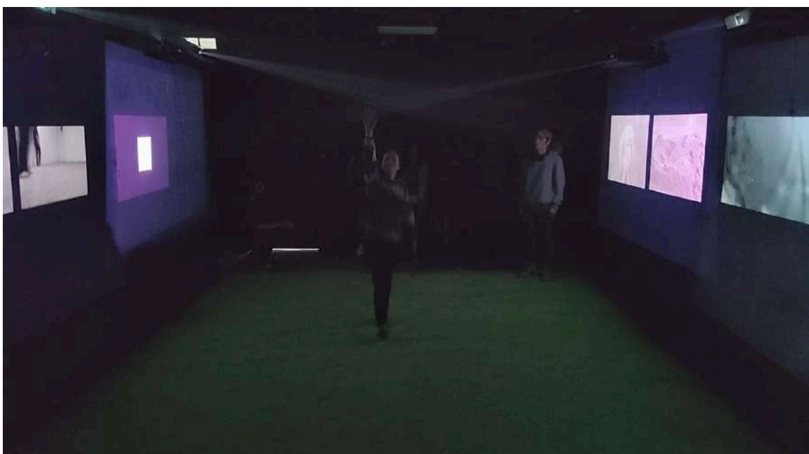
Figura 22. Roldán M, (2024). Sin Título [Exposición] Universidad Finis Terrae.

ejemplo: la insistencia de ver a la ceniza como un otro, el ver cómo el cuerpo desaparece y ver cómo transita el material, que no se logra fijar en ciertas acciones de la performance. Se dejan ver elementos en el que no se sabe si realmente es una mano o si la mano está compuesta del mismo material de la ceniza, o si son manos reales. Esto hace que se pierda la figura, se difumine, y se mezcle de tal manera que ambas se vuelven uno.