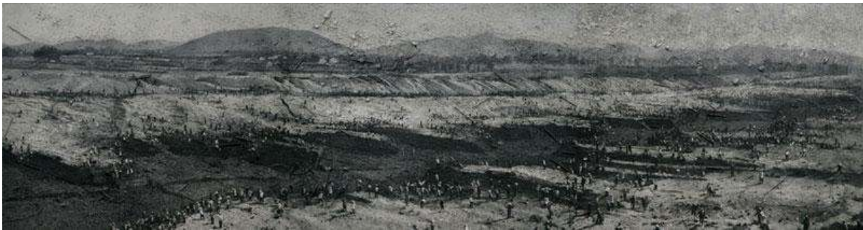
Figura 1. Huan, Z. (2007). Great Leap Forward - Canal Building . Serie Ash Paintings [Base de ceniza de incienso sobre tela]