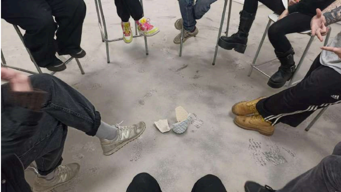
Figura 13. Roldán M, (2024). Sin Título [Performance colectiva con objeto] Universidad Finis Terrae.

Para el tercer y último trabajo de experimentación (fig. 12 y 13), las personas participantes recorrieron la sala y entablaron una comunicación entre los vestigios ocurridos en la entrega anterior. Se estableció una cierta “conversación” entre ellos. De aquí nace una posible “sub-rama” de mi investigación, la cual ocurriría en la posibilidad de establecer una nueva forma de comunicación, por así decirlo. No en su totalidad, claro está, pero con la intención de ver las relaciones humanas como una problemática actual en el arte contemporáneo. Bourriaud (2006-2008) en su libro Estética relacional , afirma que: