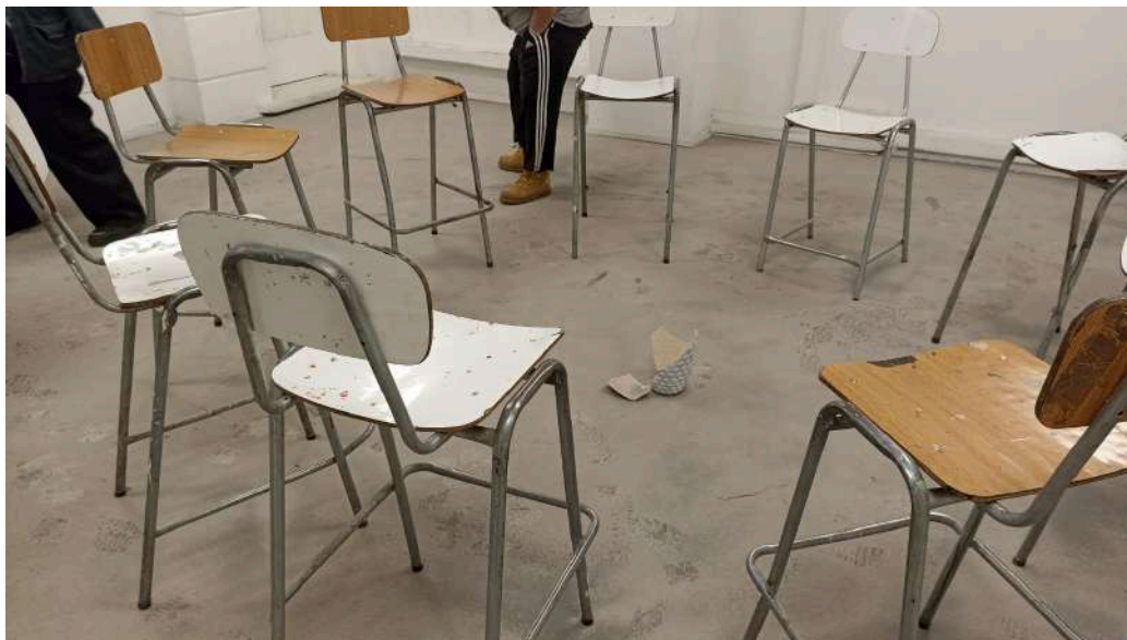
Figura 12. Roldán M, (2024). Sin Título [Performance colectiva con objeto] Universidad Finis Terrae.

En base a la experimentación de la transformación de un objeto mediante el “acto performativo”, considero que la performance no es solo la que ejerzo con mi propio cuerpo, sino que incluso está en la performatividad del material, que es un cuerpo que se transforma, para terminar siendo un otro, y que además no termina solo con las limitaciones de mi propio cuerpo. En este trabajo trato de evidenciar que es un material que puede tomar forma dentro de un molde y que en el momento que se rompe ese molde, toma una volatilidad. Vuelve su volatilidad y pierde esa forma que en un momento pudo haber tenido.