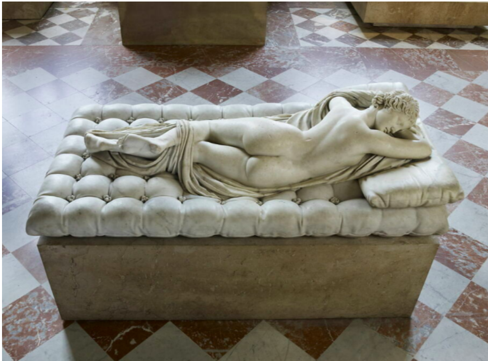
[Figura 1] Bernini, G.L. (1618) Hermafrodite Edormi [escultura]. Museo Louvre, París, Francia.

La base de esta obra comienza a partir del interés profundo de la artista sobre las posibilidades que diferentes materiales poseen, el cual la acompaña desde una temprana edad, viendo obras como “La Miseria” (1908) de Ernesto Concha en el Museo Nacional de Bellas Artes y más adelante la escultura “Hermafrodito Durmiente” (1620) de Gian Lorenzo Bernini en el museo Louvre, París [Figura 1]. Lo principal en la segunda obra, parece ser la figura humana, pero para la artista, lo fué la cama en la que se encuentra reposando, la cual demuestra cómo a partir de la técnica, es posible crear una textura completamente distinta a la del material trabajado. Es importante mencionar esto, ya que fué una motivación importante al momento de crear este trabajo.