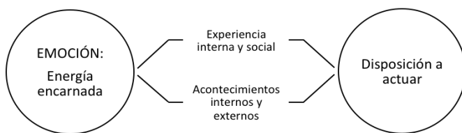
Figura 1. Representación del concepto de “emoción”, según J. Casassus (2015, p. 99). Elaboración propia

Para Casassus (2015) hablar de emociones es hacer referencia a diversos estados, experiencias y vivencias, las que se pueden identificar como alegría, asombro, admiración, celos, entre muchas otras. Al mismo tiempo, sostiene que todas ellas se vivencian en el cuerpo, en el mundo subjetivo, que a veces se las puede nombrar y que en otras ocasiones no se encuentran palabras para poder identificarlas y verbalizarlas (p. 99).