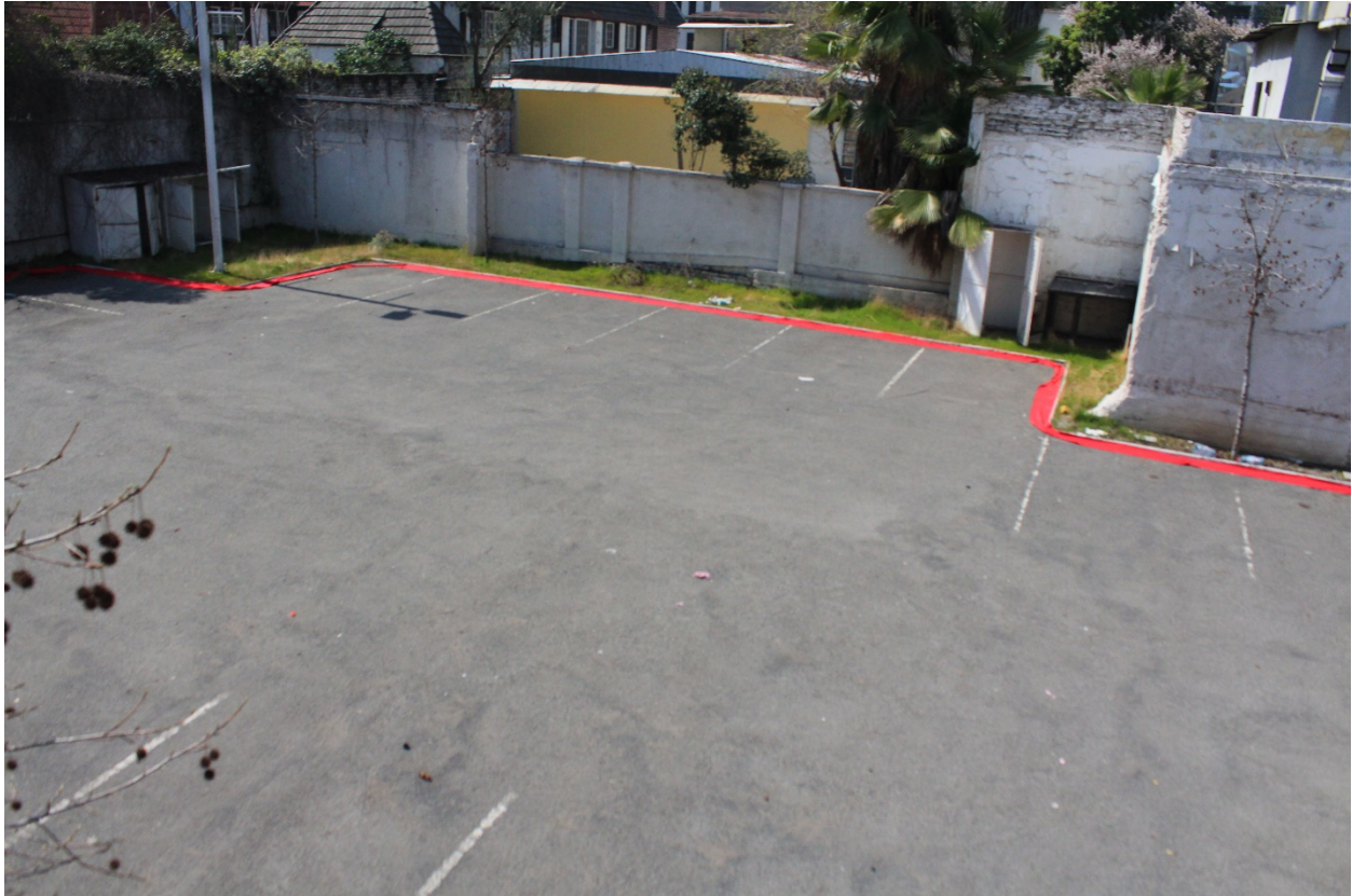
Imagen N°5: Nos Han Dado la Tierra (fragmento). Performance estacionamiento abandonado. Cien metros de tela roja dispuestos en el perímetro del lugar. (2018)

universidad, espacio que se encuentra en proceso de concesión y que por lo tanto permanece temporalmente abandonado. En el lugar demarqué el perímetro con la tela haciendo referencia a la construcción de un mapa y de esta forma a la apropiación del lugar.