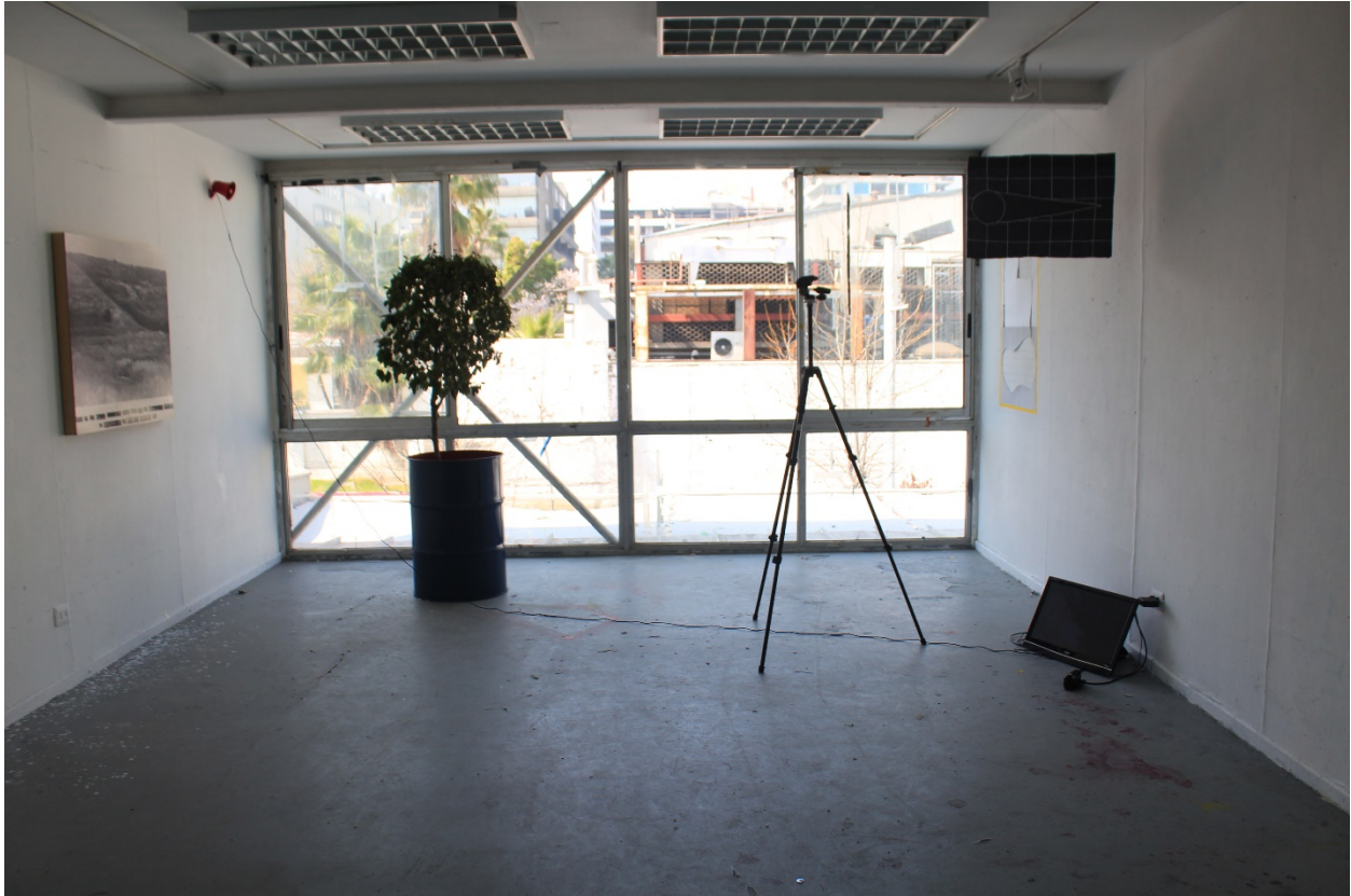
Imagen N°6: Nos Han Dado la Tierra. Montaje. Fotografía de paisaje, video, bandera, árbol robado, bocina, trípode con cámara. (2018)

Otras dos obras sucedieron a esta, donde utilicé los mismos mecanismos con el mismo fin, haciendo banderas, intentando ver en qué lugar se instalan, relatando el periplo de la búsqueda.