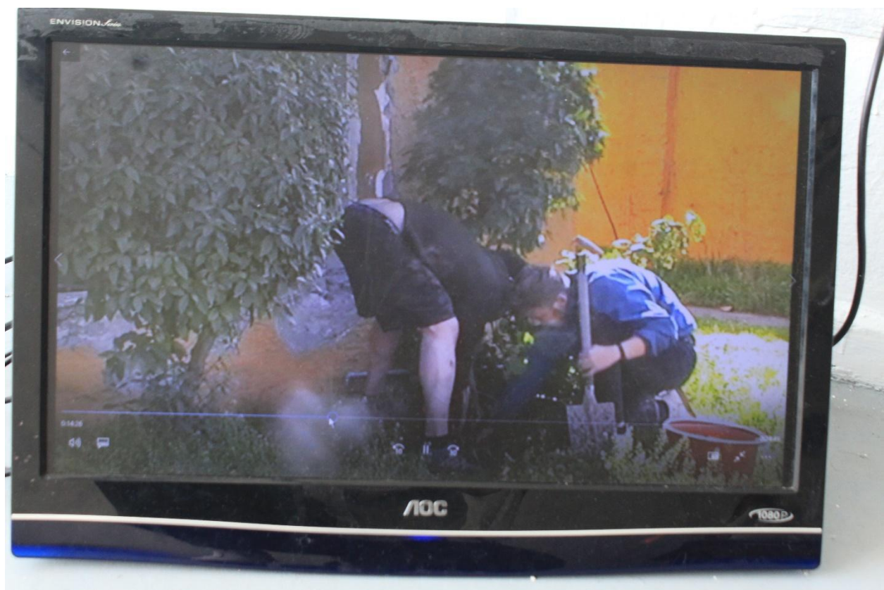
Imagen N°4: Nos Han Dado la Tierra (Fragmento). Video del robo de un árbol. (2018)

La cámara por otro lado estaba fijada al carro donde el árbol fue transportado, lo que permitía apreciar las dificultades del camino, las pausas, las imperfecciones del pavimento y el tiempo exacto que me demoré en realizar la acción, sin cortes. Esto a la vez hablaba de la prescindencia de un camarógrafo como una señal de lo solitario de esta búsqueda en los tiempos de la caída de los grandes dilemas. Por otra parte, el hecho de poner la cámara en el carro se homologa con el medio por el cual Juan Rulfo relata la historia, donde a través de diferentes montajes cinematográficos el autor relata viendo la situación con la visión de una cámara, planos generales y primerísimos primeros planos conforman la estructura según la cual el autor narra los hechos.