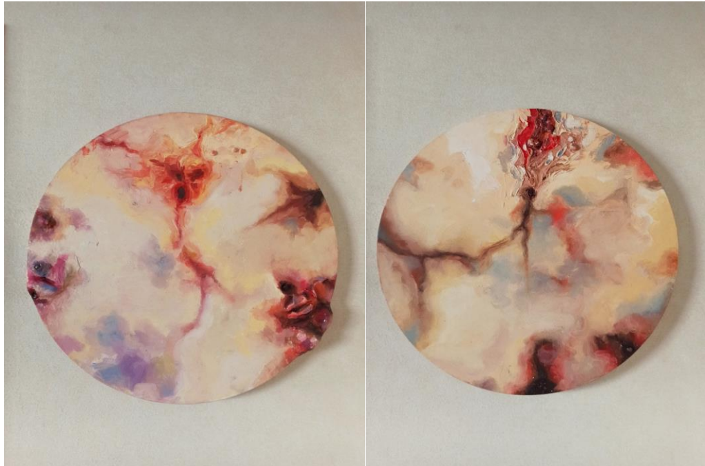
Figura 1. Imagen de autoría. Díptico Obscenidades (2023).

la exploración de diversos materiales como la espuma de poliuretano, plumavit, arcilla, entre otros; llegue a la creación de piezas escultóricas que podría definir como la expresión tridimensional de las pinturas que realicé anteriormente.