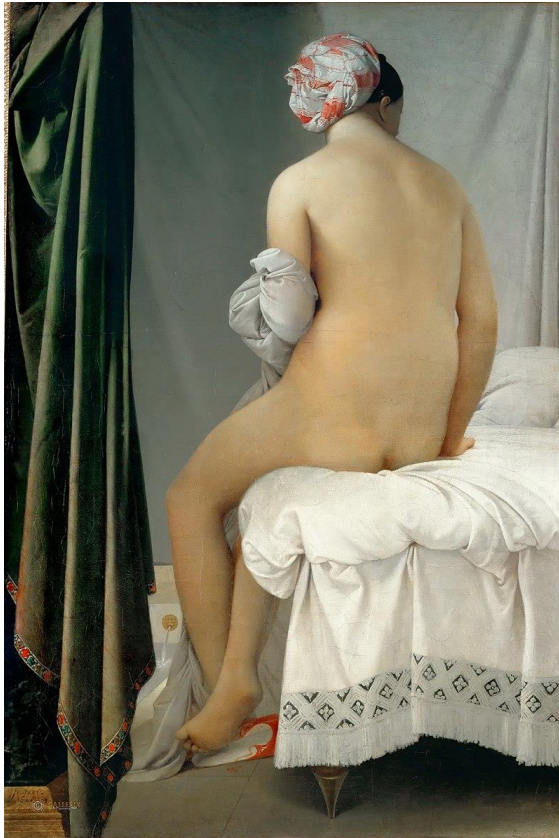
Figura 5. La bañista de Valpinçon (1808). Ingres. Óleo sobre tela.

En la imagen se puede observar a una mujer sentada de espaldas al espectador, los elementos que rodean a la misma son escasos dando a entender que lo más importante era la mujer desnuda. A pesar de que Ingres tenía una fascinación por pintar elementos orientales, los cuerpos representados eran de una corporeidad claramente europeas, la mujer representada tenía la piel clara y las curvas de su cuerpo eran exageradas por el artista, eso último era una tendencia que hasta hoy se analiza de Ingres, solía exagerar la anatomía de las modelos haciéndolas incongruentes con la realidad. La protagonista de la pintura