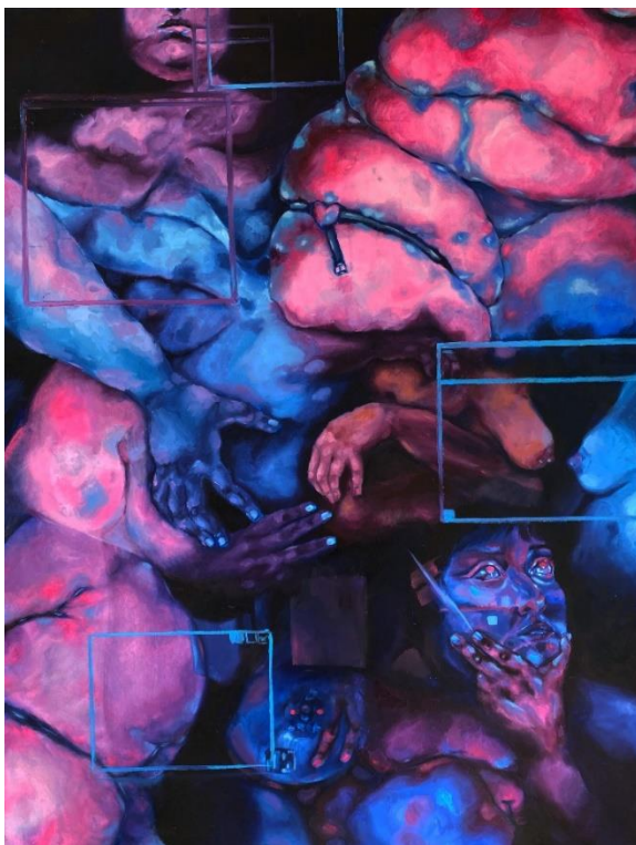
Figura 7. Yo virtual (2022). Autoría propia. Óleo sobre tela.

Esta situación me llevó a pintar el último autorretrato que hice durante estos años de carrera, sentí fuertemente la presión por encajar y la disconformidad con mi propio cuerpo, lo veía como algo deforme, cambiante e irregular. Unos días estaba feliz por mi apariencia y otros días la odiaba a tal punto que no podía salir de la casa, sentía que mi cuerpo era masa grotesca.