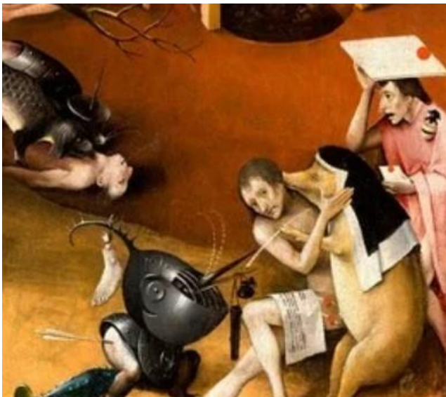
Figura 3. (Fragmento). El jardín de las delicias (1515). El Bosco. Tríptico, Óleo sobre tabla.

Pareciera ser que el paso al infierno es el momento en el que se adquiere conciencia del pecado detrás de los placeres mundanos, es en ese momento donde los impulsos se descontrolan y al ser el infierno el peor lugar donde podrían estar, los límites desaparecen. Este descontrol es representado gráficamente en la obra del Bosco a través de las diversas escenas del infierno llegando a ser tan fantásticas que caen en lo absurdo, otra característica que puede formar parte de lo grotesco.