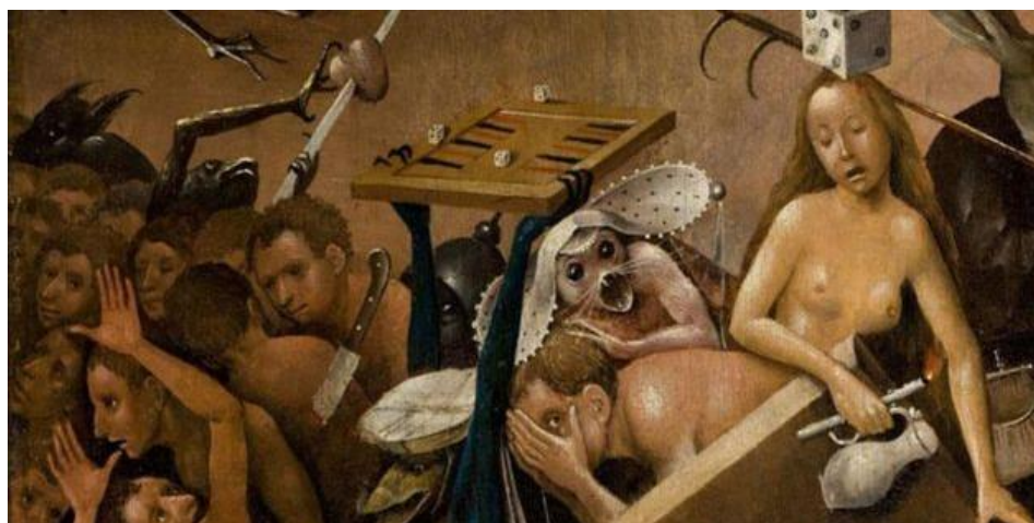
Figura 2. (Fragmento). El jardín de las delicias (1515). El Bosco. Tríptico. Óleo sobre tabla.

Uno de los artistas cuyas obras se caracterizan por ser grotescas fue El Bosco, sus obras han sido objeto de profundos análisis a lo largo de la historia y lo que me lleva en esta ocasión a mencionarlo como ejemplo son las peculiaridades que caracterizan a una de sus obras más famosas titulada El jardín de las delicias (1515).