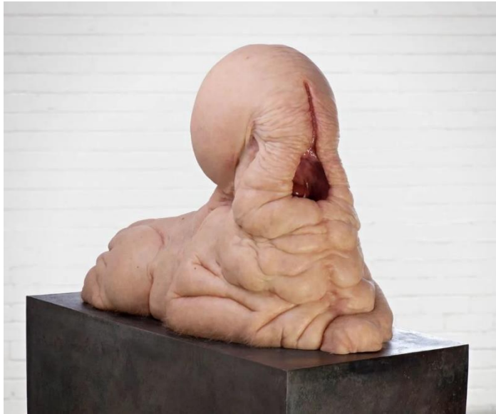
Figura 4. Sphinx (2012). Patricia Piccinini.

Las obras de Patricia son fascinantes por sí mismas, no hace falta saber las intenciones de la artista para vislumbrar ciertos elementos y hacer algunas afirmaciones. La búsqueda de la similitud con el cuerpo es inevitable, la morfología de este trozo de carne nos hace pensar que hubo algún rastro de humanidad en él, la posición y la forma de este bulbo superior recuerda a la cabeza de un bebé, grande y calva; en la posición recostada en la que se presenta este ente vemos como su piel cae de tal forma que es comparable con el cuerpo y la grasa de un cuerpo obeso.