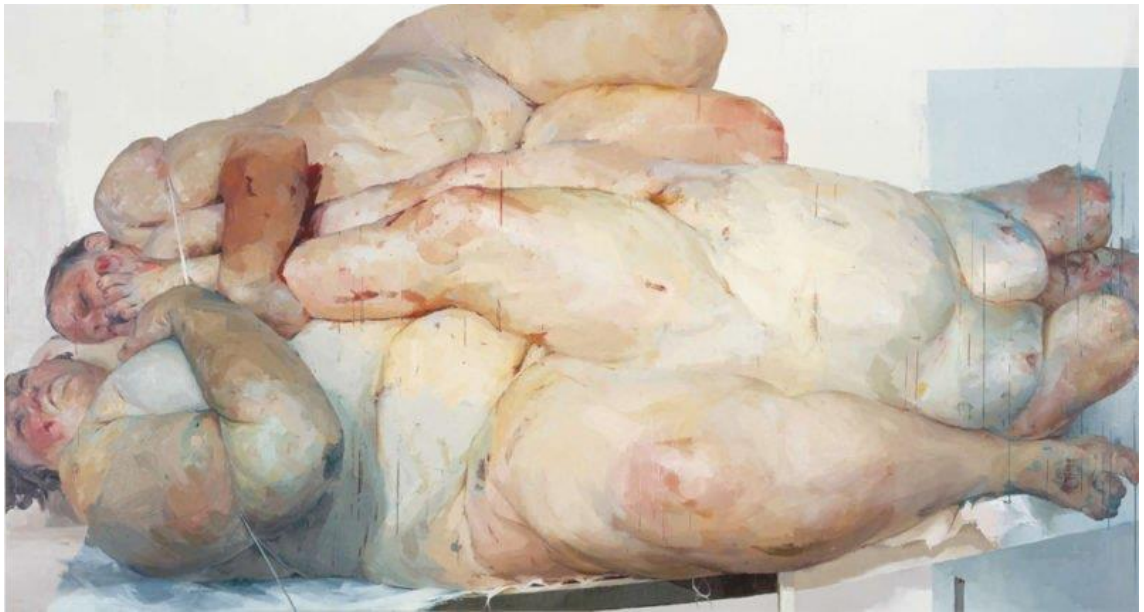
Figura 8. Fulcrum (1999). Jenny Saville. Óleo sobre tela.

Lo que más me gustaba representar, además del trasfondo personal relacionado con la identidad, eran estas carnaciones, los volúmenes del cuerpo mezclándose con otros, buscaba representar la carne blanda y grasosa presente en mi propio ser. Uno de los referentes a los que más acudí durante este periodo fue Jenny Saville, ella trabaja con el autorretrato y las carnaciones, además sus pinturas son de un gran formato siendo coherente con los cuerpos que representa.