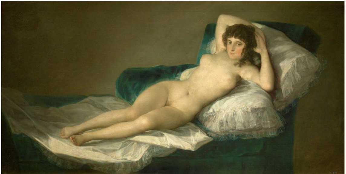
Figura 6. La maja desnuda (1800). Goya. Óleo sobre tela.

en el cuerpo de la misma. Para graficar lo descrito anteriormente acudiré a uno de los cuadros más famosos de Goya titulado La maja desnuda .