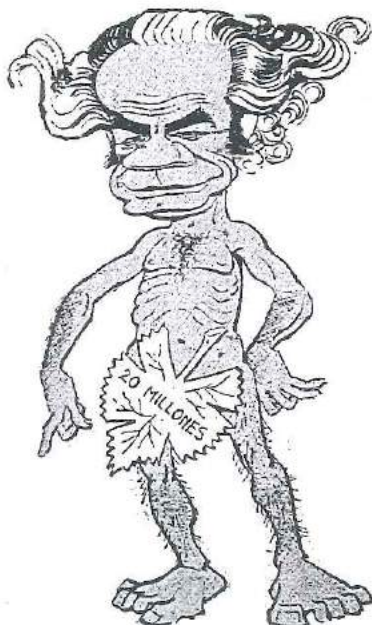
El Premio Nacional o la hoja de parra

gran vástago literario— es como un temporal en una taza de té; como un espejo que dice la verdad; como una mancha de nieve en una roca... Curiosa manera de describir su arte poético, uno de los más singulares del siglo XX, mezcla de ingredientes tan disímiles como gotas de angustia, humor negro, blanco y del otro, ironía, conciencia social y humana, irreligión, personajes acorralados como animales de circo o como actores de novelas del absurdo, todo escrito en un lenguaje cotidiano, directo, coloquial, profano. Pero muy sentido, con olor a hombre, a sudor.