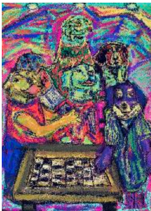
Imagen n°2: Sin título (2020). Técnica: Pintura digital

En la pintura (imagen n° 1) me permitió dar cuenta del modo en el que puedo experimentar la pintura digital explorando siempre lo que llama mi atención o que se hace recurrente al momento de pintar, como lo es la línea, el contorno del fondo con los personajes, la utilización de otros colores y matices. En este caso, como primer intento pictórico deje a la vista el grosor de la línea y de esta manera vi y experimenté que no permitía la correcta o agradable visualización, ya que se perdía por la saturación, el grosor y el color de la línea y en el que también pude ver que no solamente existe el negro para poder trazar una línea, que en ocasiones si es precisa, pero que también puedo indagar en como quedaría con otros colores y tonos. Por ejemplo, en la imagen n°2, n°3, n°4 y n°5, pude continuar con la pintura principal, la cual me permitió hacer cambios, así como también evidenciar una búsqueda en lo que yo consideraba que no funcionaba.