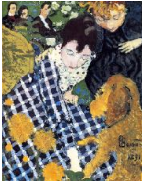
Imagen nº 24: Pierre Bonnard (1891). Woman with dog (Pintura), Clark Art Institute.