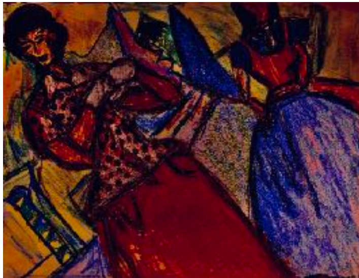
Imagen n° 19: Sin título (2020). Técnica: Lápiz cera sobre papel de croquera.

Lo anterior me ha permitido abordar un camino dentro de la experimentación con la técnica del croquis, siendo un método cercano, no sé si simple, pero que finalmente ha sido y es posible que seguirá siendo una necesidad propia e interna para sentirme bien día a día. Es así como una medicina para mi vida. Porque de eso se trata, de no desvanecerme en cuatro paredes, siendo que dentro de ella hay mucha vida, mucho amor y mucho para seguir experimentando y plasmando por medio de mi croquera.