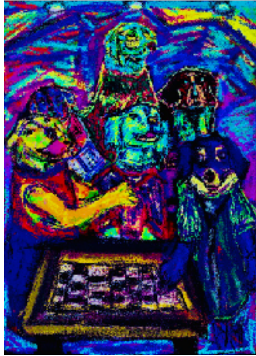
Imagen nº3: Sin título (2020). Técnica: Pintura digital