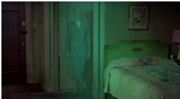
Imagen nº16: “La pesadilla de Scottie” (1958). Vértigo .