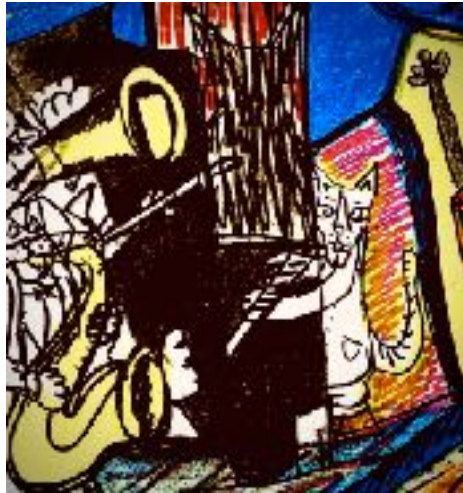
Imagen N°10: “Orquesta con mis amigos” (2020). Técnica mixta sobre papel