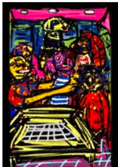
Imagen n°1: Sin título (2020). Técnica: Pintura digital

A continuación, van algunos ejemplos que hice en el software Paint, de una propuesta que surgió en Pandemia para un proyecto musical.