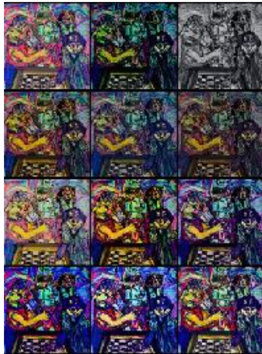
Imagen nº4: Sin título (2020). Técnica: Pintura digital