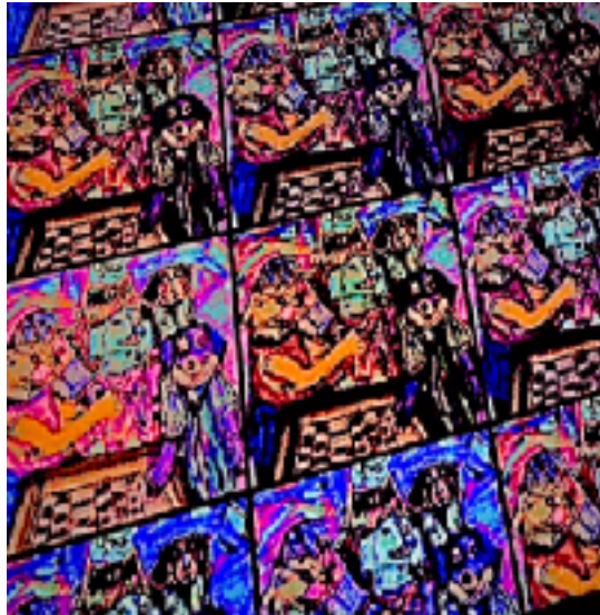
Imagen nº5: Sin título (2020). Técnica: Pintura digital

En esta siguiente propuesta digital, pude solucionar temas como el color, forma y la aplicación de los contornos o líneas en las imágenes continuas. Aprendí de lo anterior, para no colmar de una línea oscura y densa la imagen.