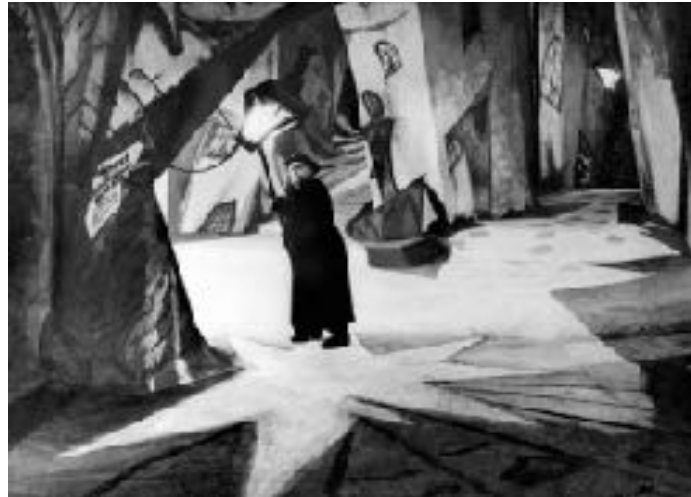
Imagen nº20: “El gabinete del doctor Caligari” (1920). Robert Wiene.

za de los personajes y su gran manera al momento de su gestualidad. Ciertamente aquí lo más potente es la expresión visual que da lugar al modo en cómo se ve o veían su propia realidad, aún más tomándolo no solo como terror, sino que como fuente próxima que se vería sobre el autoritarismo en Alemania y que afectaría indudablemente a millones en sus vidas.