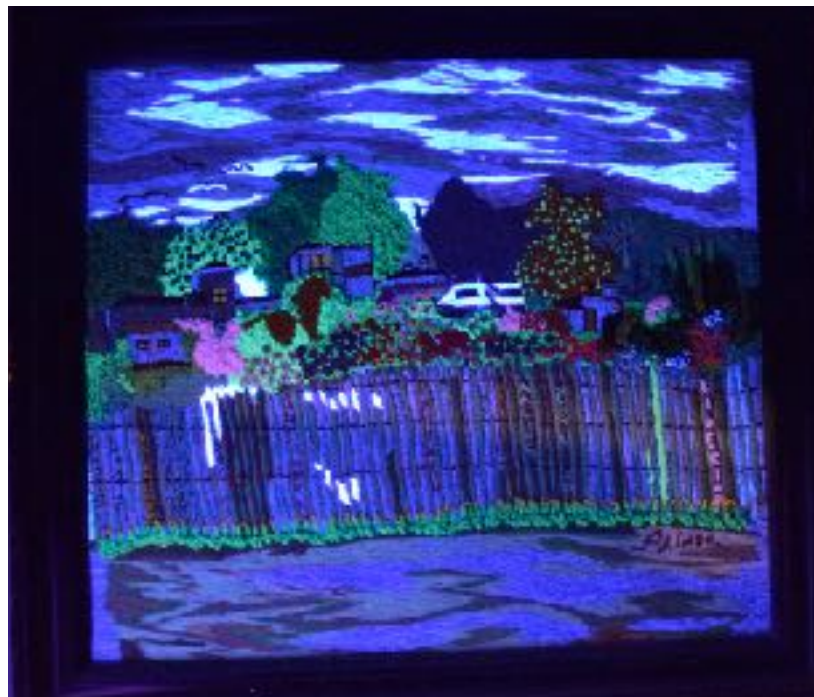
Imagen n°14: Arinda Cossio (2014) “Sin título” (Lanigrafia).

Así como también trabajo con personajes sacados de revistas antiguas de mi abuela y fotografías de mis propios hermanos gatunos y perrunos, que dan lugar a una interpretación que se ve marcada por el trazo, el color y las capas de pinturas.