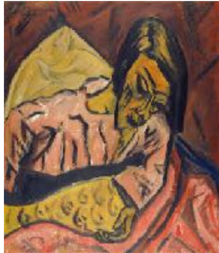
Imagen nº 25: Erich Heckel (1913). Tired (Pintura), Museum Folkwang.