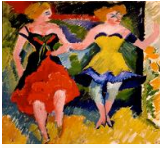
Imagen nº 26 : Max Pechstein (1912). Ballet Dancers (Pintura).