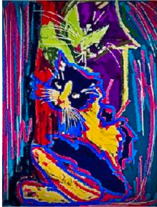
Imagen nº7: Sin título (2020). Técnica: Pintura digital