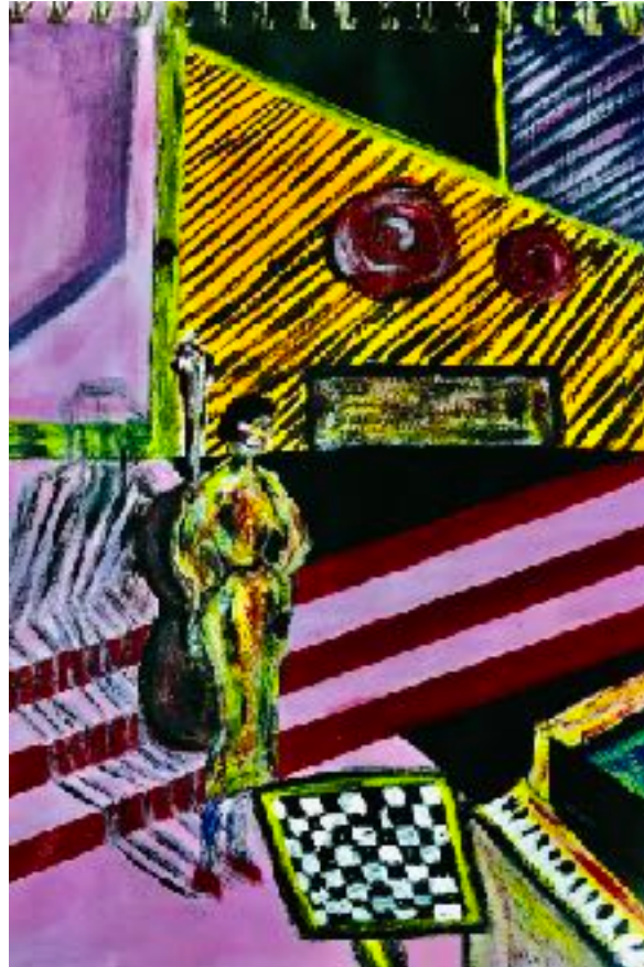
Imagen nº18: “Sin título” (2020). Técnica: Acrílico sobre papel de croquera.

Tales ocurrencias que he tenido son producto de mi propio espacio. Por ejemplo, en mi habitación tengo estímulos instrumentales que han sido una parte importante cuando pinto y que evidencian ese gusto por la música, y en la que aparecen reiterados en cada boceto. Como lo es en la imagen nº18. Esa parte me provoca reacciones intensas que traspaso capa tras capa, color tras color. Lo anterior me recuerda lo que Kandinsky consideraba, ya que él creía que la música provocaba en él reacciones intensas y que para mí es un buen estímulo visual. Una de sus citas más famosas dice que “El color es el teclado, los ojos son los Martinetes, el alma es un piano de muchas cuerdas. El artista es la mano que toca, pulsando una tecla tras otra con el propósito de producir vibraciones en el alma”.