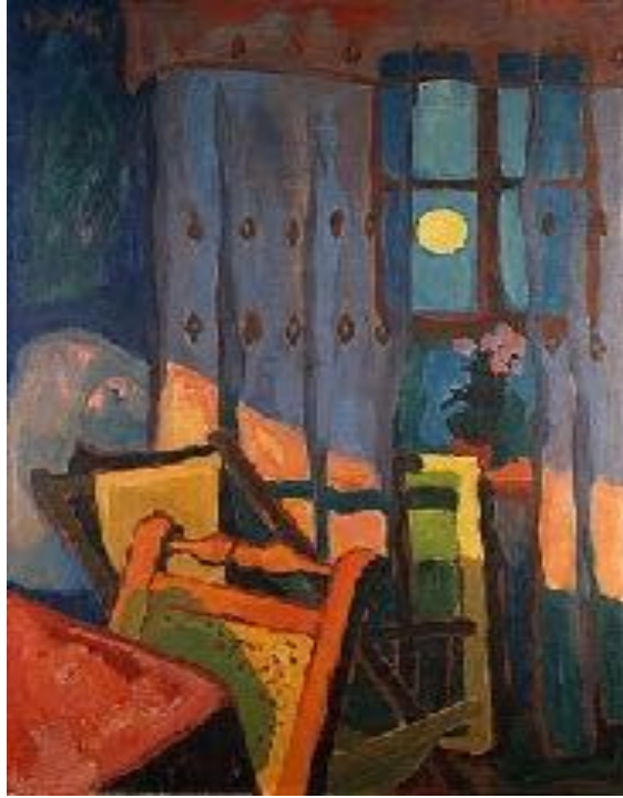
Imagen nº 23: Karl Schmidt- Rottluff (1935). Evening in the room (Pintura)