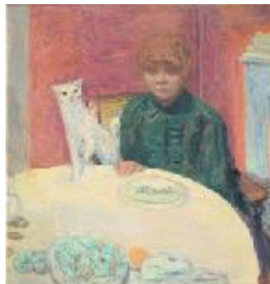
Imagen nº27: Pierre Bonnard (1912). El gato exigente (Pintura)