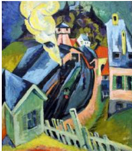
Imagen n° 22: Ernest Ludwig Kirchner (1916). Estación de Koenigstein (Pintura), Instituto Städel.