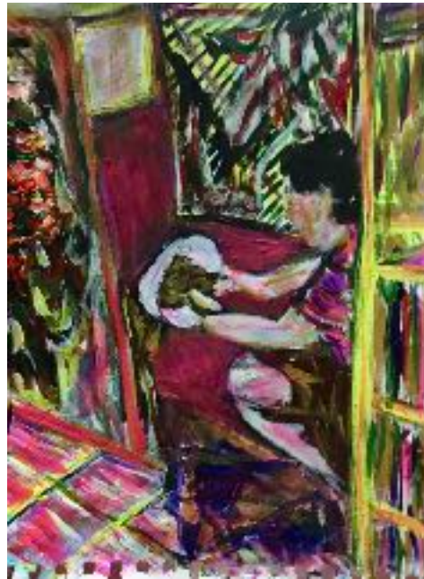
Imagen n° 28: “Linda esperanza” (2020). Técnica: Acrílico sobre papel de croquera.

Es por eso que a través de todos los referentes investigados y mencionados me remito a su manera de ver la realidad, a la manera en que se expresan a través de la pintura y sobre todo a esa carga tan íntima que me hace mucho sentido para continuar fortaleciendo y creciendo tanto de manera personal como profesional. El hecho de haberme propuesto dibujar, pintar y experimentar a través de lo que tenía a la mano en todo este período de Pandemia, me ha hecho sentir como un bálsamo para mis días grises, así como también para marcar esos días llenos de colores y vitalidad. En simples palabras pude encontrar un cobijo en mi croquera y plasmar todas mis ideas, aquellos proyectos pensados en escala grande, así como también solo bosquejos para reflexionar y sobre todo aquello que me llena a diario, como lo es en la imagen n°28.