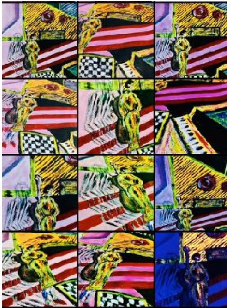
Imagen nº13: “Un recorrido con Joaquín”. Año:2020. Técnica: Técnica mixta

Analizando o tan solo observando la pintura, se llega a un punto en el que todo se une o resuena y da esa oscilación y ecualización tan rica en armonía, ritmo, y secuencia. Pues eso es lo que me gusta transmitir, realizar representaciones pictóricas que, siendo tan distintas, finalmente llegan a representar lo que siento.