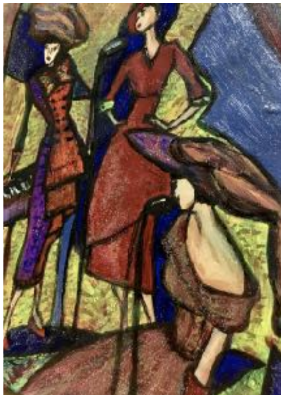
Imagen n°12: “sigo sintiéndolo” (2020). Técnica: Acrílico sobre papel de croquera.

En las siguientes obras están presente aquellos personajes, esa manera especial del tratamiento del color, la capa sobre capa, y la deformidad, tanto de los personajes como del ambiente en general, hecha ya sea de manera digital, con lápices “palito”, crayones, o con acrílico; ya sea en un bastidor o en mi croquera, que definitivamente ha sido mi compañera durante la pandemia.