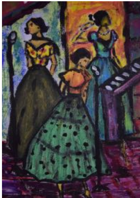
Imagen n°11: “Esto pasa en mi habitación” (2020). Técnica: Acrílico sobre papel de croquera.