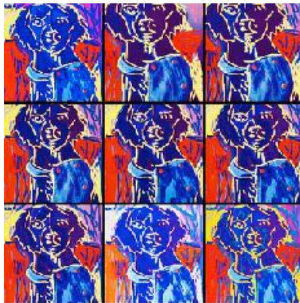
Imagen Nº 6: ¡Nueve veces bella! (2020). Técnica: Pintura digital

En esta siguiente propuesta digital, pude solucionar temas como el color, forma y la aplicación de los contornos o líneas en las imágenes continuas. Aprendí de lo anterior, para no colmar de una línea oscura y densa la imagen.