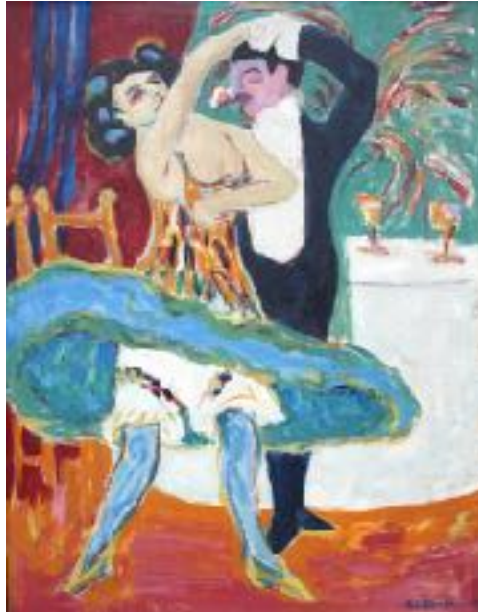
Imagen N° 21: Ernest Ludwig Kirchner (1909). Teatro de variedades (Pintura), Instituto Städel.

dad, sencillez, alegría pero que, sin embargo, revelaba un cumulo de sensaciones en la que muchas veces son complejas y cargadas de diferentes matices.