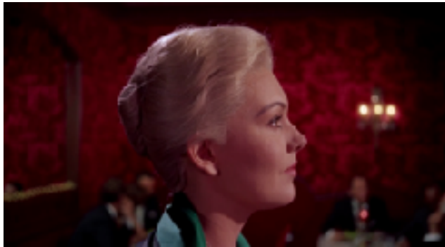
Imagen nº15: “Escena Madeleine” (1958) Vértigo .

Posterior a eso hay muchas escenas que son desarrolladas a través del color. y ese juego del rojo y verde, en el que también cambian o suman más significados dependiendo de la escena. Por ejemplo, en la imagen nº 16 y que es una de las escenas memorables de Vértigo , es la pesadilla que tiene Scottie producto de la muerte de Madeleine, en la que el vértigo se apodera de él y se representa de un rojo completo, y que se va intercalando con la luz y la aparición de él, demostrando la luz de la realidad.