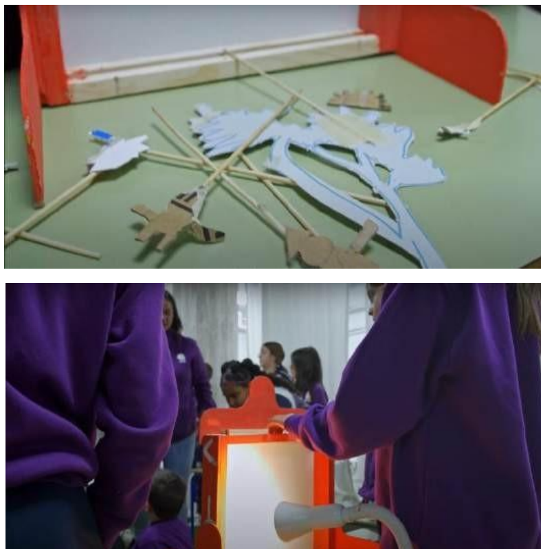
FIGURA 1. Pasos para la creación en Teatro de Sombras

Fuente: Autora (2024). Fotograma compuesto por dos fotos del video documentativo del proyecto: https://bit.ly/3NRQm0L , realizado por Gonzalo Ruiz y Jesús Peralta.