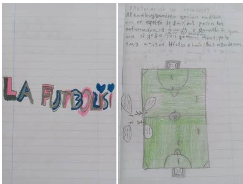
FIGURA 4. Argumento de la obra “Las Futbolistas” del grupo Las Futbolistas