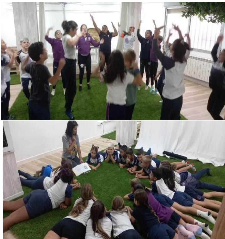
FIGURA 2. Predisposición corporal para la creación en Teatro de Sombras