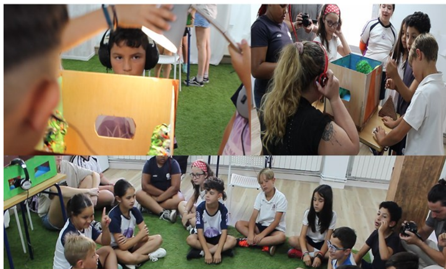
FIGURA 5. Estreno de las obras