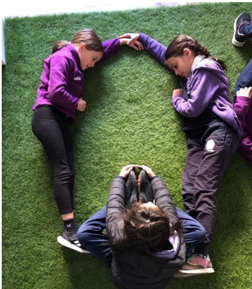
FIGURA 2. Corporeización Edad de los Metales