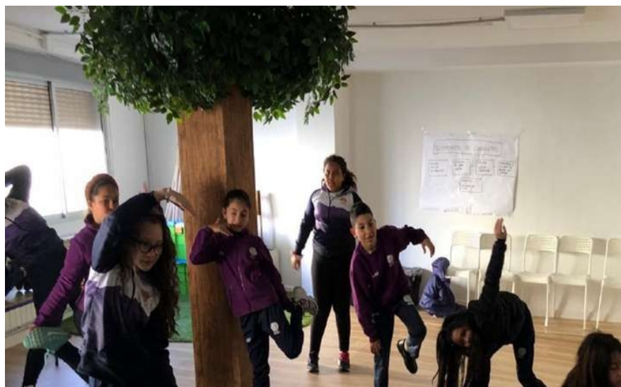
FIGURA 1. Sensibilización corporal en el Aula