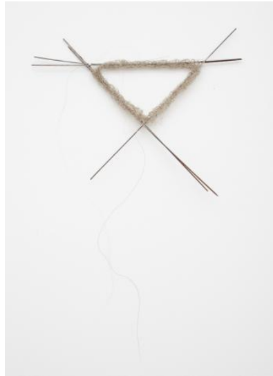
Fig. 5: Untitled Marisa Merz, 1970 triangulo de cuerda de nylon y hierro 8 3/8 x 11 1/2 cada uno (21 x 29 cm), Abril 5 - Junio 8, 2013, New York | 24th Street.