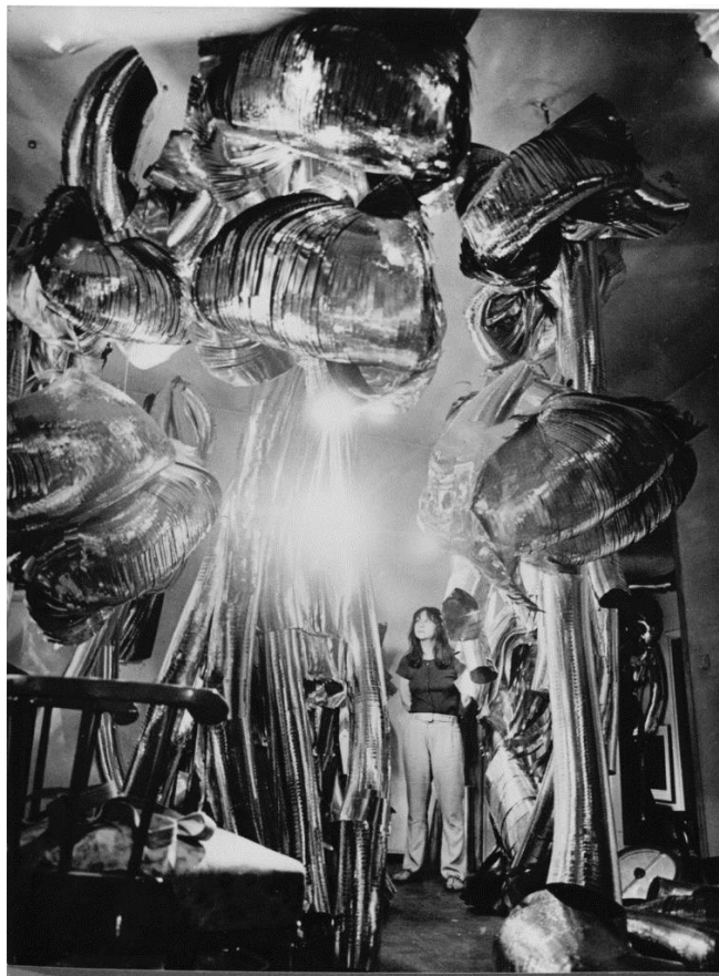
Fig. 4 'Untitled (Living Sculpture)', 1966. estructuras de aluminio, muestra ubicada en la casa de la artista.

“También es considerado como una extensión del cuerpo y el alma del mismo, conectándose directamente con el entorno, la naturaleza y todo lo que lo rodea entrando en armonía y estilo únicos, dado por los materiales no comunes con los que trabaja.” (Cerdeño Herrera, 2015: 49.) Podemos encontrar dentro de este estilo a grandes artistas como Marisa Merz, una destacada artista italiana de la década de los 60s, única mujer asociada al movimiento que trabajaba desde la abstracción a la figuración, de los formatos más pequeños a los más grandes, de lo más complejo a lo más simple, esta artista nos quería transmitir su visión respecto a la vida, de ahí las grandes variedades en materiales y complejidades en sus obras, por que así es la vida y para ella la vida y el arte son lo mismo.