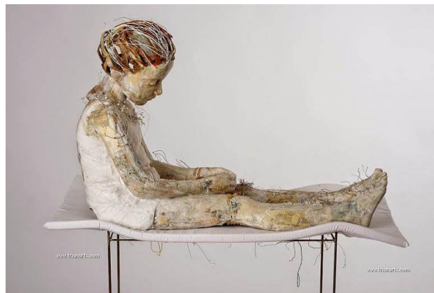
Fig. 2. Vally Nomidou, Let it bleed (2011) Fizz Gallery

Al descubrir sus propiedades, me interesé en el trabajo de Vally Nomidou, artista griega que por medio de materiales livianos como el cartón y el papel llega a una resolución detallada del cuerpo humano, incorporando un peso visual que contradice al material. También le otorga distintas texturas, sin embargo, no niega la naturaleza del material ni la técnica, dejando a la vista -en algunas partes- el cartón bruto que expresa precariedad en la obra, pero a la vez un nivel sofisticado en su procedimiento.