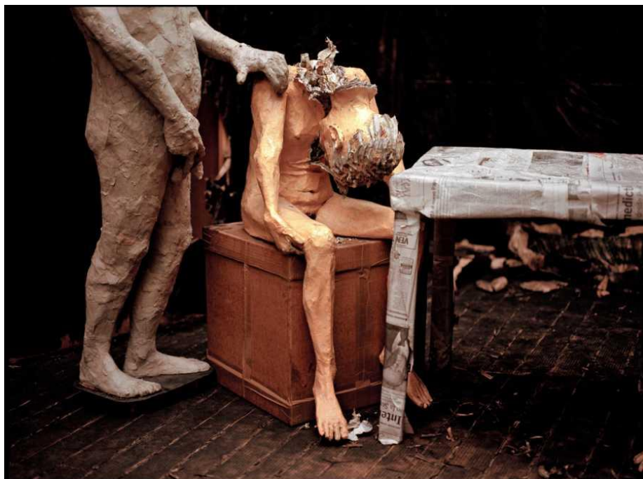
Fig. 3 Juan Pablo Langlois, Papeles Sádicos, 2011, still de video. Galeria AFA.

Este artista aplicó el abandono radical de los elementos tradicionales del arte, generando una producción que altera las relaciones conceptuales, logrando liberarse del sentido utilitarista que muchos artistas practican en el uso de los materiales. Fue un artista que no abandonó nunca su independencia creativa, que se puede leer como espontánea y fresca. La intención de este artista no fue pertenecer a la élite política ni cultural de la sociedad, siempre procuró mantenerse autónomo, no solo al momento de crear si no al momento de exponer también. Su bajo perfil y su indiferencia al reconocimiento, le permitieron ser uno de los grandes referentes de las Artes Visuales chilenas de nuestra era.