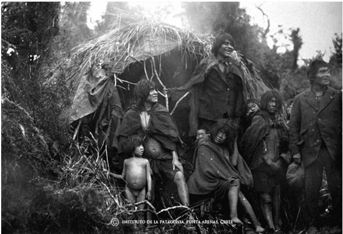
9. Casas Kawésqar construidas con pieles y madera como materiales. 29

Si bien el nomadismo era una característica común entre los pueblos fueguinos y patagones, cabe notar que fue posible apreciar en los Kawésqar cierta tendencia al sedentarismo, haciendo uso de asentamientos temporales para establecerse en lugares de buena caza y con recursos, manteniendo un manejo de estos evitando el desgaste de los mismos. Ejemplo de estos asentamientos fue el caso de Jetarktétqal previo a su ocupación por la Fuerza Aérea Chilena, rebautizada como Puerto Edén en 1937.