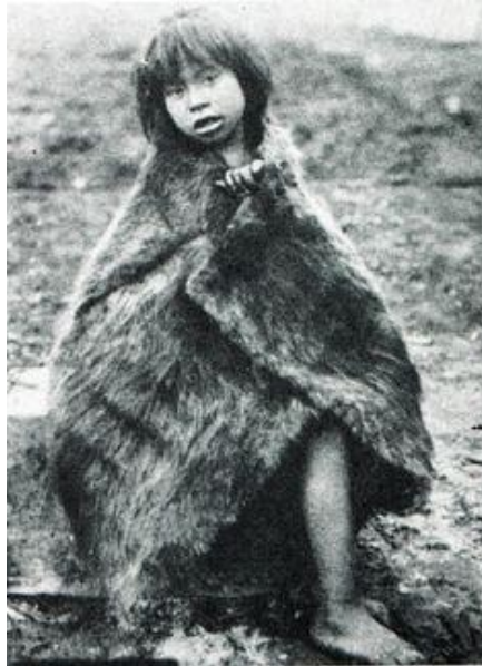
Niña en pieles 24

Los kawésqar no utilizaban la escritura, estando organizados en tribus seminómadas cuya relación cultural recae en la tradición oral. Por esta razón es que en su totalidad la información sobre los pueblos fueguinos y patagones comenzó a aparecer con la llegada de los navegantes europeos y agentes del estado chileno.