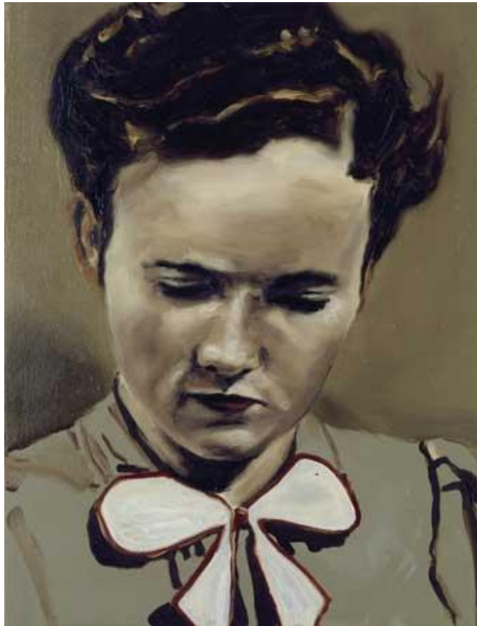
5. Michael Borremans, Terror Identificado