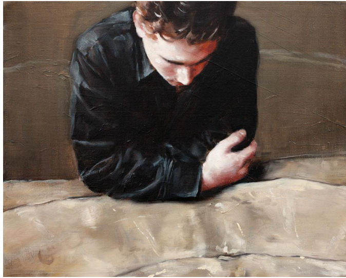
4. Michael Borremans, La Pintura