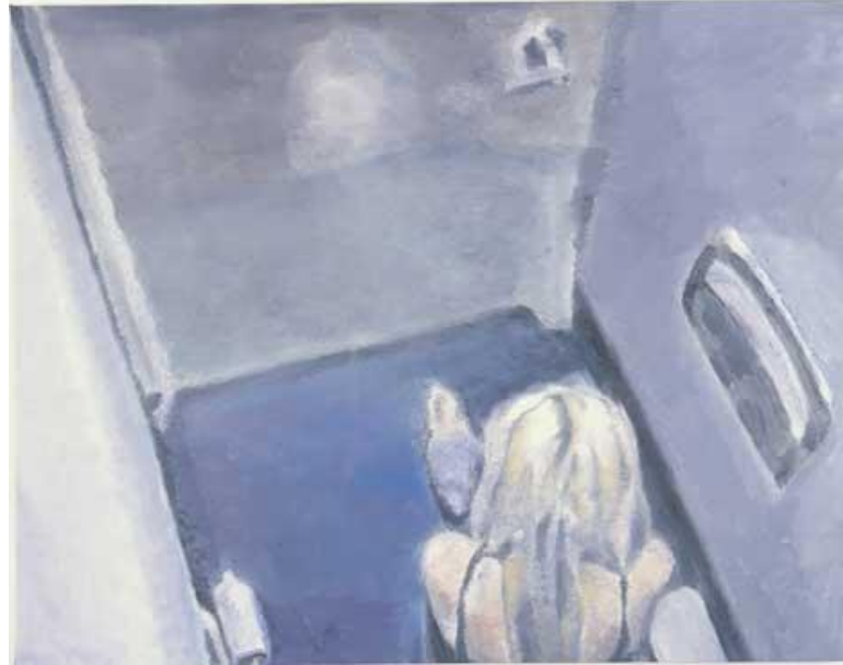
6. Luc Tuymans, Agujero Negro