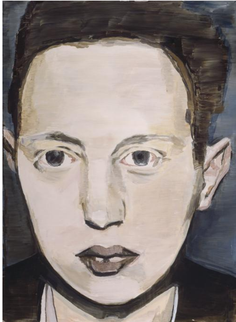
8. Luc Tuymans, Der Deagnostische Blink IV

Los tres elementos mencionados, nostalgia, silencio, y re-contextualización, también se encuentran presentes en mi exploración pictórica. Estos elementos me han ayudado a presentar una intención al momento de escoger las imágenes y utilizar la pintura para traerlas al recuerdo.