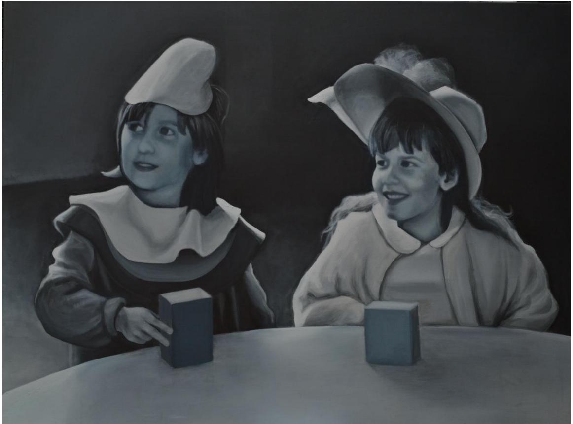
VIII. Cuatro años