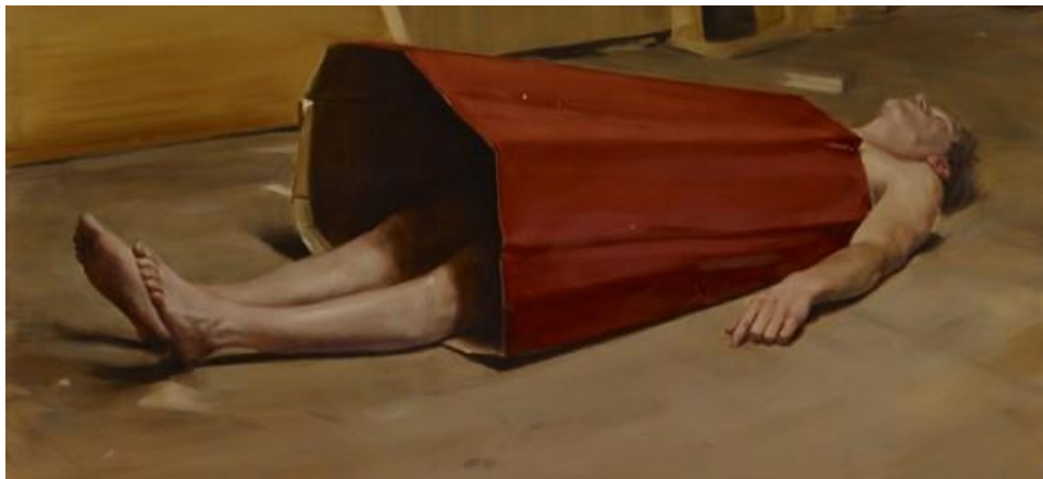
3. Michael Borremans, The Devil's Dress

retratan extraños maniqués plasmados en gestos vacíos, congelados; repeticiones cuidadosas y obsesivas de rituales oscuros; extrañas interpretaciones arquitectónicas y muñecas paralizadas, presenta a seres mudos participando en acciones que ni ellos mismos entienden. Están y no están, parecen sólo semiconscientes sobre lo que sucede, la situación en la que están metidas. Es como si parte de la acción hubiese sido cegada para el protagonista y, al regresar a la consciencia, nada tuviese explicación.