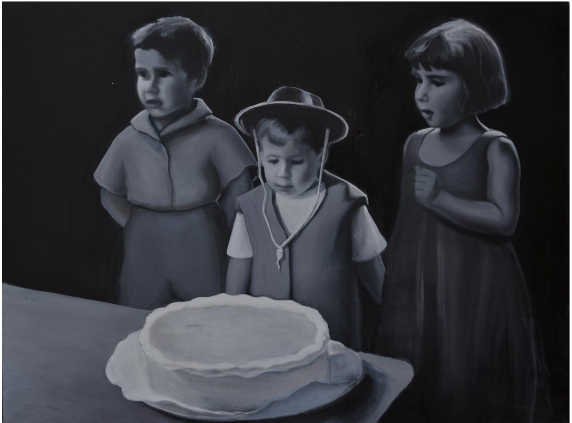
VII. Los niños