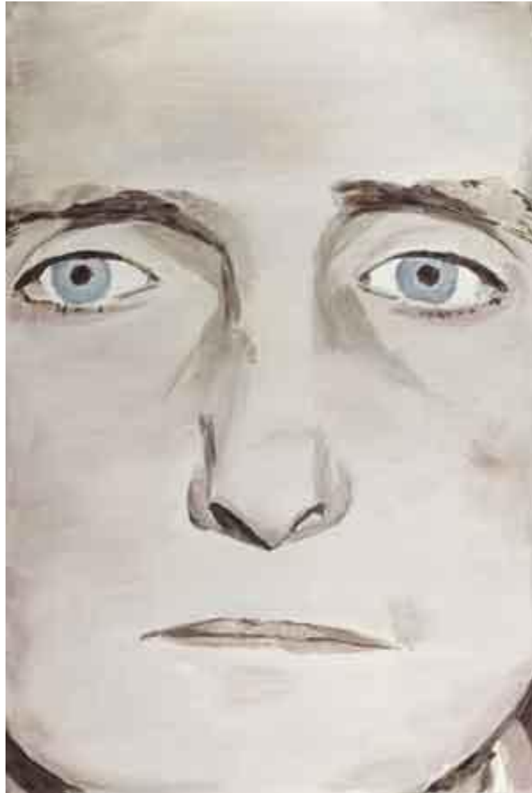
7. Luc Tuymans, Der Diagnostische Blink IV

Los elementos comunes en las obras de Tuymans son el manejo pictórico, caracterizado por imágenes de tonos fríos y soltura de trazos; y una elaboración similar que parte del vaciado y posterior re-contextualización de escenas aisladas rescatadas de los medios de comunicación.