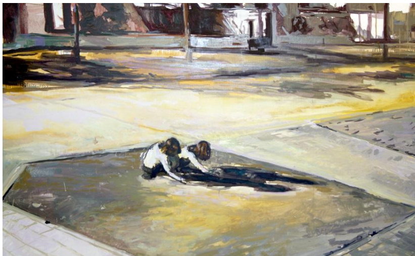
1. Natalia Babárovic, Las niñas

Su obra se basa en fragmentos de recuerdo plasmados en distintas fotografías y recortes de periódicos dispersos [...] se pueden ver escenas representadas con colores más artificiosos, más alejados de la realidad, puros, efectos lumínicos evanescentes que acentúan la melancolía de las escenas. (Loewenthal, 1979).