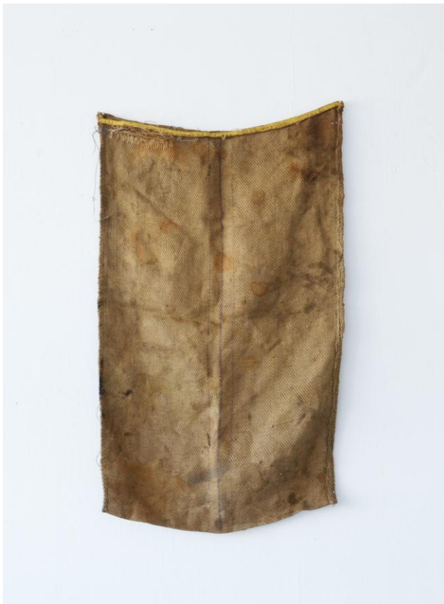
“Sin título” 2015