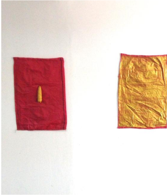
“Sin título” 2015