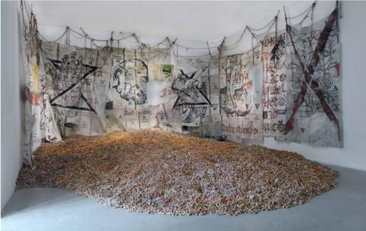
Yisa y Mato. "Merma" 2015 (Fig.3)

Habiendo conocido algunos referentes respectivos a mi obra, cabe destacar aspectos similares y comparaciones entre mi obra y la de ellos.