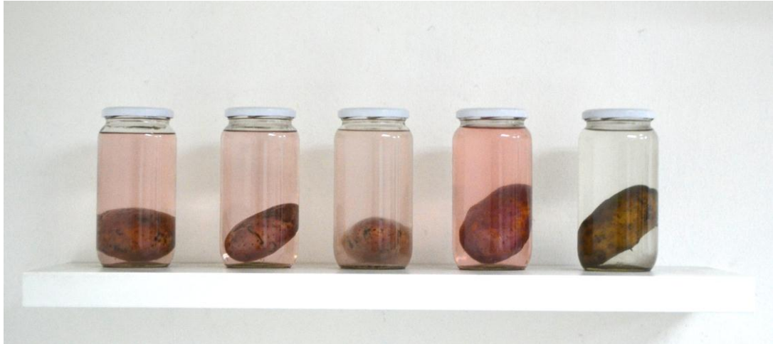
“Sin título” 2015

Otro aspecto importante en mi obra son las materialidades encontradas en la Vega Central. Aquí encontramos distintos tipos de sacos plásticos de los cuales se seleccionaron dos según el uso que tienen en el lugar de dónde provienen. Primeramente se eligieron dos sacos de plástico rojo, los que están compuestos por un tipo de tejido mecanizado. Se escogieron específicamente sacos de material plástico brillante liso y de color rojo. Luego de ser seleccionados los sacos pasan a ser intervenidos a modo de Collage con pintura o con sobre posición de elementos sobre sus superficies. Habiendo finalizado la obra nos ocupamos del montaje, donde los sacos irán adheridos por su parte posterior directamente al muro blanco, un poco más arriba del eje visual promedio.