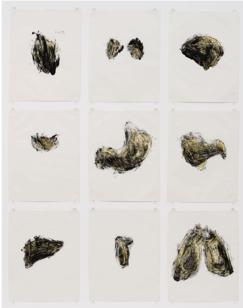
Kiki Smith. " "Possession is NineTenths of the law", 1985 (Fig.4)

Luego de abrir el maletín y continuar con su acción, Leppe utiliza el excremento para formar una escultura de tipo precolombina en su cabeza. La obra del artista es un claro ejemplo de la utilización del cuerpo como entraña y desde su interioridad. Vemos aquí la utilización directa de un elemento que proviene desde el interior del artista, de sus mismas entrañas.