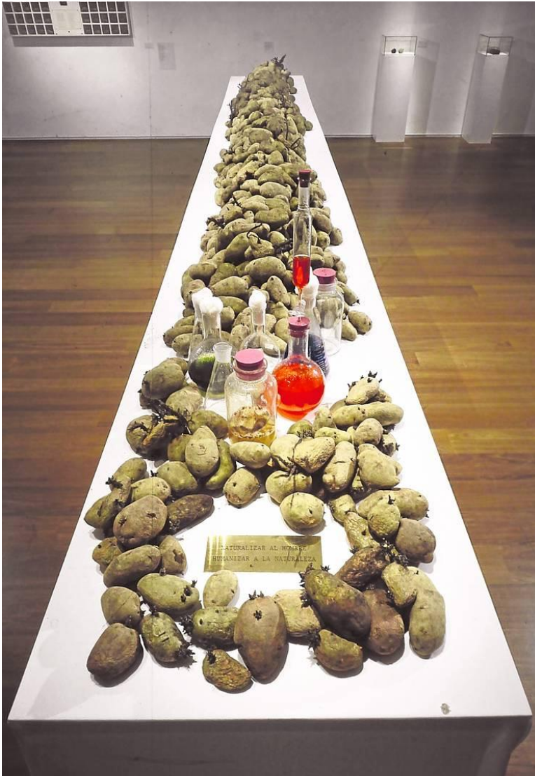
Víctor Grippo. "Energía Vegetal", 1977 (Fig.1)

origen y con el lugar donde crece, la tierra. Con sus obras logramos comprender la energía y valor que tiene la papa, y que proviene desde su origen en la tierra.