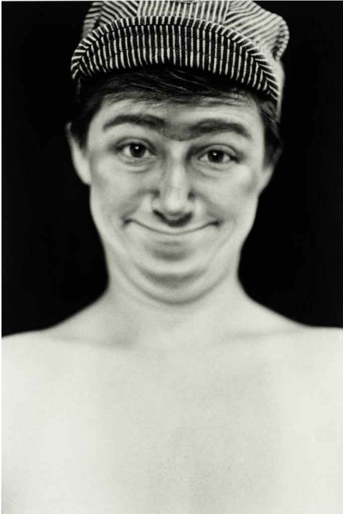
Cindy Sherman. "Untitled B", 1975 (Fig.6)