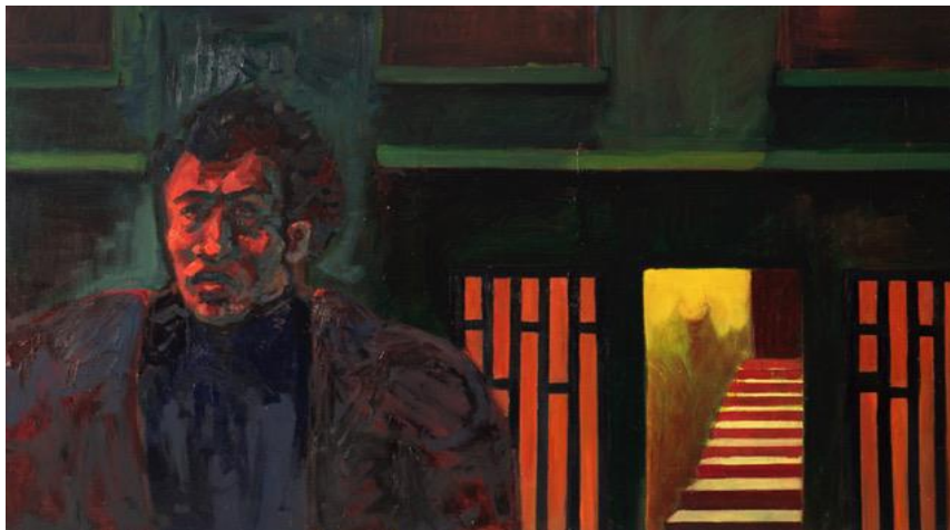
Navarro Belen, "sin titulo", Óleo sobre tela 170x90 2017

calles vacías, no sabemos si va o viene de un lugar, o que tan de noche es, solo lo vemos desorientado y harto de deambular, Aquí partí con la noción de relato, dicho relato que sugiere más que contar. También está el trabajo más profundo de escenario (en este caso elegí partes del barrio Bellavista) que el escenario sea igual de decidor, que el mismo personaje. Este última fue mi primer paso a la obra que estoy desarrollando hoy en día. Aquí mi error fue no manejar tan bien los detalles de la “historia”, por lo que las escenas no resultaban tan decidoras o tan evocadoras como debían serlo. Pero si rescato la idea del escenario y el personaje, como interactúa con su ambiente, y como detalles de este nos dice que algo sucedió. Una puerta abierta, una luz encendida. Elementos que al saber manejarlos construyen un relato. También las paletas de colores