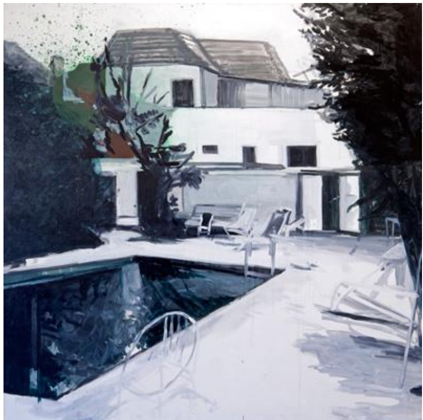
Swimming Pool III (2010)oil on wood, 120cm x 120cm