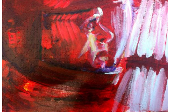
Navarro Belen, "odisea en el espacio"30x25, acrílico sobre madera 2015

Por eso partí con la idea de los personajes, planteándola de manera bastante escueta en