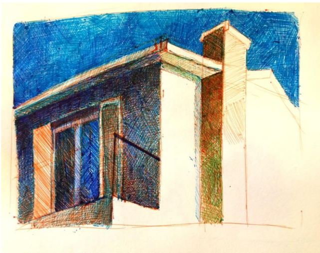
boceto casa de Algarrobo, lápiz sobre papel

Después comencé a hacer bocetos con lápices pastas, ya que sus colores