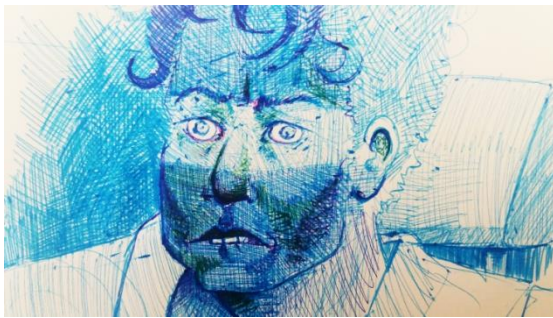
Boceto personaje, lapiz sobre papel

La construcción de este personaje se basaba en su interacción con el escenario, como su huella quedaba expresada en cada espacio de la casa. A medida que las obras fueron tomando cuerpo la presencia del personaje era cada vez menos necesaria, ya que el escenario, los objetos contaban lo que el personaje, con su figura humana no podía. Por sugerencia de mi profesor de pintura, decidí quitarlo de la obra, y quedarme únicamente con los escenarios y su huella, el personaje sigue allí, pero al igual que una persona que fallece, solo queda su marca en la tela, el vaso vacío, la silla aun tibia. Al quitarlo del cuadro, la atención se dirige a los objetos, el