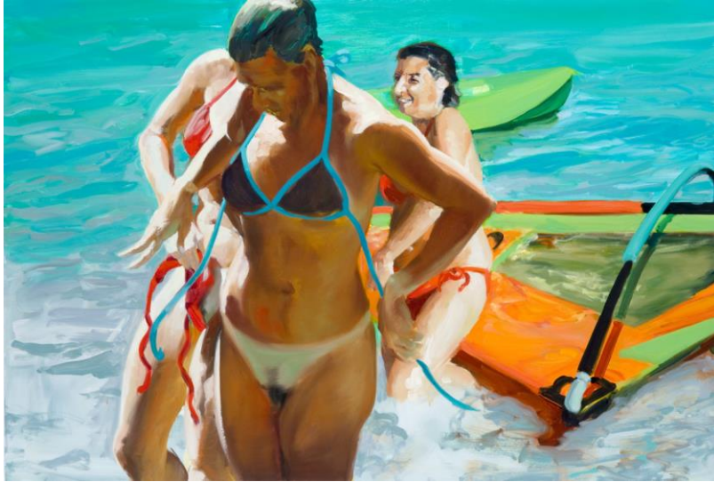
Eric Fischl "beautiful day" óleo sobre tela 135x198 2006

A la hora de elegir referentes, busco artistas que transmitan su imaginario de tal manera, que lo comprendamos como si fuera propio, que nos transporte a universos cargados de prejuicios, inquietudes y sensaciones personales, pienso que esto es lo que un verdadero artista debería hacer. Por lo mismo busco referentes cuyas cualidades quiera recrear en mi propia obra, ya sea temáticamente, o de manera atmosférica, compositiva o técnica. La mayoría de mis referentes son figurativos, la misma temática que manejo, pero abarcan la figuración de una manera más expresiva y pictórica, y muy alejada de la idea de hiperrealismo, sino mas bien acercándose a la idea materia de la pintura. Un ejemplo es Eric Fischl el cual trabaja a partir de fotografías y respeta la alteración que esta hace. Trabaja sobre un imaginario estadounidense burgués y deteriorado, con personajes erotizados y puestos en situaciones enigmáticas. La temática de decadencia y la técnica con que trabaja la "carne" humana, es lo que me atrajo de este artista. Su trabajo en la figura