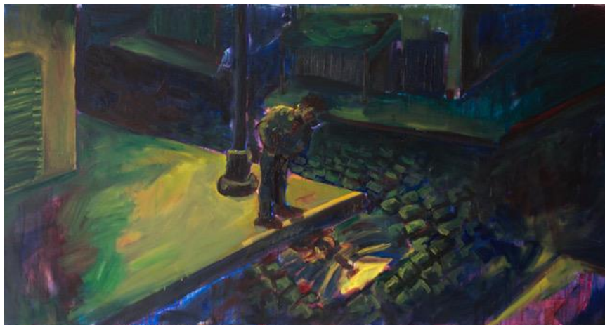
Ilustración 1 Navarro, Belen, "sin titulo", oleo sobre tela 170x90 2017