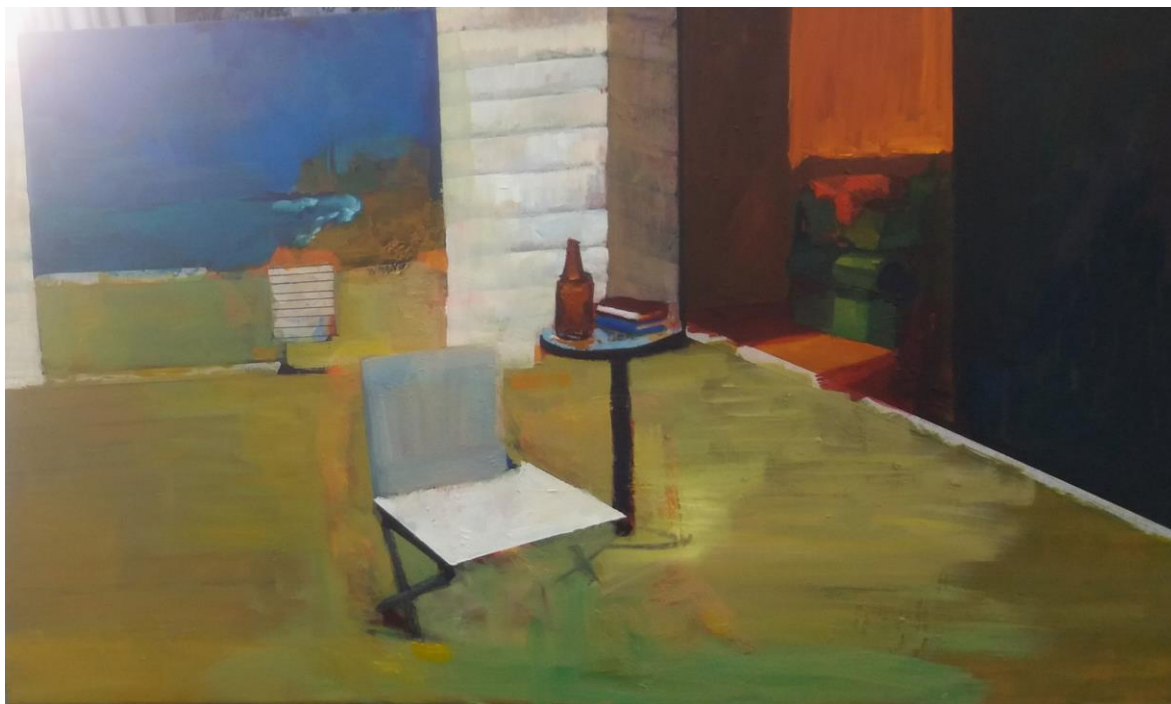
pintura con personaje