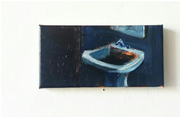
Ilustración 2 Navarro, Belen "sin titulo" 30x15, 2017