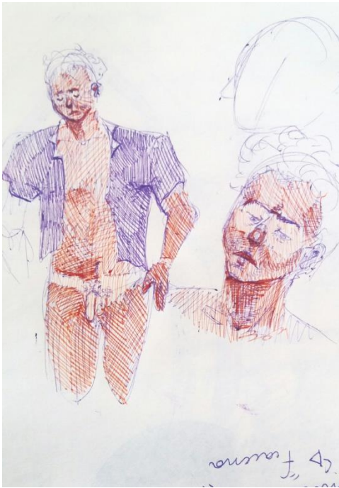
Boceto personaje, lapiz sobre papel

manera pictórica, evidentemente en el traspaso a pintura, la imagen cambia, adecuándose al vocabulario de la pintura.