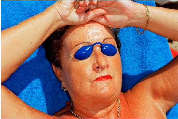
Martin Parr de la serie "life's a beach" 2012

humana, crea personajes perfectamente reales sin dejar de tener esa expresión materica.