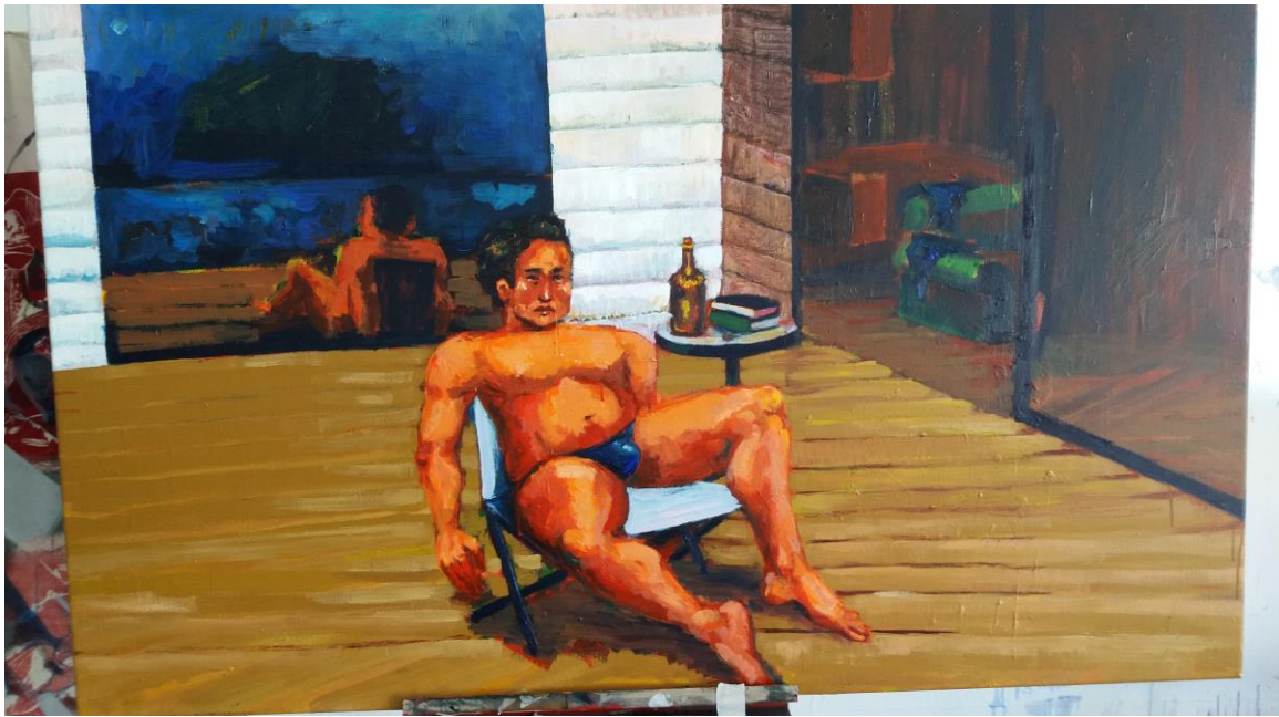
pintura sin el personaje