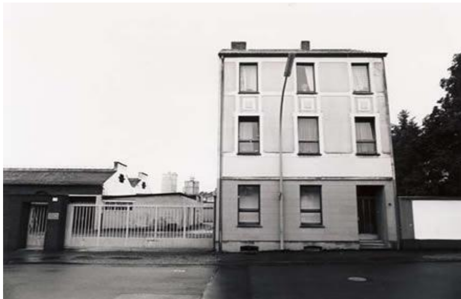
(Img. 5) “Casa Ur” vista de afuera

Cuando hace una muestra de su obra ofrece un café y se sienta a conversar. Por medio de un mecanismo de motor, el suelo ha girado cuarenta y cinco grados y la puerta, en vez de quedar detrás, queda a la derecha. Del mismo modo hay estancias en las que entra la brisa desde el exterior y por la otra ventana se cuele la luz del sol. Pero no es real. Un ventilador silencioso y luces de neón determinan el efecto.