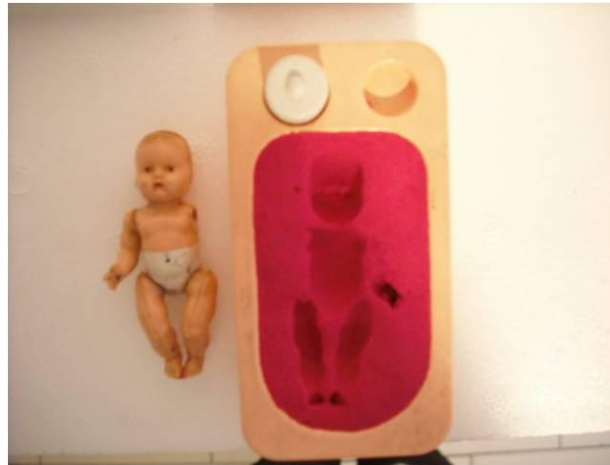
(Img. 3) 2009. Instalación de juguetes y plastilina con arena.

El trabajo diario en la obra me hizo percibir que un concepto sobresalía sobre otros: el vacío . Esta sensación de vacío estaba ligada a la angustia de tener sentimientos ambivalentes y construyó escenarios, frutos de una soledad en silencio, la ansiedad de esperar respuestas de otro ser que estaba inerte. Viví esperando respuestas.