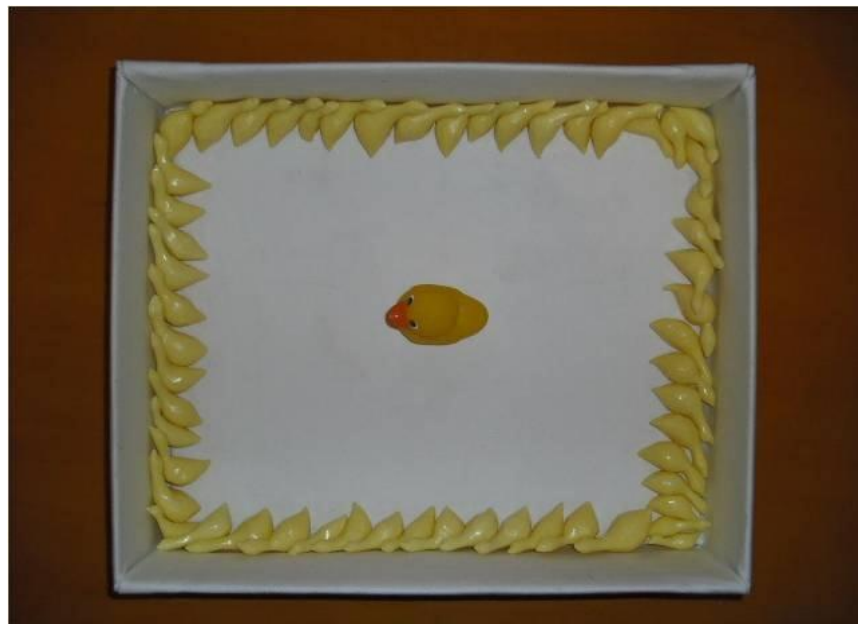
(Img. 2) 2009. Instalación, caja con patos de jabón hechos a mano y pato de plástico. (40 x 30 x 15 cm.)