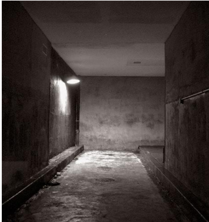
(I mg. 6)