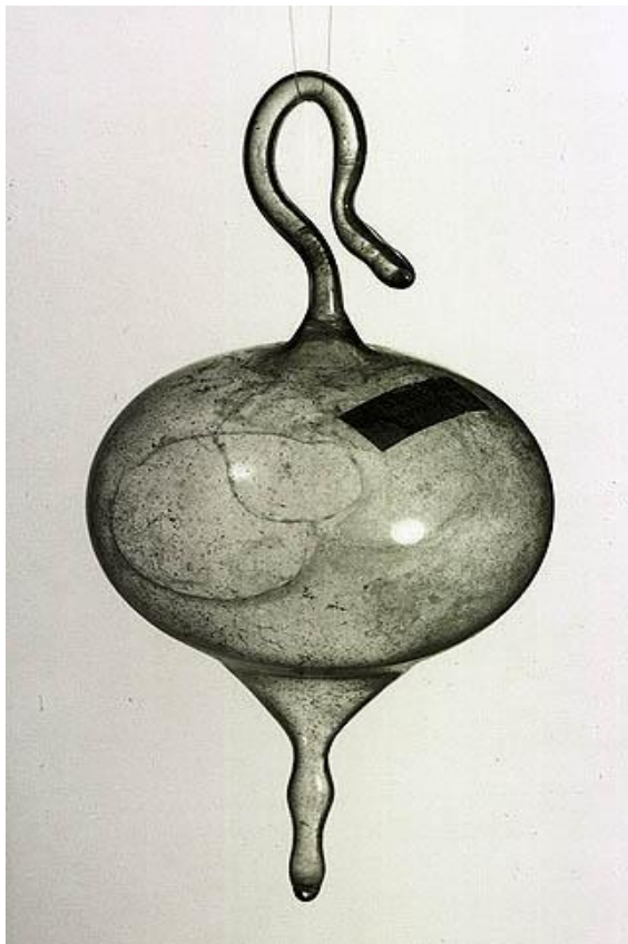
(Img. 4) Marcel Duchamp “El aire de Paris” (1919)

determinado contexto es lo que le da potencia a la obra, cambia el estado normal de los objetos y por medio de decisiones y sutiles transformaciones, quiebra el concepto inicial de los objetos seleccionados, para dar una información ajena a la principal función que tiene este recipiente de suero fisiológico y se transforma en un contenedor de espacio que se puede trasladar y dar como obsequio, es una metáfora irónica de lo que ocurría en esos años, ya que el centro de la academia de arte se encontraba en Paris y el toma parte de esta ciudad y la lleva a Nueva York ,donde se relaciona con artistas que junto a él, están en una profunda reflexión de la nociones tradicionales del arte y cambian el escenario artístico por un escenario donde las ideas y pensamientos son lo que activa la obra, en el caso de Marcel Duchamp es por medio del simbolismo y el objeto descontextualizando su semántica, para dar origen a una nueva idea siempre vinculada a lo que sucede en su entorno a modo irónico.