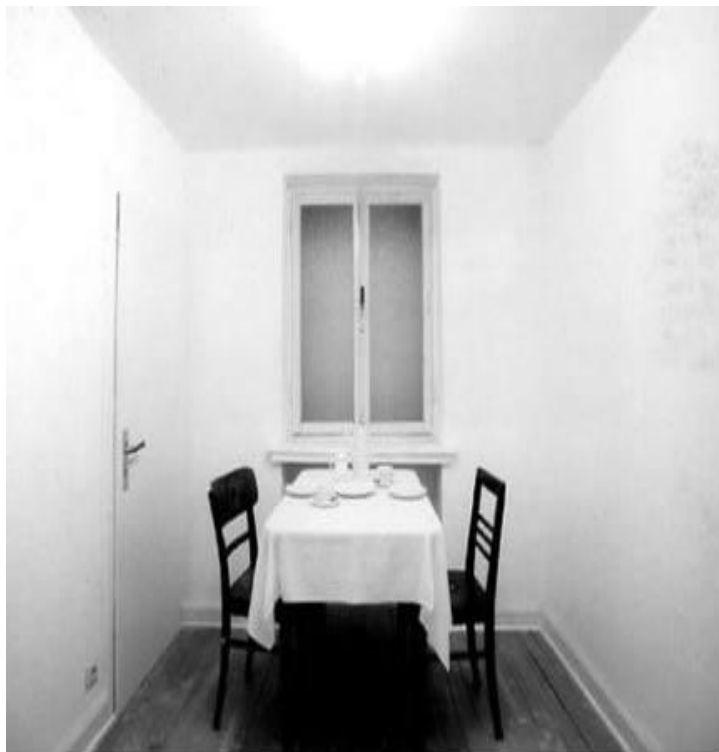
(Img. 7) Vistas internas de “Casa Ur”