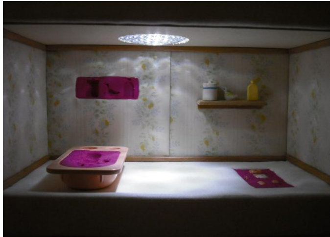
(Img. 1) 2009. Instalación de objetos, juguetes, masa de plastilina con arena.