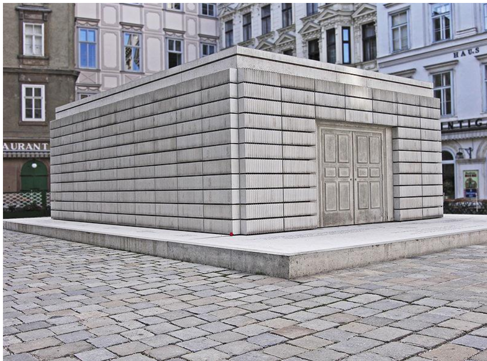
(Img. 9) "Holocaust Monument" 2008

En la obra Rachel Whitereade me interesa la forma en que aborda la atemporalidad, el querer guardar un momento del tiempo en una estructura sólida, las casas inhabitables que permiten ver el volumen de la muerte de un hogar. Ella trabaja con el negativo, hace un cambio de rol de lo que se entiende por vivienda, me interesa la forma en que resuelve algo tan inasible como es el vacío y ausencia y que a su vez esta presente su forma, lo asocio a un fósil, restos o señales de la actividad de organismos pasados, que han sufrido transformaciones en su composición y se transforman en cuerpos sólidos. De esta manera su obra hace presente y evidente el paso del tiempo por medio de un objeto que en el caso de las casas tiene una carga de refugio caducado.