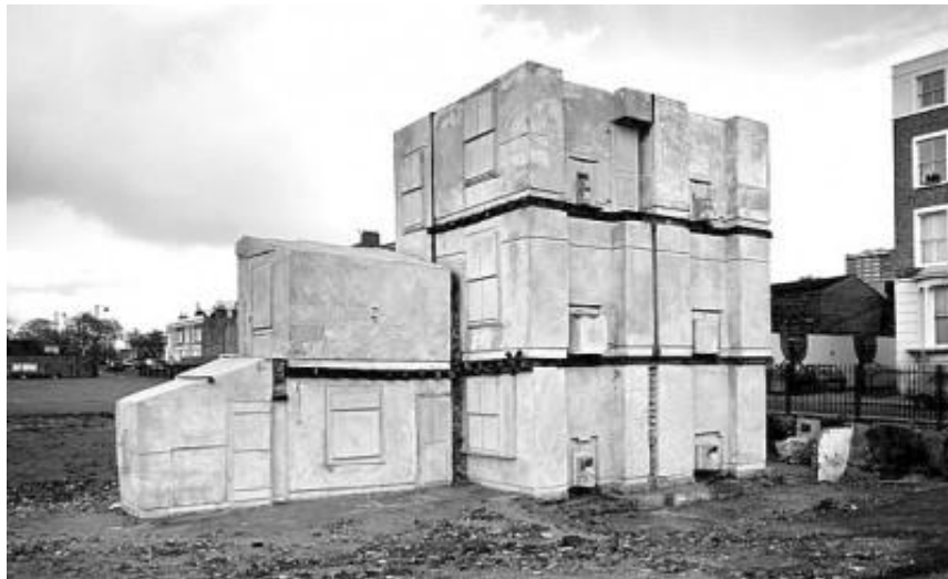
(Img. 8) “Casa 8” instalación, 1993

La carga que contiene el representar una casa ausente en sí misma, la copia de ella, en un material sólido, monocromo, logra que en el espacio quede plasmado un pasado específico y un presente que es el espectador. El significado que tiene la casa un lugar habitable que en algún momento del pasado fue un hogar de refugio y contención lo transforma e imposibilita su condición semántica de “casa” que es un lugar para habitar.