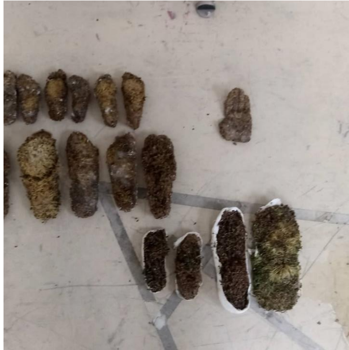
Imagen nº15: detalle de proceso “fallido” (2018)