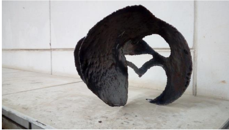
Imagen N º7 y 8: proceso de obra 2016.

A lo largo del mismo año los encargos dados fueron bajo la misma dinámica, en uno de ellos nos pidieron un autorretrato, el cual debía ser con moldes y debía ser llenado con algún material que nos interesara. En ese minuto, bajo lo que nos estaba sucediendo con mi familia, que era el cáncer de mi madre, las semillas de linaza se transformaron en una opción que llamaba firmemente mi atención, por lo tanto, después de un par de pruebas comprobé que las semillas estaban generando raíces desde el fondo y por fuera no era visible esta situación. Descubrí que esto sucedía porque el molde se me cayó y evidenció la maravilla que estaba por convertirse en mi tema principal, las semillas de linaza se aglutinaban con agua, tenían una baba viscosa que se llamaba mucilago, era lo principal de aquel material, que solo necesitaba el agua para crear un volumen y que además tenía las intenciones de germinar y de crecer.