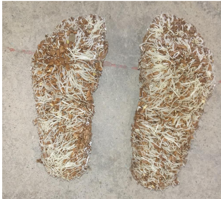
Imagen nº2: detalle de proceso (2018)