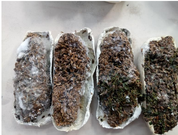
Imagen nº16: detalle de proceso “fallido” (2018)