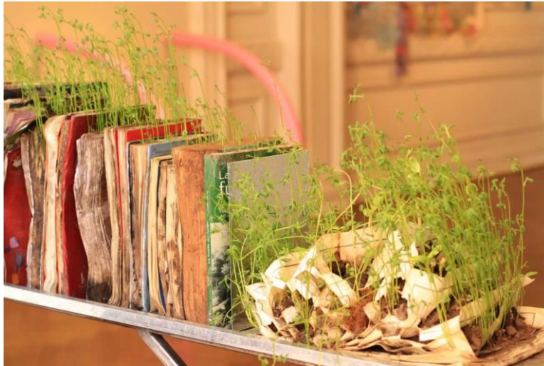
Imagen N °3: detalle de obra Pronoia.

plantear una visión optimista del valor y la trascendencia de las ideas de crecimiento y vida en los libros y la energía contenida en los periódicos