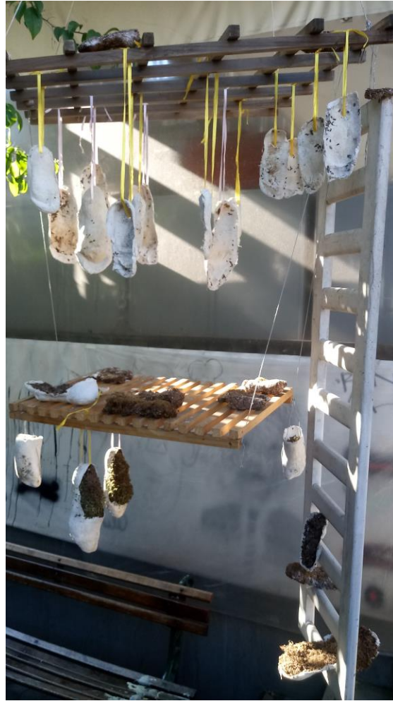
Imagen nº18: detalle de proceso, prueba de montaje (2018)