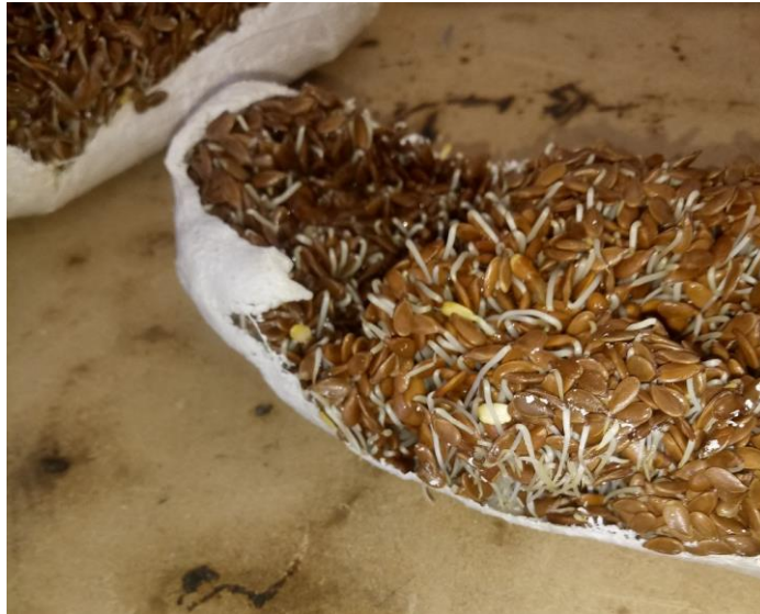
Imagen nº1: detalle de proceso (2018)

Somos plantas porque somos semillas antes de nacer, brotes cuando pequeños y árboles de grandes.