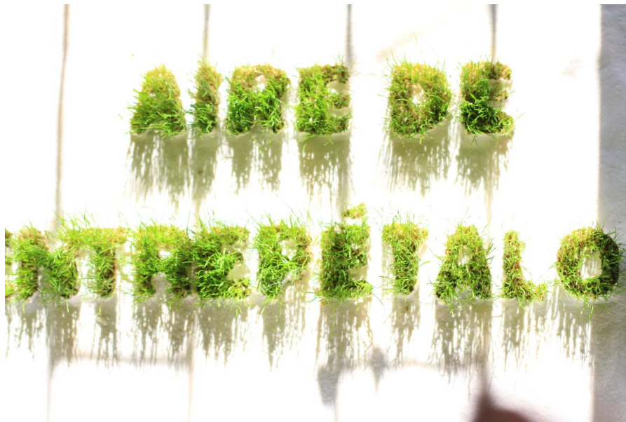
Imagen N °4: detalle de serie Selva Lírica.