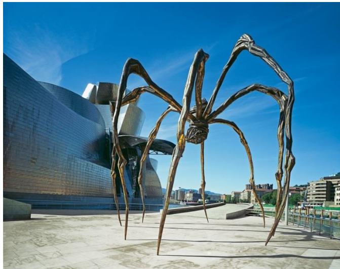
Imagen N°6: Mamá

_La araña es una oda a mi madre. Ella era mi mejor amiga. Como una araña, mi madre era tejedora. Mi familia tenía un negocio de restauración de tapices y mi mamá estaba a cargo del taller. Como las arañas, mi mamá era muy ingeniosa. Las arañas son presencias amigables que se alimentan de mosquitos. Todos sabemos que los mosquitos transmiten enfermedades y, por lo tanto, son indeseables. Así, las arañas son útiles y protectoras, tal como mi mamá. _ (Bourgeois, Louis)