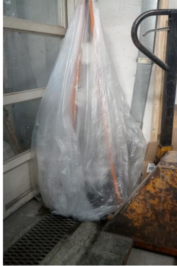
Imagen nº 13: detalle de proceso (2018)

Resulta evidente el tema del amor en la instalación, que, a pesar de ser intencionalmente precario o improvisado, funciona de tal forma que las semillas germinadas estarán alimentándose en un ambiente cálido y de expectación, lleno de ilusión, como lo es una madre con sus hijos.