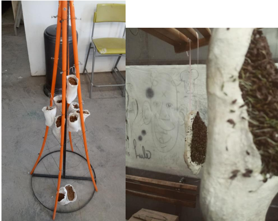
Imagen nº 11 y 12: detalle de proceso (2018)

La obra habla sobre la germinación dentro de un útero gigante, un invernadero. Esto se construye con una estructura de PVC cubierta con nylon incoloro, más bien de un color lechoso, tal y como si fuera una manta o una tela protectora, que protege a todas estas estructuras que contienen las diminutas semillas que deben germinar y seguir su curso natural de vida, alimentada cada una con hilo de cáñamo, que desciende por capilaridad desde varias botellas transparentes llenas de luz hacia los pies.