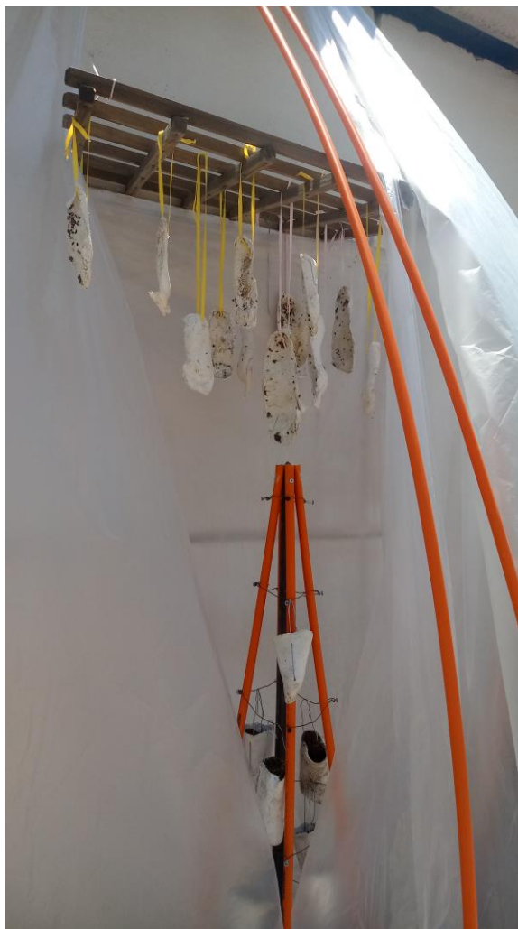
Imagen nº17: detalle de proceso, prueba de montaje (2018)