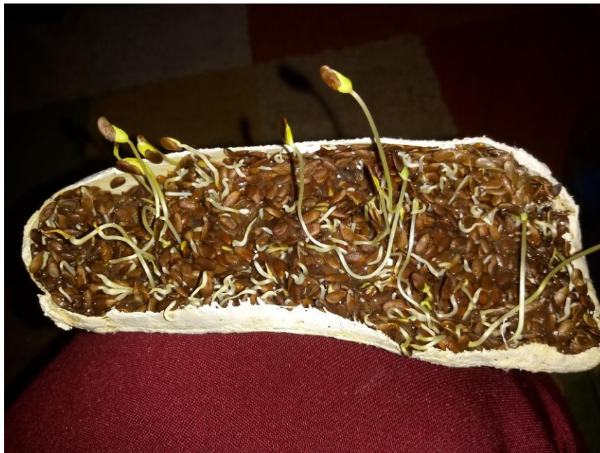
Imagen nº14: detalle de proceso (2018)