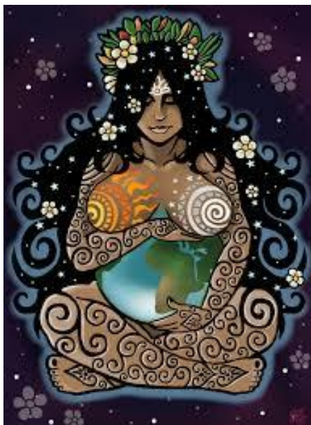
Imagen N° 5: Ecofeminismo

Otra referente que investigué fue a la artista Louis Bourgeois (1911-2010) quien desarrolla su obra a través de la escultura. Es conocida, entre muchas otras cosas, como la mujer que convirtió a su madre en araña, pues ella confiesa que nunca superó su muerte, descubriendo así, después de 50 años, que la mejor manera de representar su sentir eran las celdas, como una cárcel interior que la reconfortaba, como un refugio lleno de recuerdos.